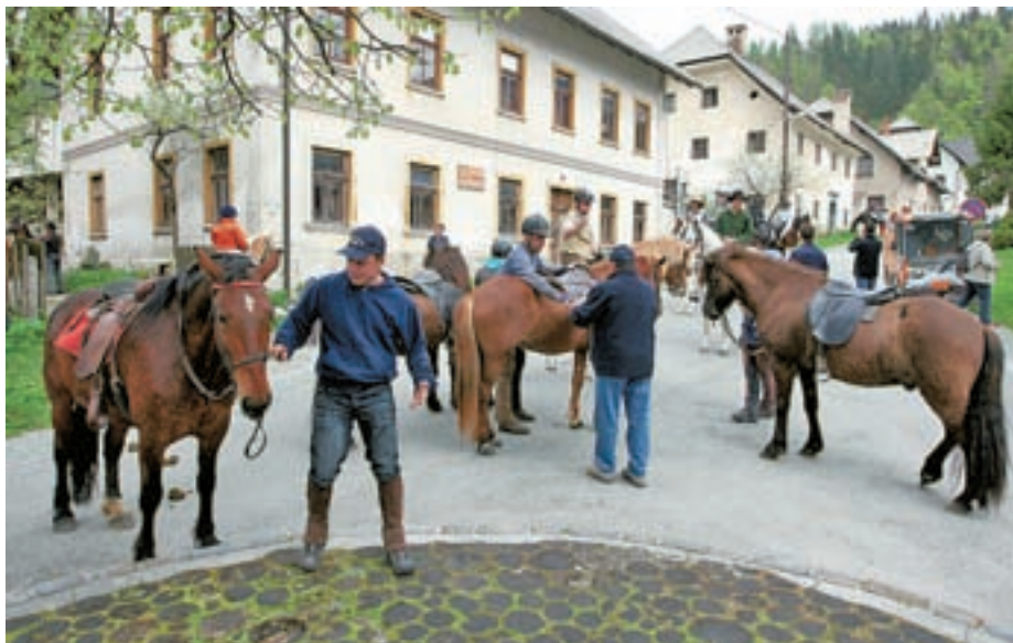
Na prvo majsko nedeljo so se na pot med Podkorenem in Kranjsko Goro odpravili konjeniki.