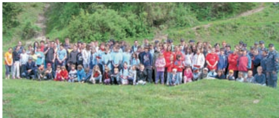
Na sobotnem tekmovanju na Dovjem se je pomerilo 33 ekip mladih gasilcev.

cevi, mladinci pa so imeli dodatno teoretično nalogo s področja preverjanja znanja o požarih v naravi. Rezultati: Med mlajšimi pionirji je zmagala ekipa Mojstrana 1, drugo mesto je zasedla Kranjska Gora 3 in tretje mesto ekipa PGD Gozd-Martuljek. Med mlajšimi pionirkami so bile prve gasilke iz PGD Podkoren, druga je bila ekipa PGD Dovje 2, tretja pa Dovje 1. Med starejšimi pionirji je prvo mesto zasedla ekipa Kranjske Gore, drugo mesto Rateče - Planica 2 in tretje mesto Gozd-Martuljek, med dekleti je bila najboljša ekipa starejših pionirk Dovje 1 in druga ekipa Dovje 2. Najboljši med mladinci so bili fantje iz ekipe Kranjska Gora 2, drugo mesto je zasedla ekipa Podkoren in tretje mesto Rateče-Planica. Med mladinkami je tekmovala le ekipa PGD Dovje. Prvi dve ekipi v vsaki kategoriji odhajata na regijsko tekmovanje, ki bo 12. junija v Prebačevem pri Kranju in ga organizira GZ Kokra. M. A.