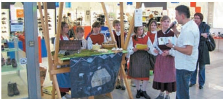
Na tržnici v Kranju so učenci razstavili maketo "bajte", kope, grbinastega travnika in jesena. Vse to so bile značilne sestavine rovtov.