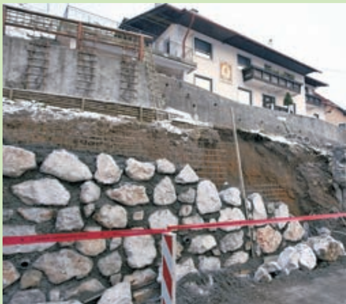
Podrti del zidu, ki se je konec preteklega tedna zrušil na cesto, je izvajalec takoj zgradil na novo.

Šestnajst metrov novega opornega zidu, ki se je v Ratečah podrl pred kratkim, so že zgradili nazaj. Kot so pojasnili na Občini Kranjska Gora, ki je s tisoč evri financirala gradnjo, je do nepredvidenega dogodka prišlo pri prestavitvi vodovoda ob novozgrajenem zidu. Ta je bil postavljen v okviru izvedbe vzdrževalnih del na lokalni občinski cesti. Kot je pojasnil direktor občinske uprave, se je pri prestavljanju vodovoda ustvarila plitva "dršina" pod temeljno peto, po kateri se je zaradi aktivnega zemeljskega pritiska zaledenega pobočja premaknil del zidu in se nato zrušil na cesto. M. A.