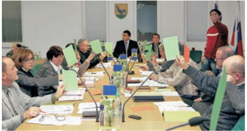
Občinski svet je na seji v začetku decembra potrdil proračun za leto 2010.

Proračun občine za leto 2010 ostaja na približno enakem nivoju kot letošnji. "Sami prihodki so nekoliko nižji, a razlika nastaja predvsem zaradi manjšega zneska prihodkov od sofinanciranj. V letu 2009 smo namreč gradili Slovenski planinski muzej, ki je financiran tudi iz evropskih strukturnih skladov. Ostali prihodki so približno primerljivi z letošnjimi. Med letom se bo pokazalo, kako bo šlo, a glede na izkušnje menim, da smo tako porabo kot prihodke kar realno načrtovali, tako da kakšnih težav ne bi smelo biti," je optimističen župan. "Na odhodkovni strani se pozna, da že nekaj let v zaključnih računih izkazujemo presežek.