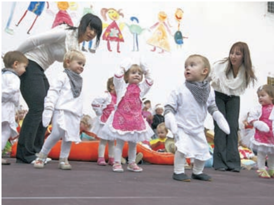
Slovesno na prireditvi ob 40-letnici vrtca

"Ponosni smo, da do zdaj v vrtcu nismo zavrnili še nobenega otroka," je zadovoljen ravnatelj Brezavšček. "Vedno smo poiskali možnosti, da sprejmemo vse. Zadovoljni pa bi bili, če bi sedanji vrtec v prihodnosti lahko dogradili - načrt širitve celo že obstaja. Idealno bi bilo, če bi pridobili dodatni dve igralnici in večnamenski skupni prostor." M. A.