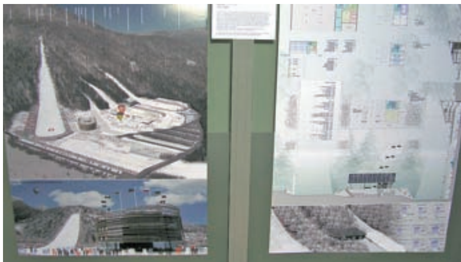
Idejne rešitve so razstavljeni v predverju Občine Kranjska Gora.

Kot je povedal, je bilo njegovo sodelovanje v natečajni komisiji za projekt Nordijski center Planica pozitivna izkušnja. "Imeli smo številne sestanke, kjer smo analizirali prispelle rešitve; seveda nobena od njih ni optimalna, je pa res, da obe sta prvo nagrajeni, ena s področja urejanja krajine in druga same arhitekture, presegli ostale. Prepričan sem, da bomo ob upoštevanju vseh danosti v prostoru našli najbolj optimalno postavitev celotnega centra."