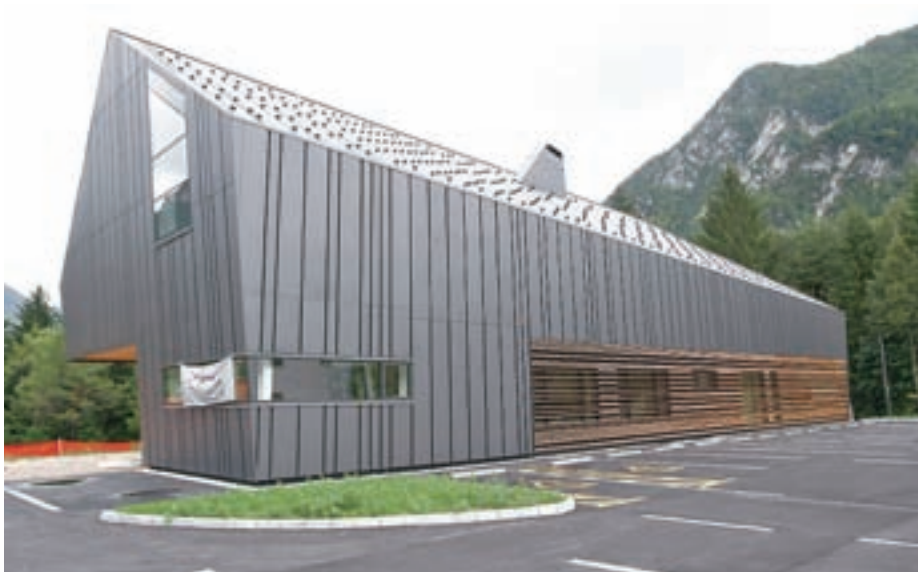
Slovenski planinski muzej v Mojstrani