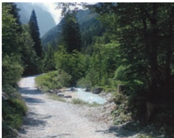
Pot z Eriškega mostu vas bo ves čas vodila ob prijetno hladni vodi,

Uro hoda od mostu pred nekdanjim hotelom Erika in že boste v objemu gora, v Malem Tamarju. Pot je primerna za vsakogar, lepo urejena, dokaj senčnata in ob prijetno hladni Pišnici. Med prijetnim izletom je nastalo nekaj foto utrinkov.