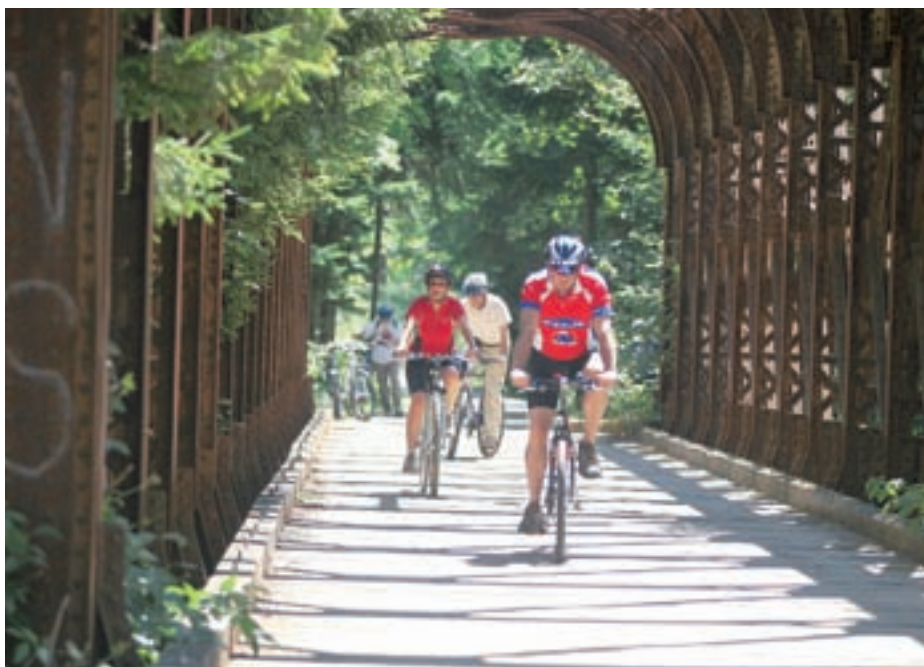
Vse več obiskovalcev, predvsem tistih, ki pridejo za en dan, se v Kranjsko Goro odpravi zaradi dobrih možnosti za kolesarjenje od Mojstrane pa vse do Trbiža.