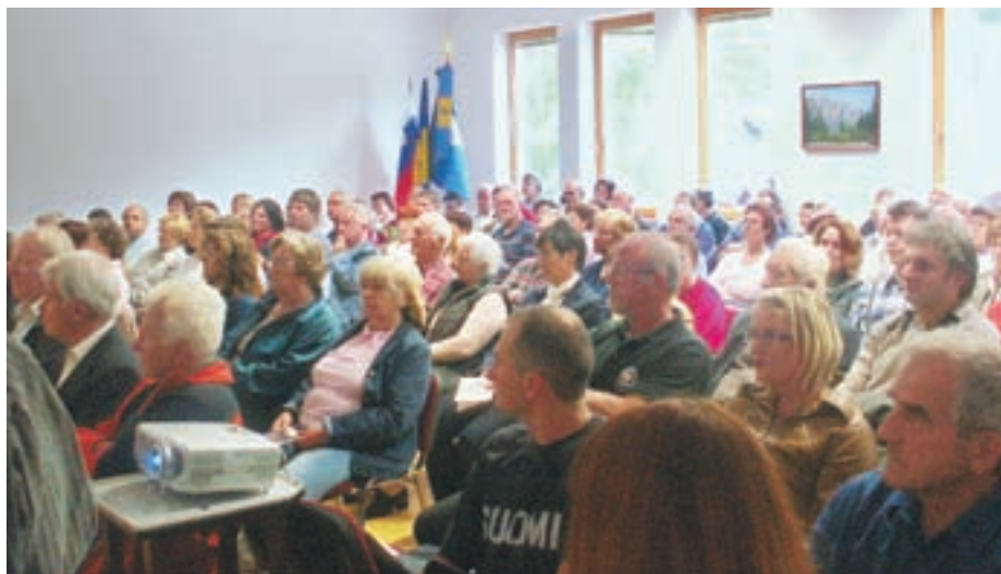
Slavnostne akademije se je udeležilo več kot 120 članov društva.

”Društvena priznanja so bila podeljena posameznikom in organizacijam, ki večinoma za svoj prispevek v društvu še niso prejeli priznanj Pla-