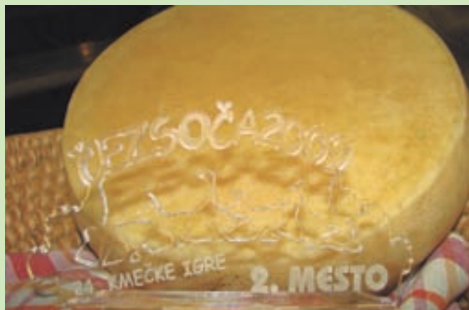
Na tekmovanju ni štel čas, temveč kakovost opravljenega dela.

Člani ekip Libelič, Livka, Kamnika, Povirja, Čezsoče in Podkorena so se pomerili v treh igrah, v katerih je štel le kakovost opravljenega dela. ”V prvi igri, ki se je imenovala ”muža an sirjenje” - molža in sirjenje, smo se pomerili prav v teh dveh opravilih,” pripoveduje Bernarda