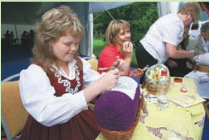
Na prireditvi so se predstavile tudi klekjarice iz Idrije.

Zanimivo je, da je bilo posebej veliko zanimanje za tako imenovane slow food večerje, na katerih so se predstavili trije vrhunski kuharji: