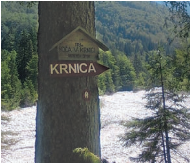
Nato pa še 20 minut hoje in prispeli boste do Koče v Krnici.