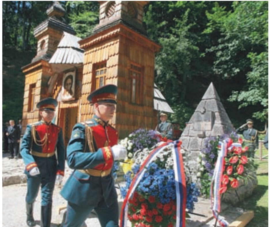
Spominu na preminule ruske ujetnike se je tudi letos poklonila številna ruska delegacija.

Tudi letos je na zadnjo nedeljo v juliju Društvo Slovenija-Rusija na spomin na tristo ruskih vojnih ujetnikov, ki so leta 1916 umrli v snežnem plazu, pripravilo spominsko slovesnost ob Ruski kapelici pod Vršičem. Udeležilo se je nekaj sto obiskovalcev ter številni visoki gostje iz Slovenije in Rusije. Častni pokrovitelj, predsednik Državnega zbora dr. Pavel Gantar je slovesnost označil za posebej prijazno priložnost za utrditev slovensko-ruskega prijateljstva. "Prva svetovna vojna je dvajsetemu stoletju vtisnila neizbrisen in tragičen pečat," je v slavnostnem nagovoru med drugim dejal Gantar. "Množice vojakov je pahnila v blatne strelske jarke in jih za vedno vklenila v trajen kolektivni spomin na vojno grozoto. V nečloveških bojih je vojna združila vojake različnih narodnosti in veroizpovedi. Na te boje nas danes - med drugim - spominjajo številna vojaška pokopališča, posejana po ozemlju Slovenije, ki izpričujejo človekovo krhkost, pa tudi