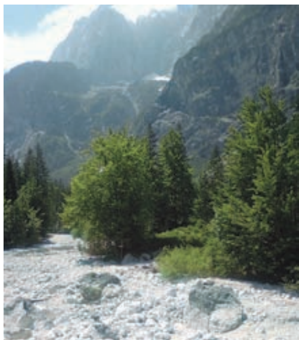
Tik pred Malim Tamarjem je narava dodobra pokazala zobe.