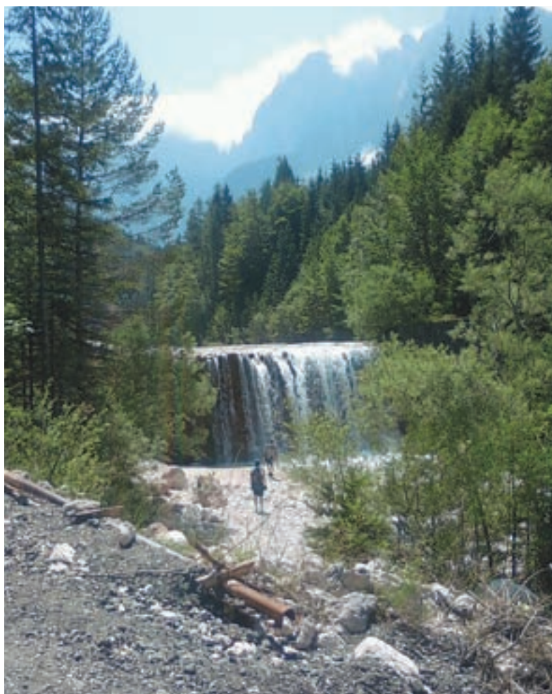
Mali slap marsikoga privabi k fotografiranju.