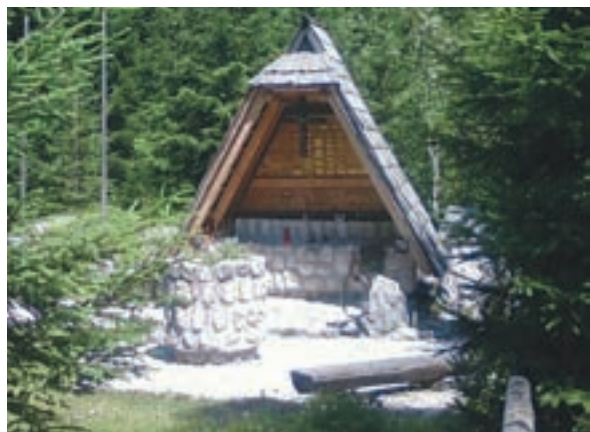
Postojite lahko ob obeležju planincem, ki so umrli v gorah.