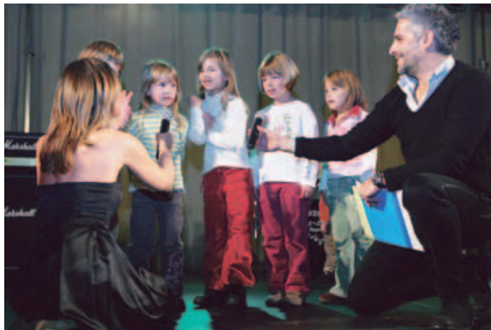
Tina Gorenjak in Sebastian Cavazza v družbi naključnega pevskega zborčka