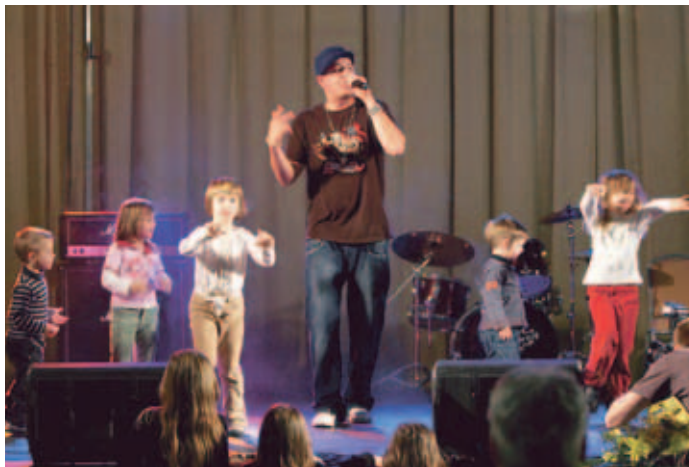
6 pack Čukurju so se na odru pridružili tudi plesno razpoloženi otroci iz občinstva.

Na predzadnji sobotni večer v mesecu novembru je bil v kranjskogorski dvorani Vitranc dobrodelni koncert za Male Borce. Koncert sta organizirala družba Hit Alpinea Kranjska Gora in humanitarno društvo Gumbek.