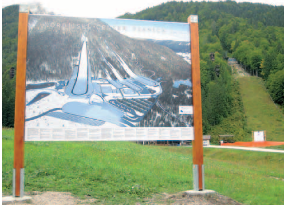
Takole bo videti novi Nordijski center.