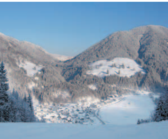
Korensko sedlo pozimi - pogled z Vitranca

Korensko sedlo je 1.073 metrov visok cestni gorski prelaz v zahodnih Karavankah, ki povezuje Zgornjesavsko dolino v Sloveniji z avstrijsko Koroško. Viri o izpričani tlakovani cesti preko prelaza segajo v petnajsto stoletje, medtem ko ljudsko izročilo govori, da naj bi preko Korenskega sedla vodila že stara rimska cesta. Tudi Ciril in Metod naj bi na se na svoji poti v Rim, s posmrtnimi ostanke Svetega Klemenca odpravila preko Korenskega sedla. Trgovska pot preko Korena je pustila svoj pečat tudi tri kilometre oddaljeni vasi Podkoren, kjer je bilo nekoč mogoče najti kar nekaj vaških gostiln, ki so ponujale okrepcilo popotnikom in trgovcem. Preko prelaza je nekoč vozila poštna kočija, pri Čošeljnu (domačija Rasinger) pa so prepregali konje. V začetku druge svetovne vojne so prišli tudi nemški okupatorji in zajeli nekaj domačih fantov, ki so jim želeli postaviti barikade. Tudi v vojni za Slovenijo je mejni prehod na vrhu prelaza predstavljal pomembno strateško točko. Do izgradnje karavanškega predora je pot predstavljala glavno prometno povezavo s Srednjo in Zahodno Evropo, do nedavnega pa je bila na vrhu prelaza tudi mejna kontrola ob vstopu v Avstrijo. Tako so se ob poti preko korenskega sedla skozi zgodovino spletle različne zgodbe.