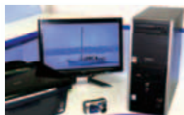
Slika je simbolična

Doplačilo za fotoaparat Fujifilm A-900 119 €