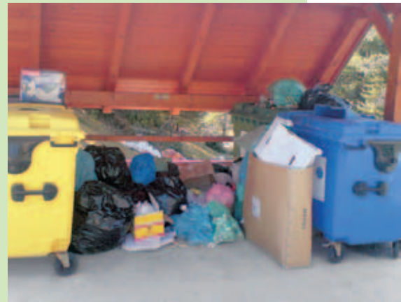
Jasna - eko otok v nedeljo zvečer

Odlaganje odpadkov in ravnanje z njimi je zrcalo naše civiliziranosti. Zato se sprašujem, kdo ste tisti packi, ki odlagate svoje smeti na neprimernih mestih, med zabojnike na eko otokih, ob koših na počivališčih. Pred vami in vašimi smetmi niso varna niti pokopališča.