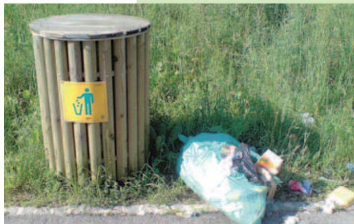
Počivališče ob kolesarski stezi - ponedeljek zjutraj

Cesta železarjev 7a, Jesenice, tel. 58-36-444, www.3bm.si