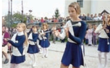
DVE SKUPINI MAŽORETK SO NAJNOVEJŠA PRIDOBITEV DRUŠTVA.