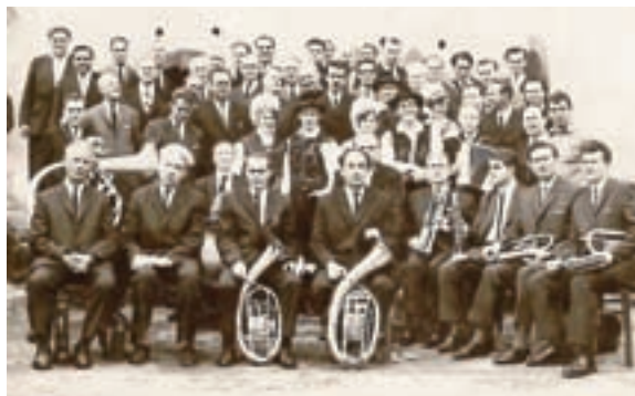
PIHALNA GODBA IN DIATONIČNA HARMONIKA

Pri narodnozabavnih skladbah prevladujeta dva ritma: polka in valček, stari ritimi, ki so jih izvajale godčevske skupine, kot sta ceperle in mazurka, pa so skoraj pozabljene. V zadnjem času so z vplivom moderne popularne glasbe prisotni tudi drugi pop ritmi. Tako mnogo ansamblov dandanes ne izvaja samo narodnozabavne glasbe, ampak tudi zabavno, turbo-folk in drugovrstno glasbo.