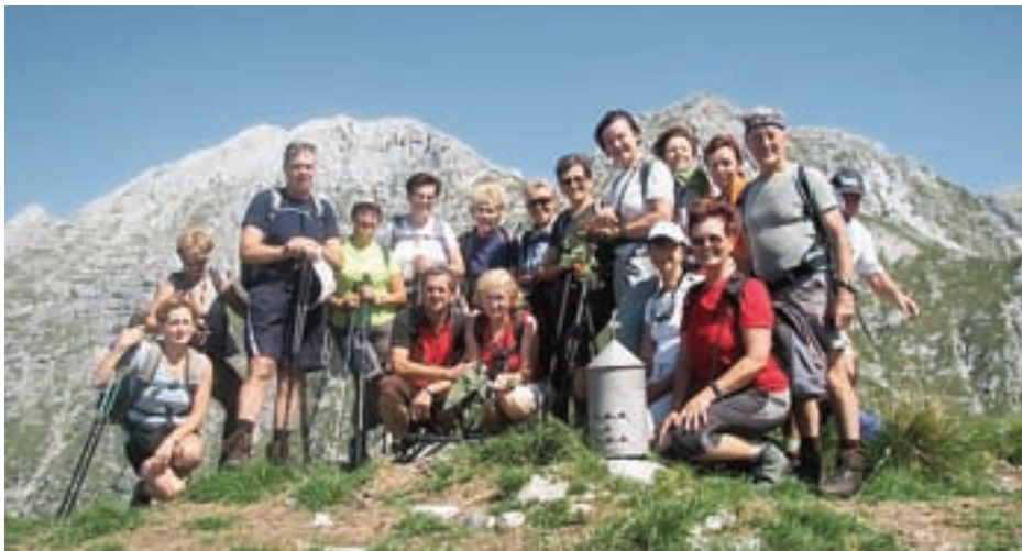
NA ENEM OD DRUŠTVENIH IZLETOV

Dvanajst izletov bodo organizirali tudi v letošnjem letu. Kam in kdaj se bodo odpravili v gore, bodo javnost obvestili z razpisom, obešenim v oglasnih omaricah v Zg. Besnici pred gostilno oz. pošto, ter v RC Vogu v Sp. Besnici, kjer so na ogled tudi slike z njihovih izletov.