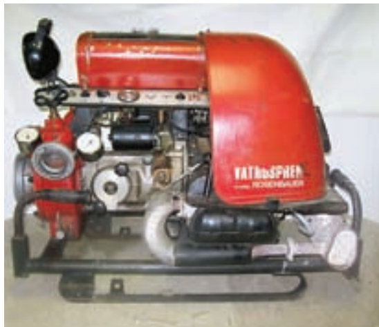
MOTORNA ČRPALKA ROSENBAUER

je bil nato kar nekajkrat prestavljen in kasneje tudi ni bil opravljen. Kaj je botrovalo temu, ni znano, verjetno pa so bile krive razmere, ki so najavljale bližajočo vojno. Črpalka je bolj ali manj uspešno, zaradi stalnih okvar, služila svojemu namenu do leta 1977.