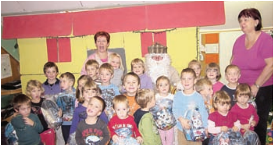
STAREJŠO SKUPINO OTROK JE V VRTCU OBISKAL DEDEK MRAZ.