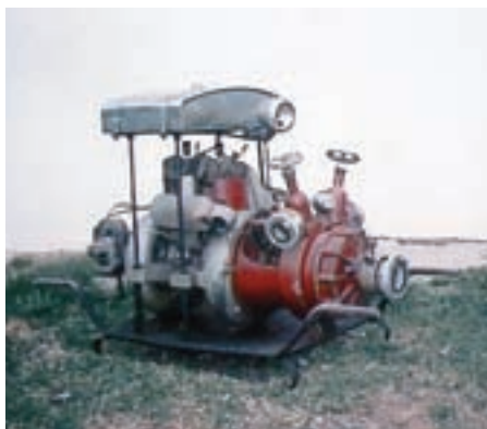
MOTORNA ČRPALKA ILO