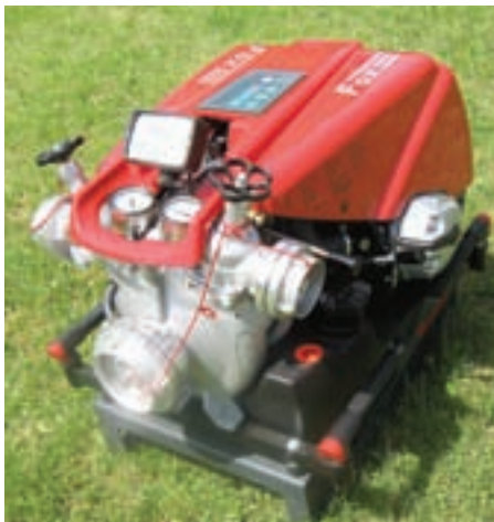
MOTORNA ČRPALKA ROSENBAUER FOX III.