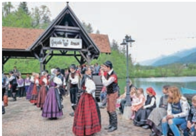
Ob jezeru so zaplesali domači folkloristi.