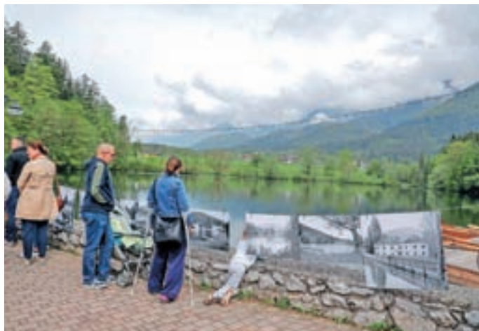
Razstava fotografij Preddvora brez jezera Črnava in z njim

klornega društva. Zatem so se opogumili tudi obiskovalci in zapluli po jezerski gladini. Medtem pa je na hotelski terasi potekala dobrodelna prireditev zavoda Gibaj in zmagaj Veslanje za otroške sanje, kjer so z nastopi znanih glasbenikov in drugih javnih osebnosti, veslanjem in prodajo dresov znanih slovenskih športnikov zbirali denar za športni tabor otrok na Rogli.