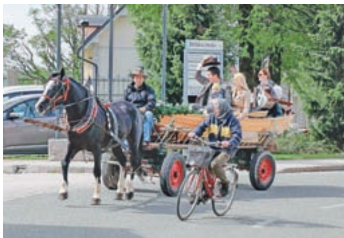
Eden od treh novih čolnov za jezero Črnava je prispel s konjsko vprego v družbi župana z družino in ob zvokih harmonike.