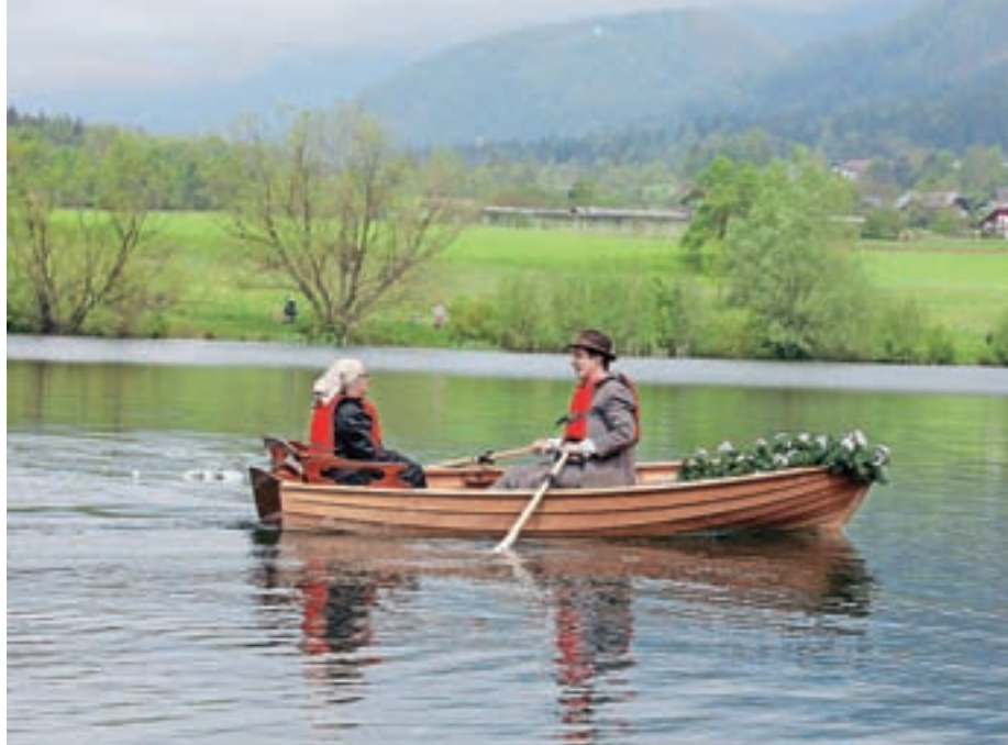
Po jezeru Črnava so zapluli čolni.

Najbolj pester po dogajanju je mesec junij, ki bo v znamenju občinskega praznovanja. Napovedala ga bosta Slavnostna akademija s podelitvijo občinskih priznanj ter sveta maša s spravo v cerkvi sv. Miklavža v Mačah, zaključila pa tradicionalni Petrov sm'n in Petrov mednarodni folklorni festival. V začetku meseca bo luč ugledala obsežna knjiga o rodbini Wurzbach, ki velja za utemeljitelje turizma v Preddvoru. Ju-