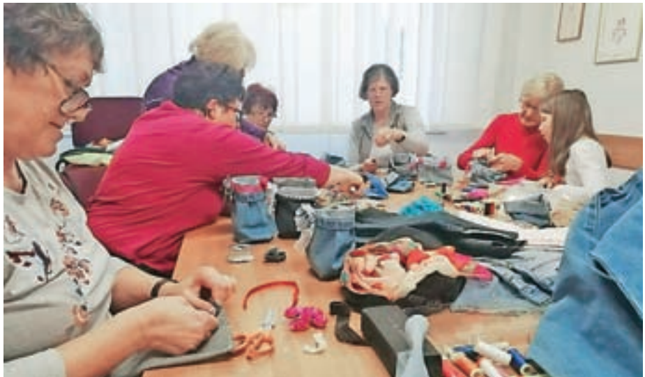
Ustvarjalna šiviljska delavnica

Udeleženci, ki so že sodelovali pri aktivnostih, so zelo navdušeni. Poleg novih