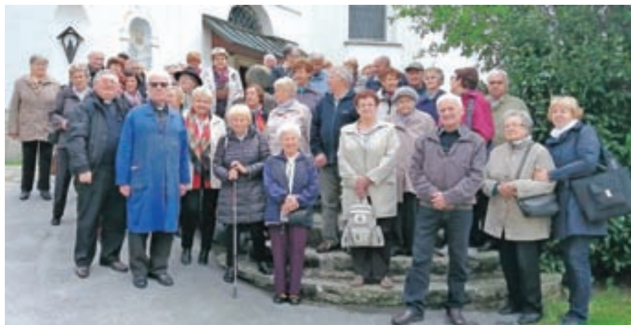
Z najstarejšimi na izletu