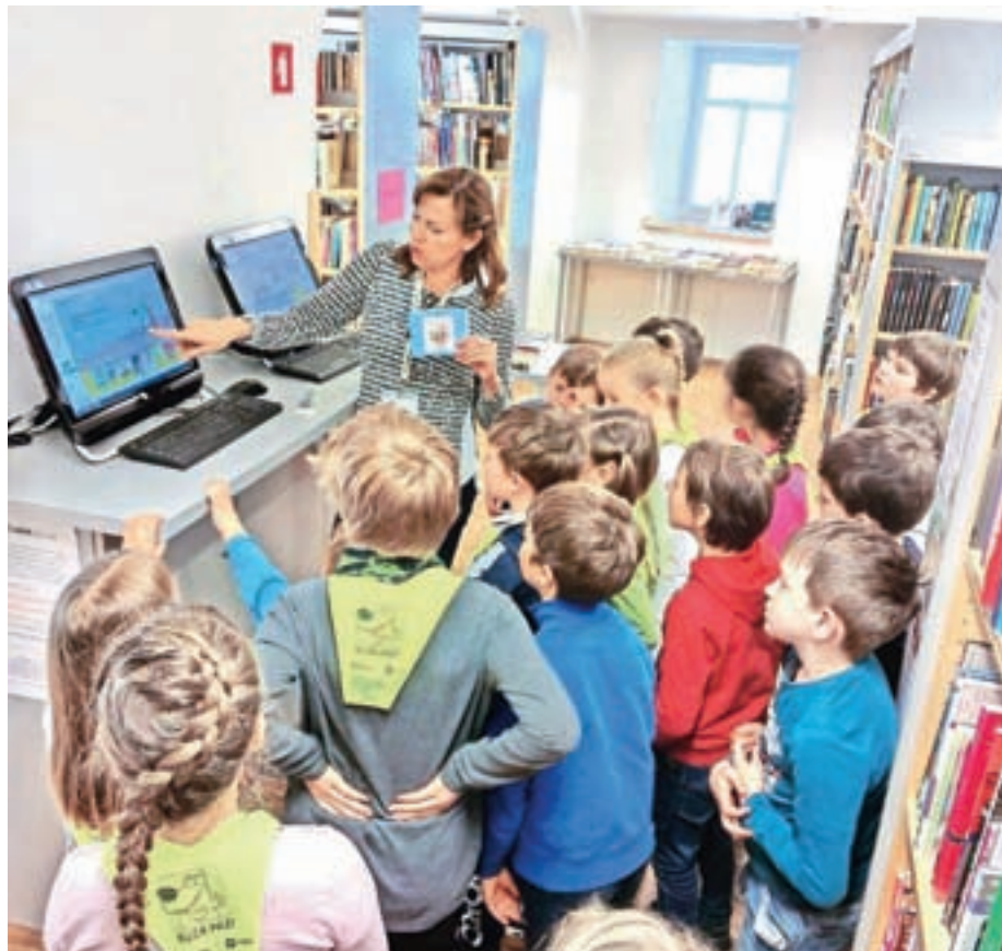
V preddvorski knjižnici