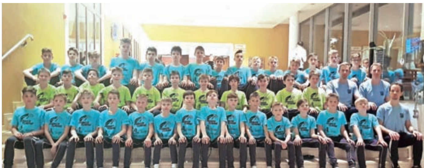
Mladi nogometaši, pripravljeni na športne izzive

Takoj po koncu nogometnega dela sezone pa nas čakata še dve najbolj tradicionalni in največji prireditvi v organizaciji ŠD Preddvor. Najprej bo v soboto, 15. junija, Srečanje nogometnih generacij NK Preddvor, teden dni kasneje, v soboto, 22. junija, pa v okviru občinskih praznovanj še Prvenstvo občine Preddvor v malem nogometu. Prijave na ta domači prestižni turnir sprejemamo do vključno srede, 19. junija. Tako igralci kot tudi vsi zvesti navijači ter ostali ljubitelji športa vabljeni, da se v čim večjem številu udeležite naših dogodkov.