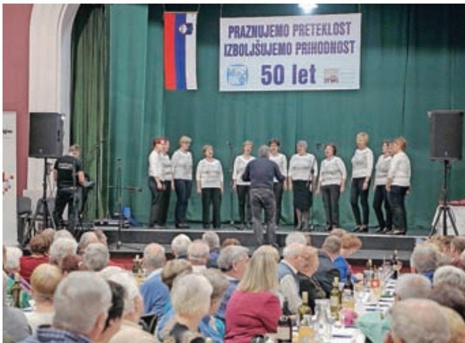
Ob petdesetletnici Medobčinskega društva invalidov Kranj

Združuje delovne invalide po zakonu o pokojninskem in invalidskem zavarovanju. Združuje druge invalidne osebe, ki nimajo statusa delovnega invalida, so pa zaradi pridobljenih ali prirojenih okvar in oviranosti, ki jo pogojuje