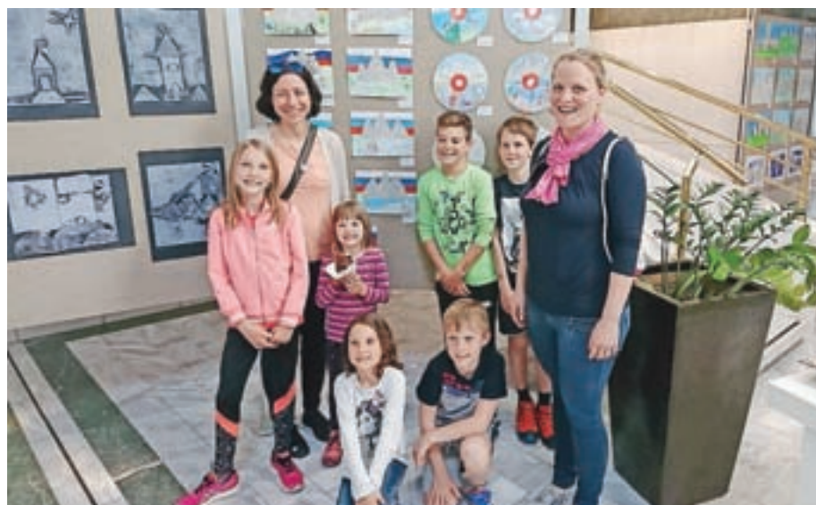
Kokrjani