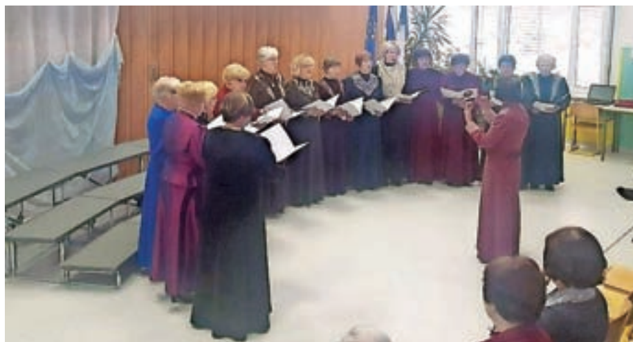
Preddvorske pevke na srečanju upokojenskih pevskih zborov Gorenjske