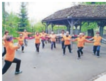
Jutranje razgibavanje članov Šole zdravja

Dan se članom Društva Šola zdravja začne v dobri družbi, živahno, veselo, nasmejana ... Vsako jutro (razen ob nedeljah in praznikih) se dobimo na dvorišču gostilne Majč, poklepetamo, se informiramo o prihajajočih dogodkih, razgibamo od glave do pete in polni sveže energije zakorakamo v nov dan. Verjetno je že kdo pomislil, le kdo razen upokojencev lahko hodi ob 7.30 na telovadbo. Jutranjih vadb se večinoma res udeležujemo upokojenci, nekateri pa pridejo pred službo ali ko imajo službo v popoldanski izmeni. Lahko se nam pridružite tudi samo ob sobotah in spoznali boste dokaj enostavne in zelo učinkovite vaje, ki jih boste