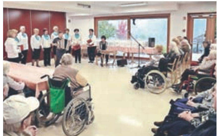
Prijetno druženje s stanovalci Doma starejših občanov Preddvor