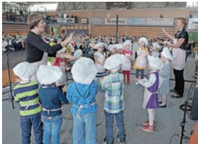
Na prireditvi so nastopili tudi otroci iz Vrtca Čriček z Zgornje Bele.