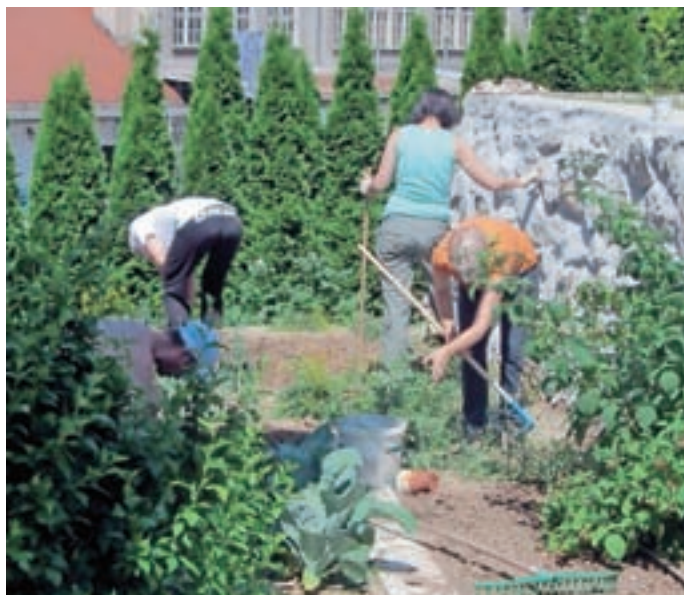
Delo na vrtu

Takšen način soočanja s stiskami ni več prisoten zgolj pri odraslih, vse pogosteje ga uporabljajo tudi mladostniki. Lažje je poseči po določeni substanci, kot se soočiti z neprijetnimi občutki, povezanimi s težavami v družini, šoli, z vrstniki. Lažje se je umakniti v svet računalnika ali telefona ter "odklopiti" svet, kjer se ne počutijo sprejeti, vredni, sposobni. Na začetku je takšna vedenja težko prepoznati kot škodljiva, čez čas pa svojci opazijo, da se posameznik popolnoma odmakne od svojih bližnjih, opušča stvari, ki jih je rad počel, ter se spremi-