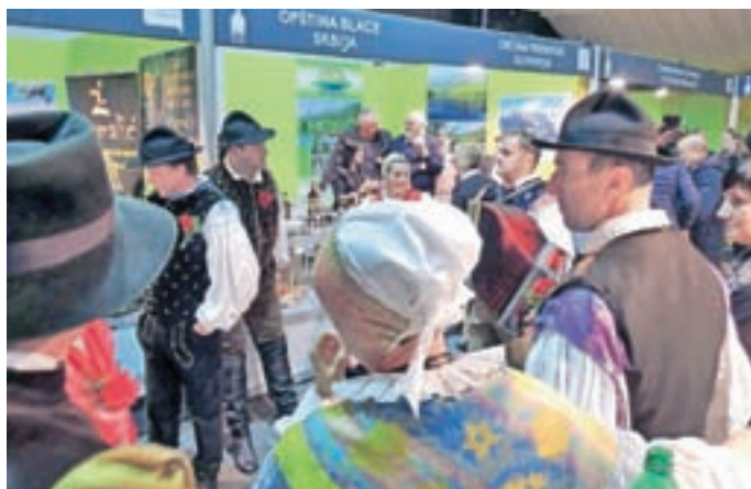
Lep obisk preddvorske stojnice na festivalu v Vodnjanu

Novembra so predstavniki Občine Preddvor sodelovali na festivalu Dnevi mladega olivnega olja v Vodnjanu. S to hrvaško občino Preddvor že nekaj let prijateljsko sodeluje. Na prireditvenem prostoru so se predstavili na svoji stojnici, ob odprtju in tudi pozneje pa so nastopili veterani Folklorne skupine OŠ Matije Valjavca Preddvor. Ob preddvorski stojnici se je ustavila tudi hrvaška predsednica Kolinda Grabar-Kitarović, obiskovalci pa so bili še posebej navdušeni nad kruhom z zasko.