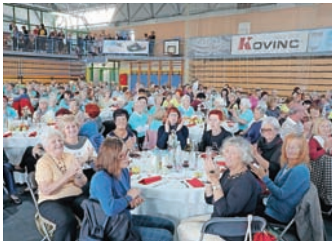
Vseslovenskega srečanja društev bolnikov z osteoporozo se je udeležilo več kot sedemsto članov.

Ob svetovnem dnevu osteoporoze, ki ga obeležujemo 20. oktobra, je v Cerkljah potekalo vseslovensko srečanje društev bolnikov z osteoporozo.