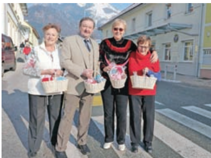
Gelike z županom in košaricami modrih in rožnatih copatk za preddvorske novorojenčke