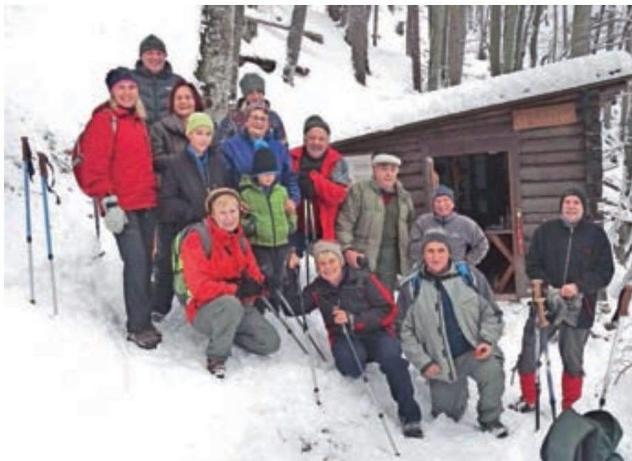
Pri bolnišnici Košuta