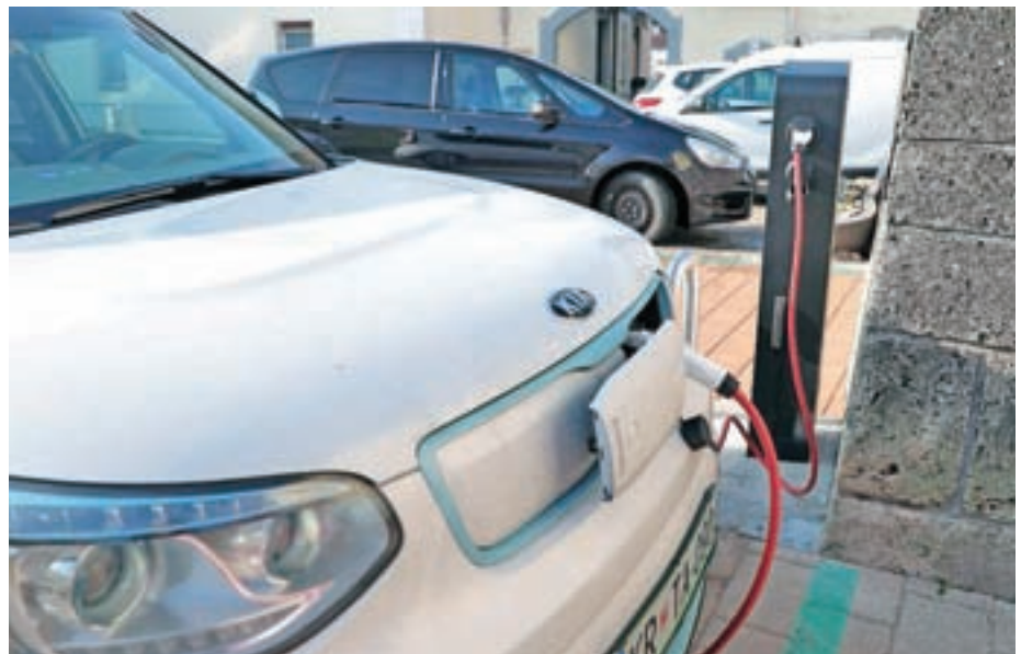
Nova električna polnilnica vozil v Preddvoru

Pri končni rabi energije v Sloveniji predstavlja delež prometa skoraj štirideset odstotkov celotne rabe. Večino te energije Slovenija uvozi, letni strošek posledično presega milijardo evrov. S postopno uvedbo e-mobilnosti, ki bi kot primarni energent izkoriščal lokalno proizvedeno električno energijo, bi ta denar lahko ostal v Sloveniji, hkrati pa bi pripomogli k učinkovitejši izrabi energije in tudi bistvenemu zmanjšanju izpustov CO 2 . Občina Preddvor spodbuja trajnostno mobilnost in optimizacijo motornega prometa, zato je uspešno kandidirala na javnem razpisu Eko sklada. S postavitvijo prve električne polnilnice je izpolnjen eden od številnih ukrepov trajnostne mobilnosti, zapisanih v celostni prometni strategiji. Denar za nakup in postavitev polnilne sofinancira tudi Eko sklad. S postavitvijo druge električne polnilnice (ena stoji že pri jezeru Črnava) in brezplačnim polnjenjem želijo potencialne uporabnike spodbuditi, da namenijo sredstva in prostor za polnjenje električnih vozil, ki bodo v kratkem številneje zaživela na slovenskih cestah.