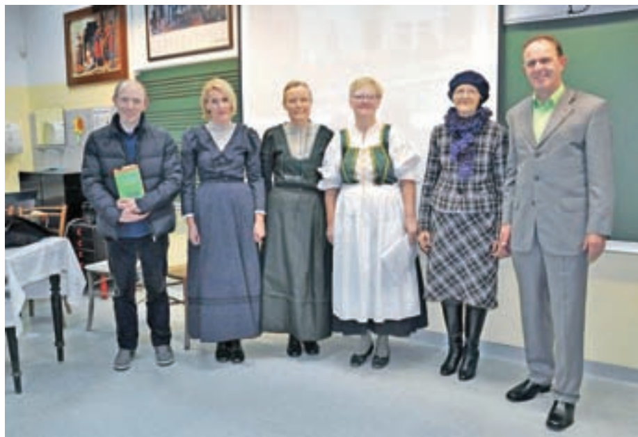
Ustvarjalci knjige Pod gorami