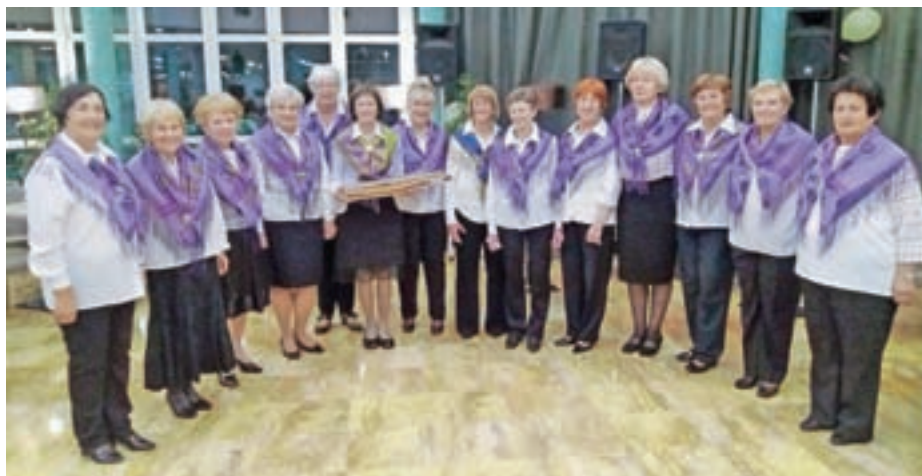
Nastop Pevskega zbora Josipine Turnograjske v hotelu Delfin