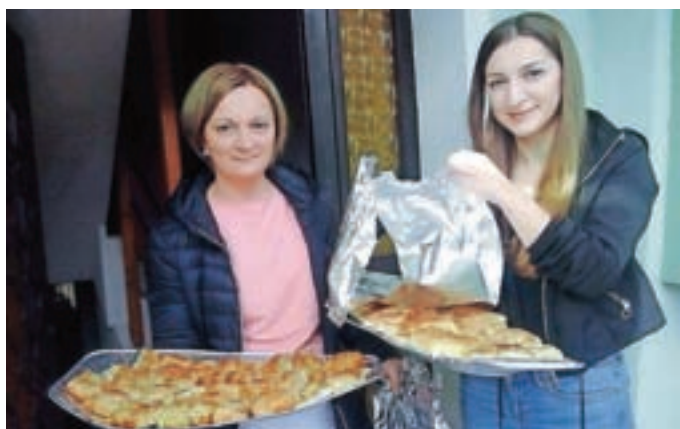
Zanimive jedi iz bašeljске mednarodne kuhinje