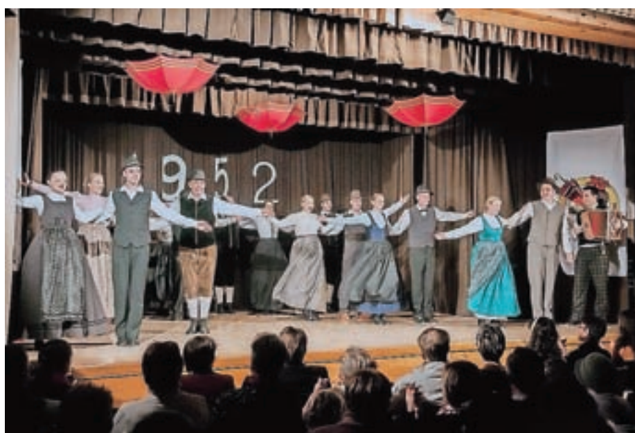
Z letošnjega folklornega koncerta