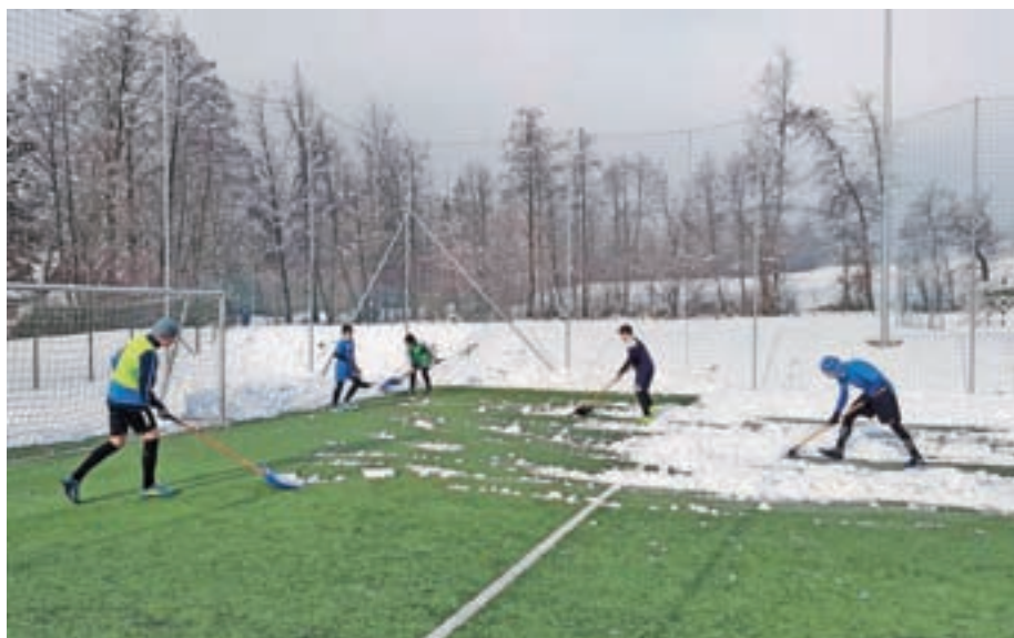
Sneg športnikov ni presenetil

V novo leto gremo spet polni delovnega optimizma in vsem skupaj želimo vesel božič ter srečno, zdravo ter športa polno novo leto 2018!