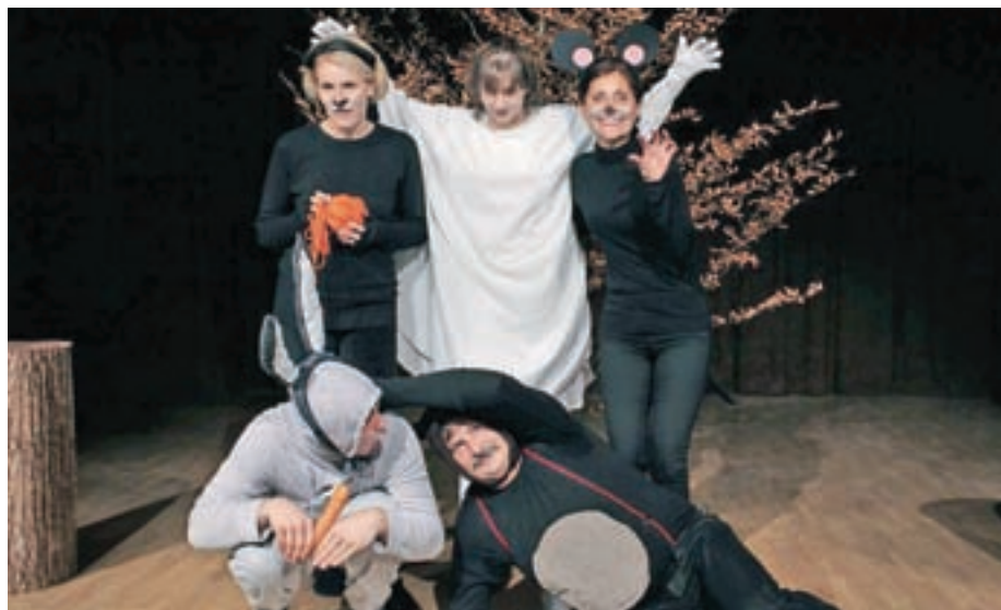
Iz otroške predstave Strah

KUD Preddvor je uspešno uprizorilo otroško igrico Strah. Nabito polna dvorana je 11. novembra uživala v otroški igrici. V dvorani je bilo poleg obilo otrok tudi veliko otrok po duši. Sedaj nastopajo še po vrtcih, ob koncu leta bodo predstave odigrali še v Preddvoru in na Beli, ko bodo Božičku pomagali premagati tremo ob obdarovanju otrok.