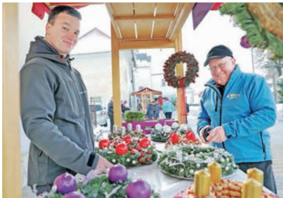
Dogajanje v okviru gRajskega Preddvora se je začelo z adventnim sejmom.

Velika pridobitev na področju turistične dejavnosti je tudi, da sta hotel in grad ob jezeru dobila nove najemnike. Spoznavno srečanje je bilo spodbudno, saj nameravajo oživiti dogajanje pri jezeru ter povrniti dober glas tako hotelu kot gradu Hrib, saj naj bi Preddvor znova postal ena izmed najbolj zelenih poročnih destinacij. Svoja vrata je odprla tudi dolgo zaprta Vila Bella, ki bo dodala še en biser k pestri kulinarčni ponudbi. Pomembna novost je tudi nova polnilnica za električna vozila, kar odraža zavedanje občine o pomenu ohranjanja okolja ter usmeritve k zelenemu, predvsem pa trajnostnemu razvoju turizma. Na Zavodu za turizem smo se že povezali z večino turističnih akterjev, s katerimi že snujemo nove dogodke ter utrjujemo sodelovanje, kar je odlična popotnica za prihajajoče novo leto. Vsem skupaj želimo prijazno novo leto, polno novih dogodkov za nove spomine.