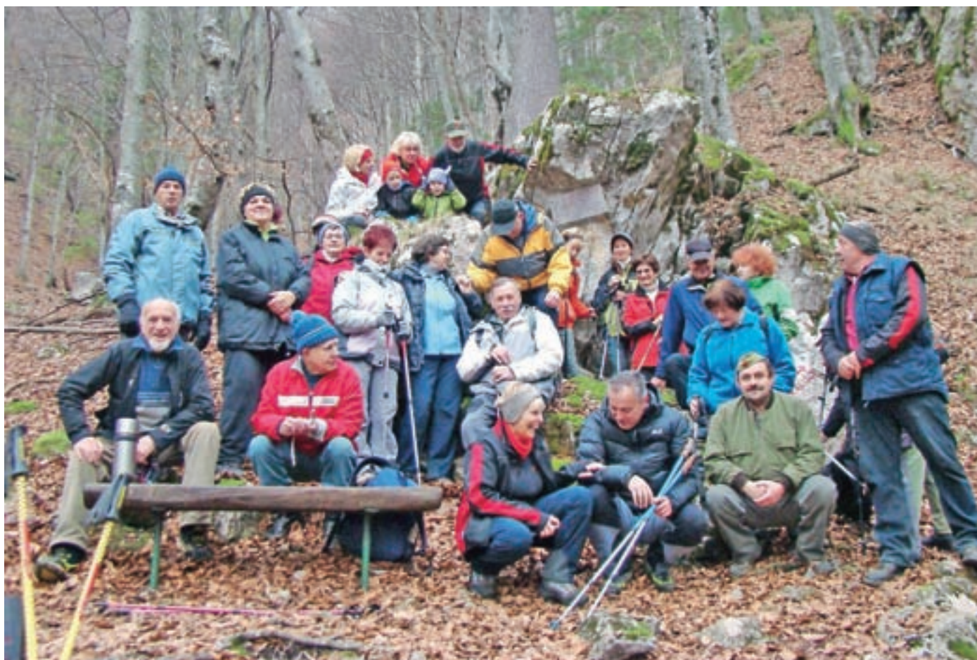
Pohodniki k partizanski bolnišnici Košuta

Pohod so sklenili v okrepevalnici Seljak v Preddvoru ob dobrotah domače gorenjske kuhinje.