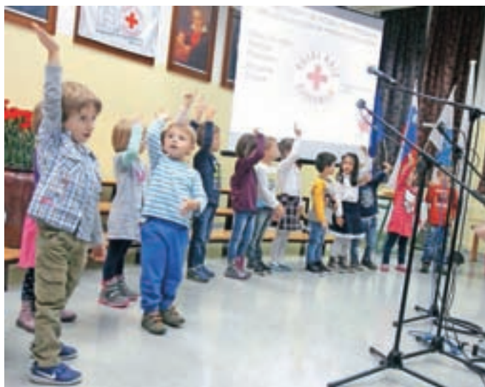
Prisrčen nastop otrok iz vrtca