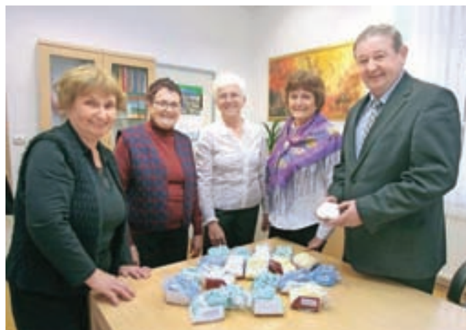
Gelike so spletele copatke za preddvorske novorojenčke.