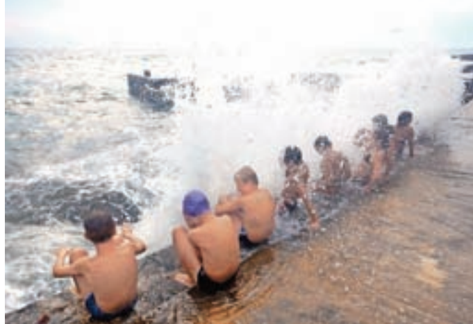
Šola v naravi

smo se igrali različne igre za razmišljanje in kako premagati strah pred nastopanjem.