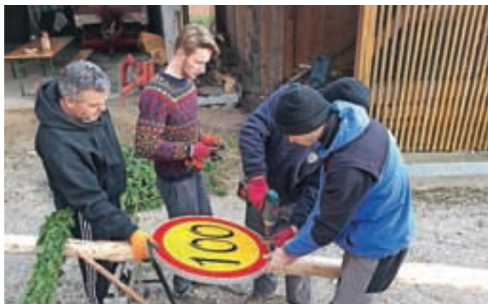
Dan pred rojstnim dnevom so Mancini možje z vasi postavili tudi mlaj.