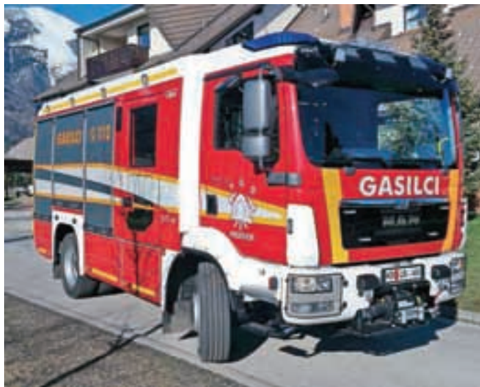
Nova pridobitev preddvorskih gasilcev

Preddvorski gasilci so končali najpomembnejši projekt zadnjega leta in pol.