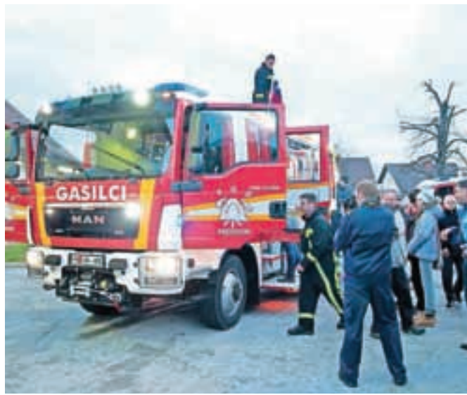
S slovesnosti ob sprejemu gasilskega vozila