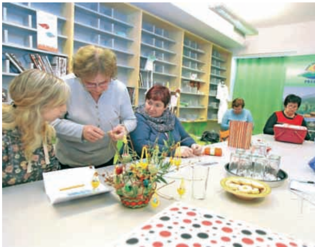
Z letošnjih velikonočnih delavnic