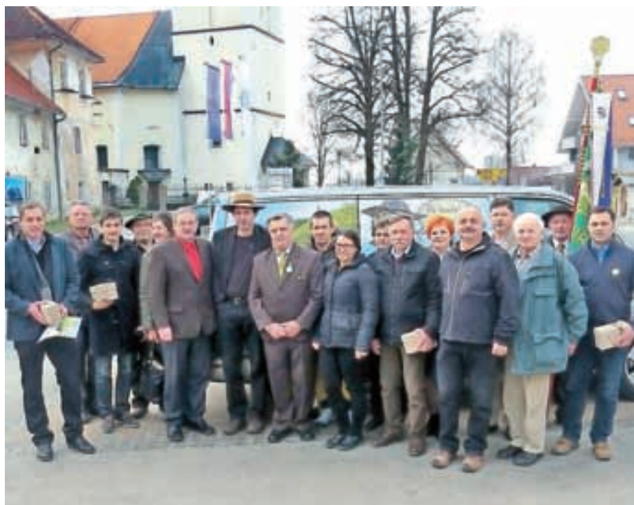
Srečanje s predstavniki čebelarstva v Preddvoru