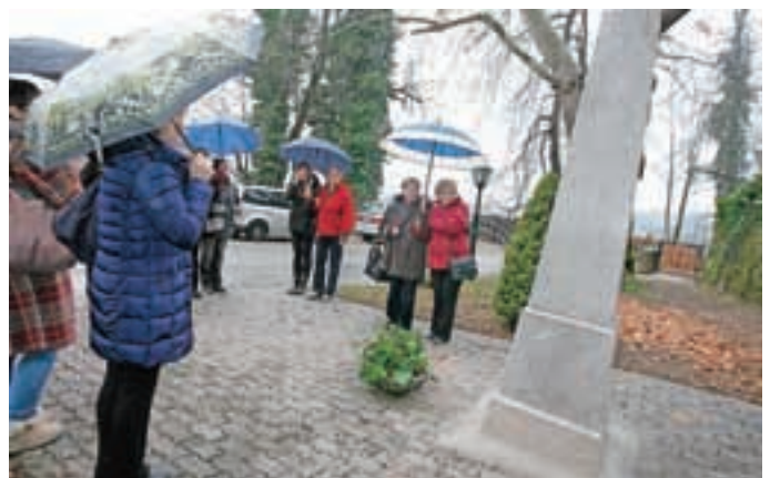
... in se ustavile pri posnetku nagrobnika.