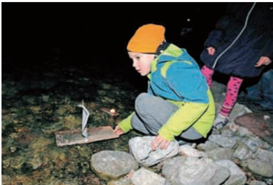
Ko prihaja pomlad ....: gregorjevo v dolini Kokre

Na predvečer gregorjevega so tudi v dolini reke Kokre s spuščanjem gregorčkov v reko praznovali prihod luči, pomladi, ljubezni ... »Sonce si je opomoglo, prvi cvetni popki so že veselo pokukali na plano, ptički veselo žgolijo, dan se daljša. Včasih so čevlarji, kovači in drugi obrtniki na ta dan upihniloli oljenke, sveče, čevljarjske svetilke, laterne ... Namazali so kos lesa z gorečim, v smolo namočenim oblanjem, in ga simbolično vrgli v reko ali potok, ki je tekel mimo delavnice. Vzele so si dela prost dan in odšli na 'ptičjo svadbo'. Nekoč je ta dan bil zaznamovan kot prvi pomladni dan. Zato praznujmo skupaj večni iskalci Sonca, zaljubljeni, večni čistilci narave, tisti, ki nam v srčku in v očeh žari iskrica upanja za lep danes in še lepši jutri – za vse generacije,« je ob praznovanju gregorjevega na Eko-piknik prostoru na Stari žagi dejala