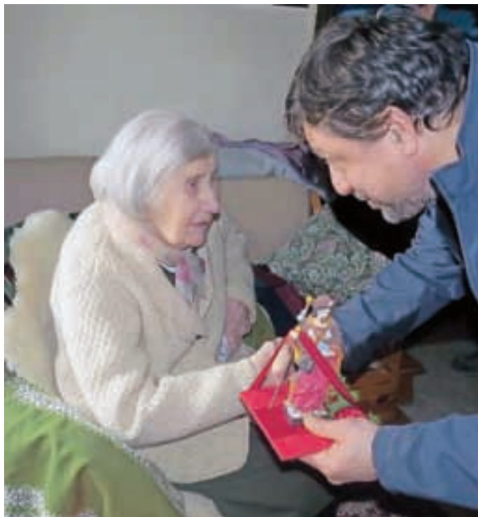
Vaščani so med drugim poklonili slavljenci kipec zavetnika vasi sv. Jakoba.