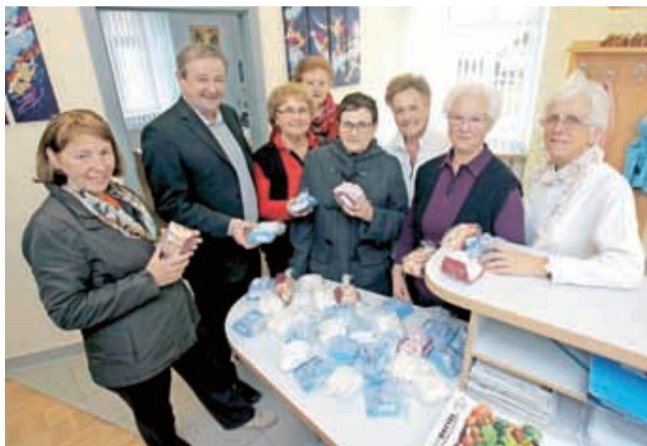
Gelike so prinesle copatke za preddvorske novorojenčke.