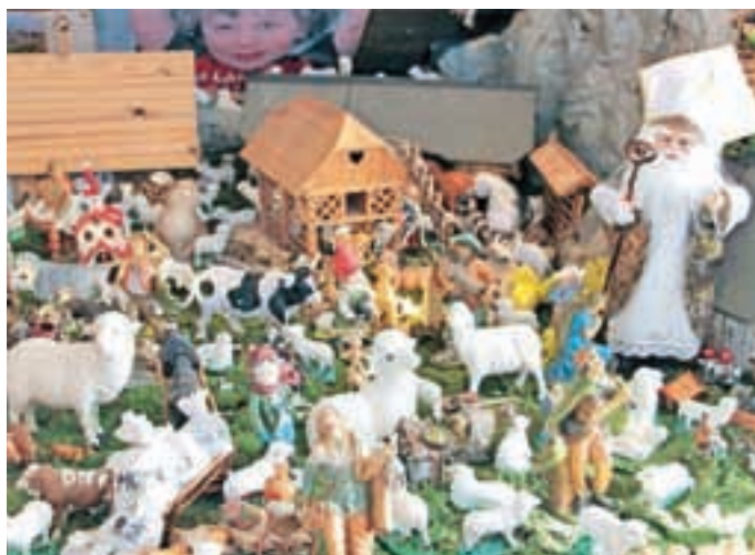
Del letošnjih Vinkovih jaslic

Čeprav je trinajst po ljudskem verovanju nesrečna številka, je za Vinka Pfajfarja, kot pravi, srečna. Srečna zato, ker je tudi letos, že trinajsto leto zapored, lahko na podstrehi hiše na Srednji Beli postavil jaslice, ki bodo na ogled do sredine februarja. Ko jih je postavil prvič, so obsegale manj kot en kvadratni meter velike in vsega petdeset figuric. Zdaj zasedajo že petinšestdeset kvadratnih metrov, števila figuric ne prešteva