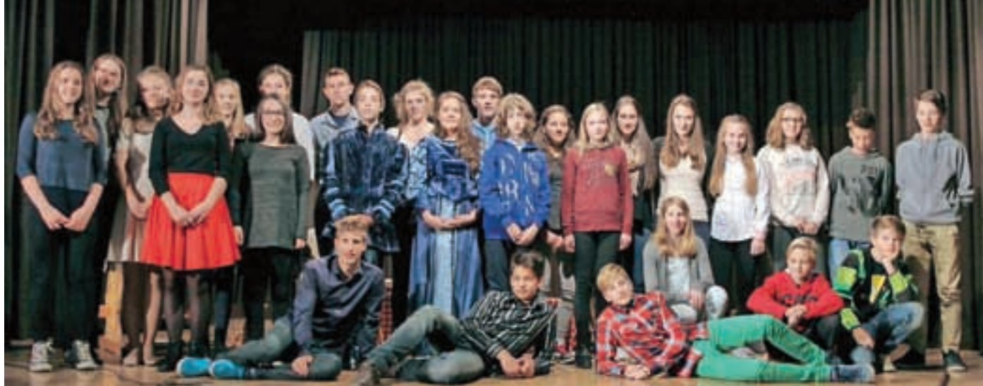
Avtorji najlepših ljubezenskih pisem v Sloveniji