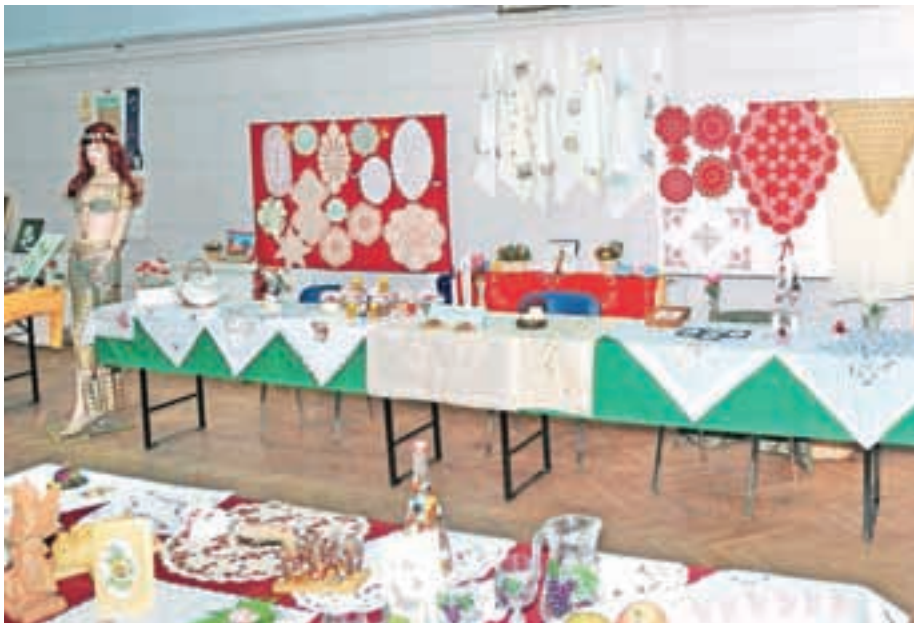
Izdelki pridnih rok

Da napolnimo avtobus, smo se dogovorili z DU Šenčur za skupno organizacijo. Še dve, tri leta nazaj je bilo za izlet toliko prijavnin, da sta odpeljala dva avtobusa, danes pa je kriza zdesetkala naše vrste, naši člani so se postarali, mladi upokojenci pa se žal ne vključujejo v naše društvo. Vsak drugi torek v mesecu organiziramo merjenje krvnega tlaka, sladkorja in holesterola v krvi, ki ga brezplačno meri višja medicinska sestra iz Doma