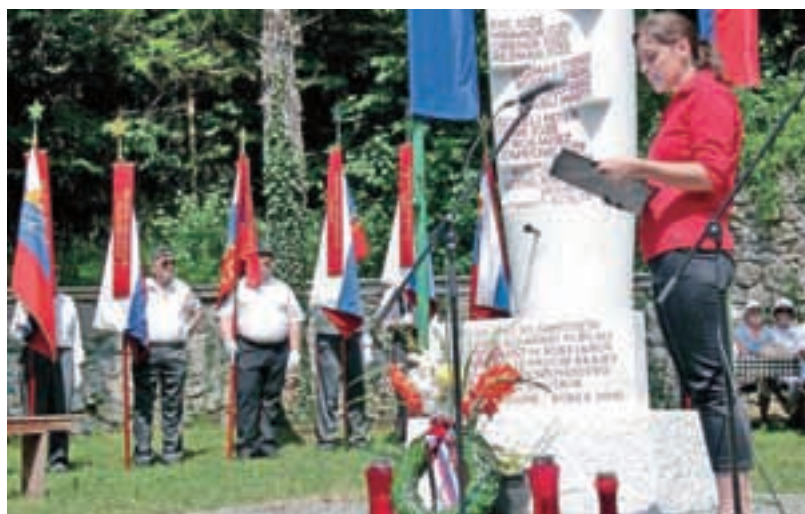
Z letošnje slovesnosti pri spomeniku v Kokri

Spomenik na Zgornji Beli je bil obnovljen leta 2008, obnova osrednjega spomenika v Kokri je potekala v letih 2012, 2013, 2014. Obnovili smo tudi spomenik oziroma okolico na pokopališču v Preddvoru, postavili novo ploščo Petru Šenku v Novi vasi. Obnova bolnice Košuta poteka že od leta 2010. Bolnico Košuta obiskujemo že od leta 2007, letos smo opravili že deveti pohod, v tem obdobju jo je obiskalo več kot 700 pohodnikov. V letu 2008 smo ustanovili pevski zbor Kokrški odred, ki danes šteje 14 članic in članov. Letos je zbor nastopil že na devetih prireditvah, zadnji nastop je bil 29. novembra v spominskem