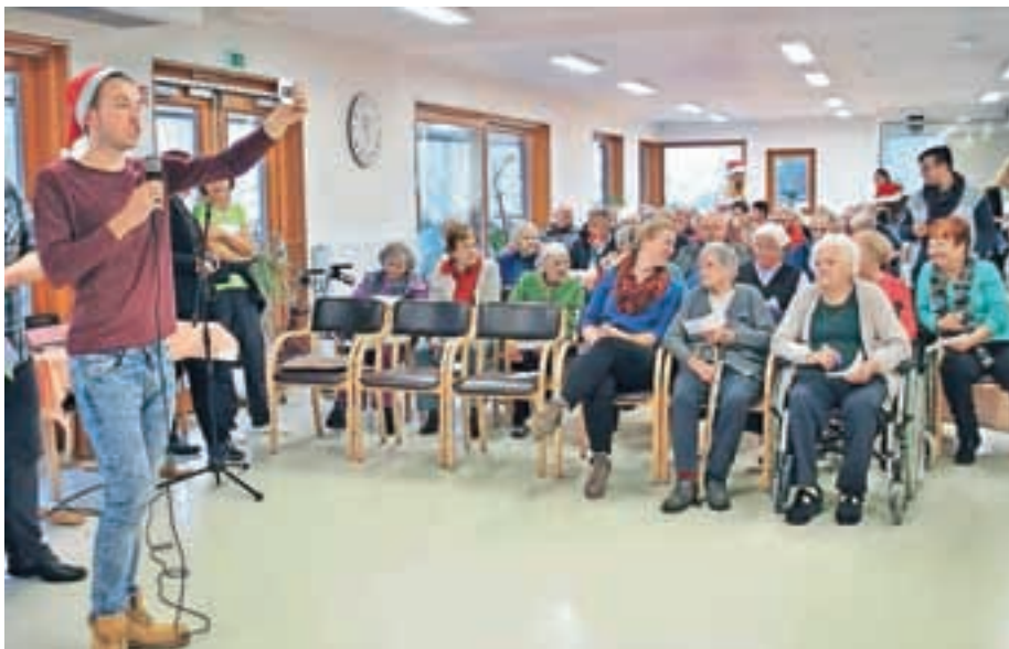
Mladi so se družili s starejšimi.