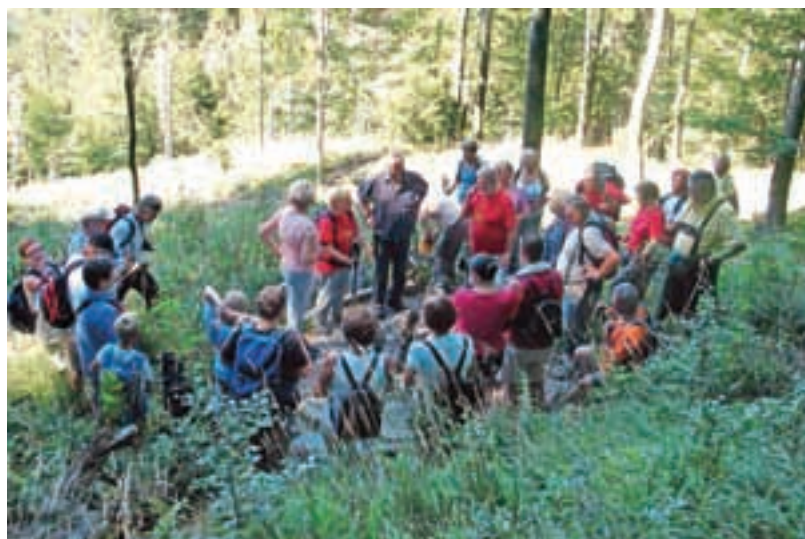
Pohodniki k partizanski bolnici Košuta