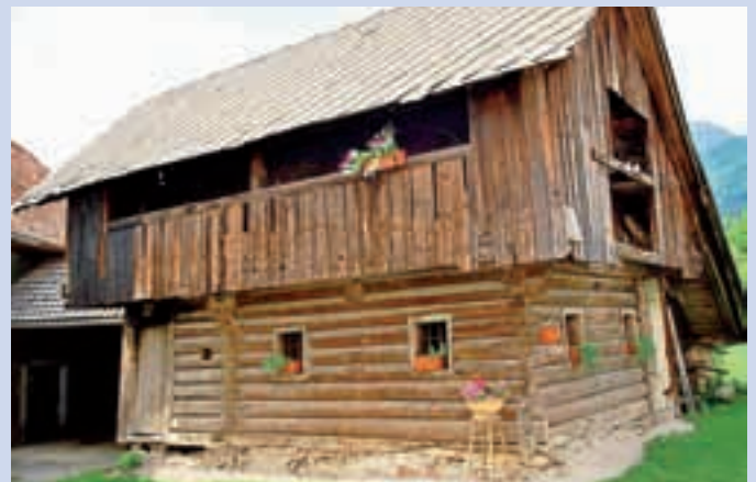
Ali poznate hišno ime te domačije iz leta 1742 v središču Preddvora?

nji in Spodnji Beli, v Hrašah ter v Preddvoru. Vse starejše domačije, katerih hišna imena so se ohranila z ustnim izročilom, bodo obiskali učenci oziroma mentorici. Zbiramo in zapisujemo zgodbe, ki pojasnjujejo hišna imena in zgodbe, ki so med ljudmi še žive, zadevajo pa predvsem življenje v vasi nekoč. Iščemo tudi stare fotografije (ki jih prekopiramo in vrnemo) ter fotografiramo še ohranjene ostanke nekdanjih časov. V zameno oziroma v zahvalo vam bodo na vašo željo organizatorji projekta na hišo pritrtili lično glineno tablico z napisom