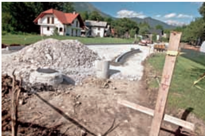
Na Srednji Beli naj bi dobili krožišče.

V vasi Možjanca je v naselje vikendov končno pritekla voda. Občina Preddvor je v letih 2011 in 2012 investirala več kot 100 tisoč evrov in na Možjanci v naselju vikendov zgradila kakih 500 metrov vodovoda z vodohranom. Tako je občina prevzela vaški vodovod ter ga dala Komunalni Kranj v upravljanje. Ubadamo se še z oporečnostjo vode in smo v novi vodohran vgradili