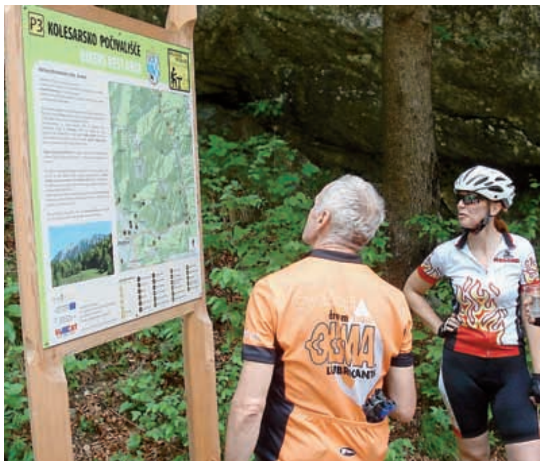
Kolesarji pred informacijsko tablo na novem kolesarskem počivališču