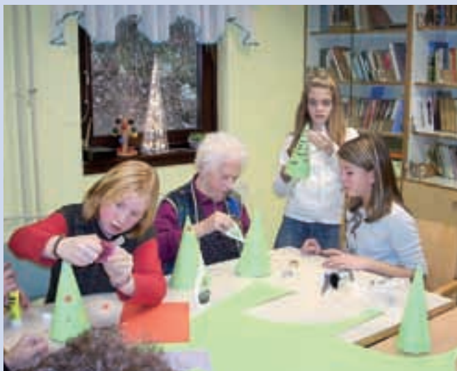
Mladi s starejšimi na delavnicah v domu starejših občanov