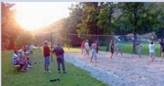
Potočani so odlični igralci odbojke.

Že četrtri smo se v soboto, 23. junija, zbrali na piknik prostoru za Kokro vaščani Potoč. Gonilna sila Boštjan Avsec je vesel, da se je Noč Potoč prijela med vaščani in da nekateri že težko čakajo, da pride dan, ko lahko v miru poklepatajo s svojimi sokrajanji, ki jih med letom ne vidvajo ali pa le redko. Tudi letos jih je bilo več kot šestdeset. Najmlajši so preizkusili temperaturo Kokre in se do poznega večera podili in igrali z žogo, srednja generacija je sodelovala v odbojgarskem turnirju, vaščani starejšega letnika pa so ob obloženih mizah klepetali in obujali spomine. D. Ž.