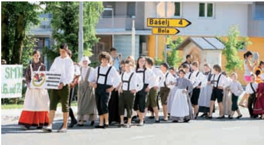
Otroška folklorna skupina Preddvor šteje že 32 plesalk in plesalcev.

Folklorni ples v Preddvoru živi že od leta 1952. Šestdesetletnico je Folklorno društvo Preddvor slavilo z mednarodnim srečanjem folklornih skupin.