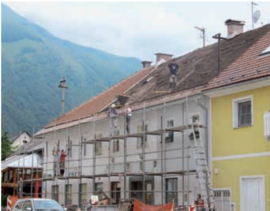
Gradnja večnamenskega informacijskega centra sredi Preddvorja