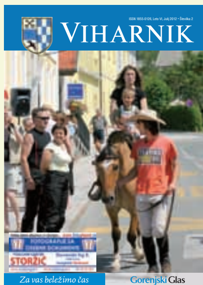
Na naslovnici: Prizor s Petrovga s'm'na

»Trenutno potekajo obrtniška dela, do konca septembra pa moramo državi izstaviti zadnjo situacijo, kar je pogoj, da še letos prejmemo dodeljena sredstva. Skupna vrednost projekta je 600 tisoč evrov, 420 tisoč pa nam je država odobrila nepovratnih sredstev.«