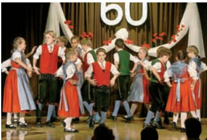
Mali celovski folkloristi na preddvorskem odru