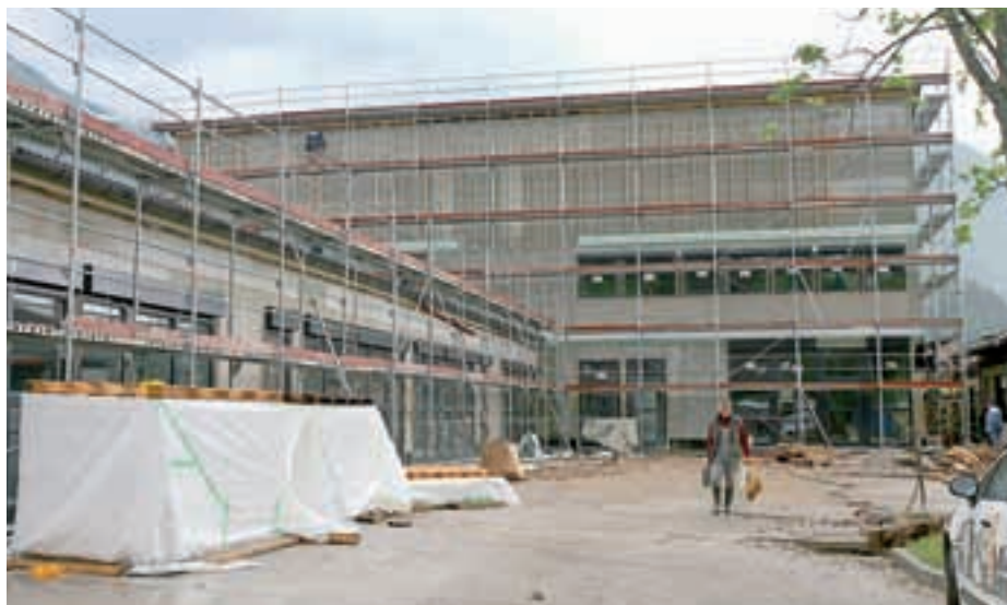
Gradnja vrtca v Preddvoru bo končana septembra.