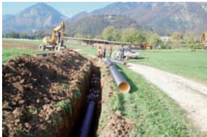
Gradbena dela v Bašlju.

ši ponudnik je bil Gorenjska gradbena družba iz Kranja. Samo obnova mostu bo stala dobrih 80 tisoč evrov. Rok za dokončanje z vsemi deli na Srednji Beli po pogodbi je 30. september, vendar bi radi, če nam bo le uspelo, končali do začetka septembra, ko Bele praznujejo sm'n.