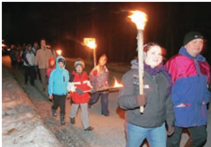
Na nočni pohod z baklami se je podalo okoli sto petdeset pohodnikov.

V Turističnem društvu Preddvor imajo za praznike vedno zanimive ideje. Že drugič zapored so priredili nočni pohod z baklami od jaslic do jaslic, pripravili so tudi tek Božičkov, že tradicionalen pa je njihov potop božičnega drevesa.