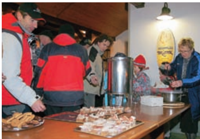
Na vsaki postaji nočnega pohoda so gostitelji pričakali pohodnike z okrepčilom.