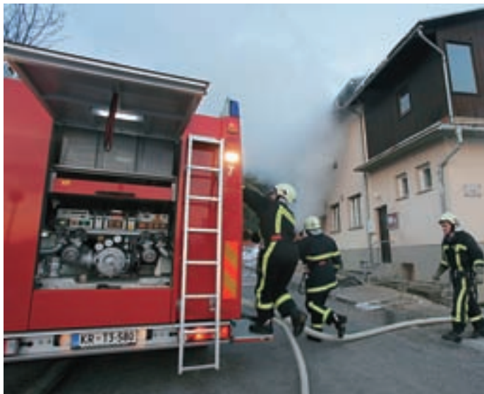
V nekdanjem zdravstvenem domu je zagorelo.