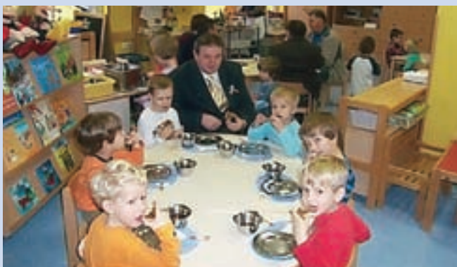
Otrokom je medeni zajtrk v županovi družbi zelo teknil.