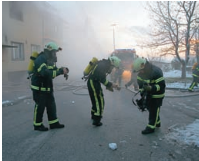
V bitki z ognjem in dimom

V stavbi je zagorelo, gost dim je preprečeval ljudem, da bi prišli iz goreče stavbe. Na pomoč so priskočili gasilci PGD Preddvor in v hitri akciji pomagali ujetim iz ognja. Na srečo je šlo samo za vajo, ki so jo pred nedavnim preddvorski prostovoljni gasilci izvedli v opuščeni stavbi zdravstvenega doma, ki je letos namenjen za rušenje. Predsednik Prostovoljnega ga-