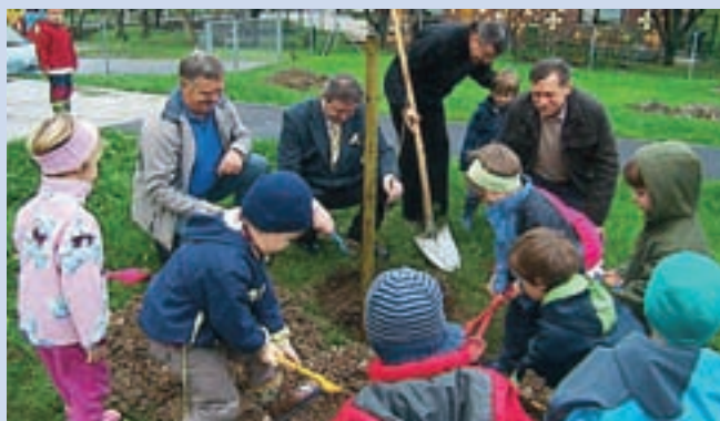
Čebelarji so posadili gorski javor.