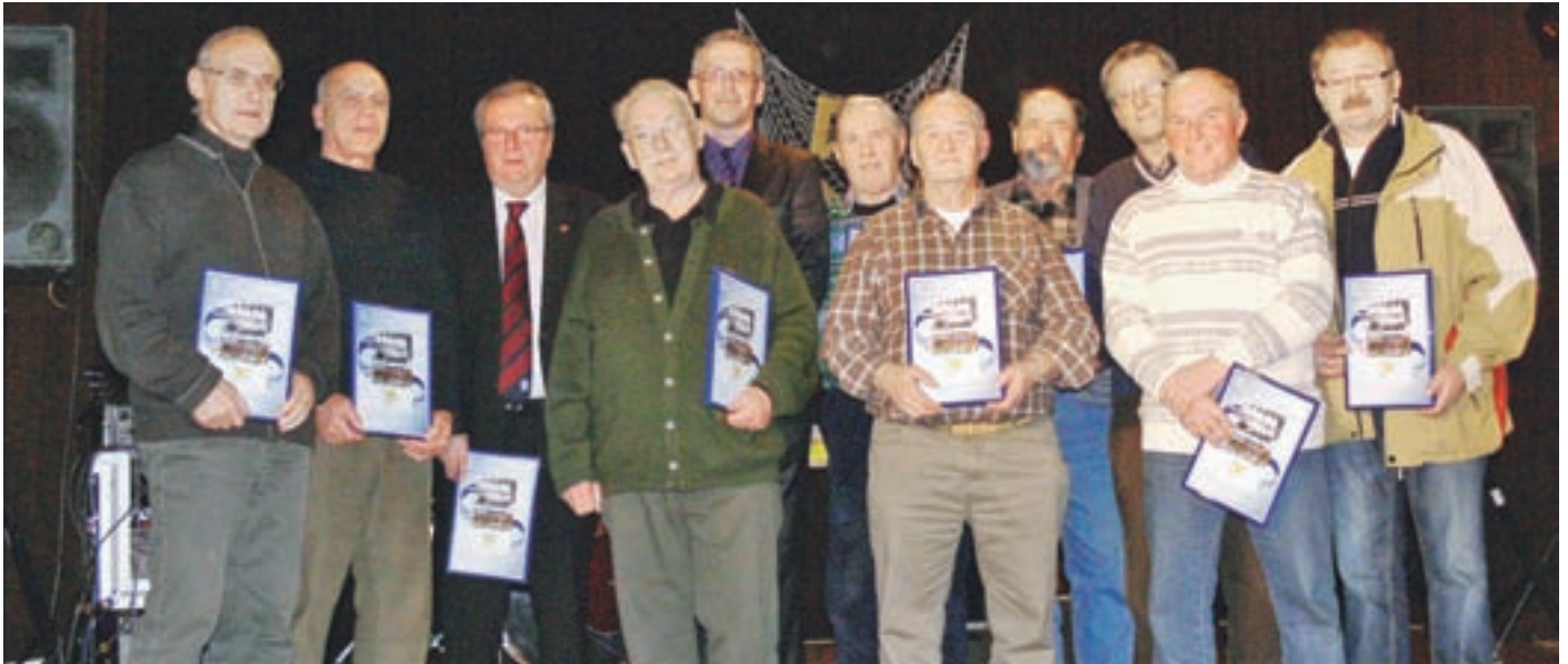
ŠD Storžič, prva enajsterica

Leta 1960 je v Preddvoru nastalo športno društvo. Obletnico so proslavili 10. decembra letos.