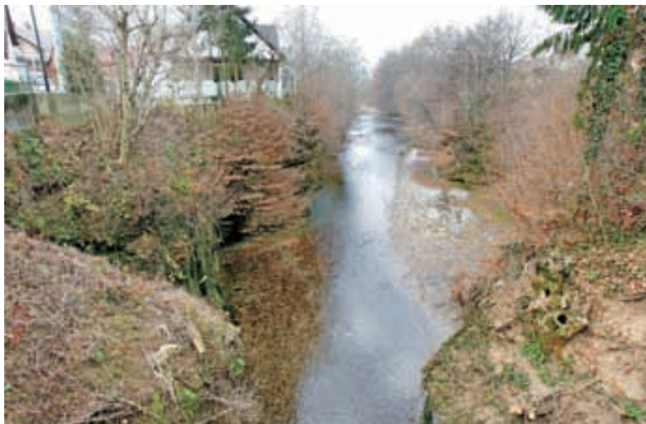
Očiščen kanjon Kokre pri Čira Čari

»V KS Britof-Orehovlje delujejo gasilsko društvo, nogometni klub, Rdeči križ, društvo upokoencev in klub prstometa, morda sem koga izpustil, zato že vnaprej opravičilo. Gasilsko in nogometno društvo sta najbolj popularni v naši KS. Gasilci delajo zelo dobro, prisotni so na vseh akcijah ob naravnih ujmah, požarih in drugih aktivnostih. Nogometni klub po mojih informacijah stoji zelo slabo, stvari bo zato treba postaviti na bolj zdrave temelje, za kar bo potrebno veliko truda. Klub za prstomet – tudi sam sem član – deluje dobro in se nagiba k izgradnji dodatnih petih igrišč ter spremljevalnega objekta za hrambo