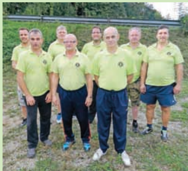
Prstometna ekipa Rokce drugo leto sodeluje v 2. gorenjski ligi.

»Prstomet je zanimiva igra, med katero se tudi dobro razmigaš,« je še pojasnil Borovnica in dodal, da lahko njihovo igrišče za prstomet v dogovoru z društvom brezplačno uporabljajo tudi krajani. Simon Šubic