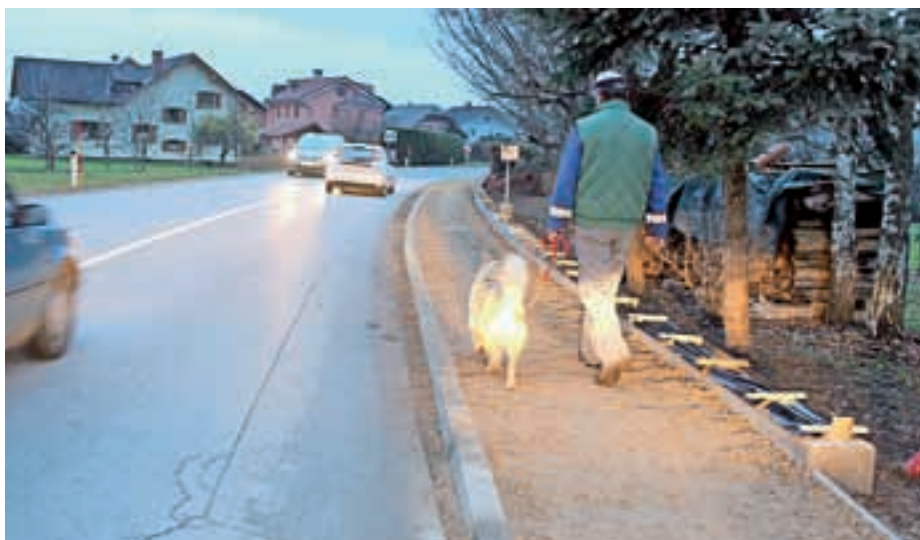
Pločnik proti Vogam zagotavlja večjo varnost udeležencev v cestnem prometu.