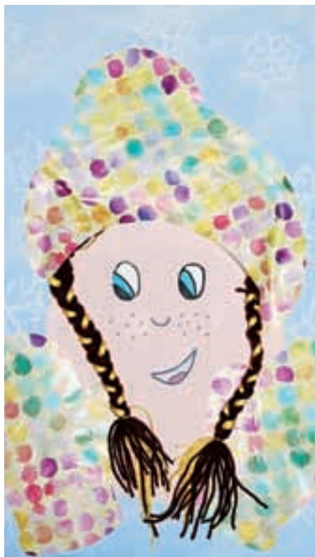
Ksenija Korošec, 4. b,

Naš papagaj je hišni ljubljenček. Na telesu ima perje zelene barve proti koncu repa pa ima tudi malo črnega perja. Ima zakrivljen kljun in krem-