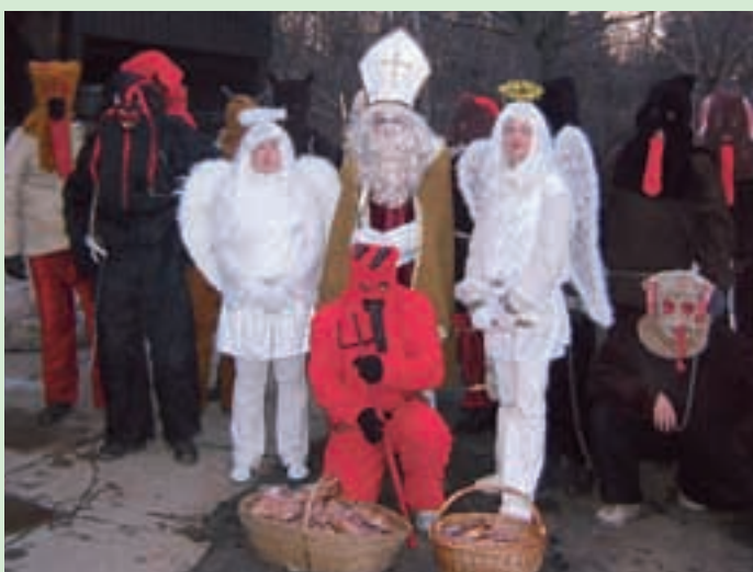
Miklavž s spremstvom in tudi parkeljni