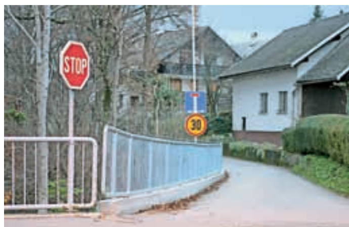
Nova zaščitna ograja

AMH AVTO MOTO HIŠA VOMBERGER Britof 180, KRANJ prodaja: 04/2342 600, servis: 04/2342 601