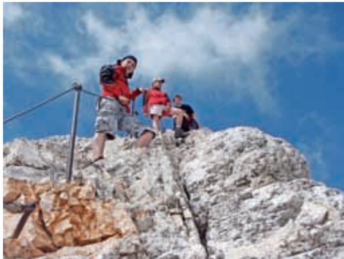
Operativni gasilci na Triglavu