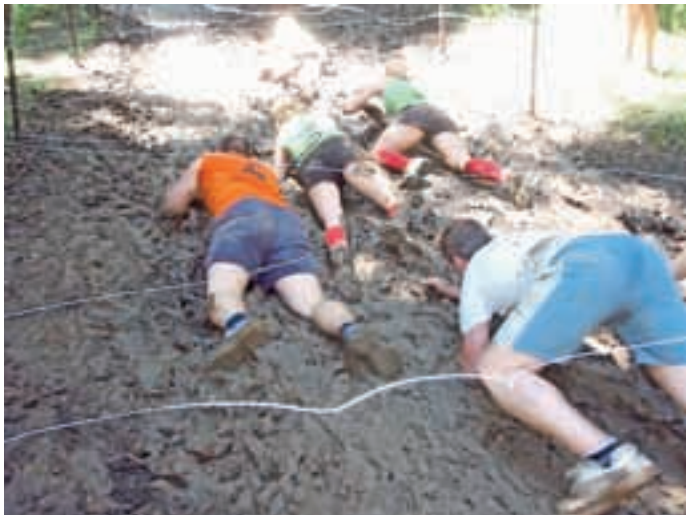
Vzdržljivostna preizkušnja Oviratlon na Pokljuki / Foto: arhiv PGD Britof

Glavna skrb Prostovoljnega gasilskega društva Britof je izobraževanje, letos pa so imeli tudi več intervencij v primerjavi s preteklimi leti.