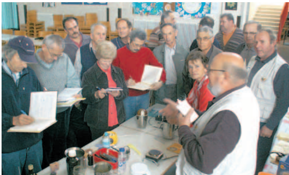
Delavnica izdelave krem in mila z dodatkom propolisa / Fotografija: Janez Markič

Predavatelj sta v zanimivem predavanju in z nekaj praktičnimi prikazi uporabe propolisa čebelarje seznanila z novimi znanji iz lastnih izkušenj in z rezultati različnih raziskav, ki potekajo po svetu. Jakob Šink