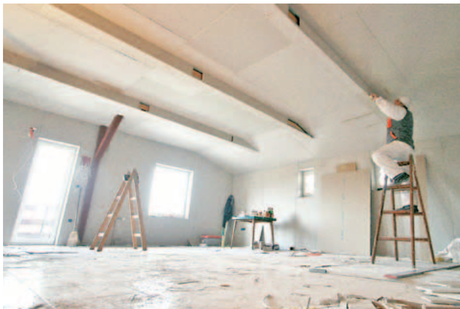
Gasilski dom v Britofu temeljito prenavljajo.

”V krajevni skupnosti se ne strinjamo z gradnjo, kot je bila predlagana, saj urbanistično ne sodi v kontekst vasi. Še preden bi sploh začeli graditi, mora investitor poskrbeti za komunalno opremljenost (kanalizacija, elektrika, voda, ...), saj obstoječa komunalna infrastruktura ne bo prenesla dodatnih obremenitev z novogradnjami. Glede na to, da se KS Britof-