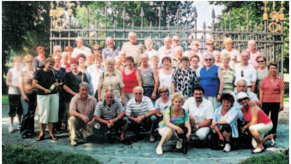
Izlet na Koroško, junij 2008