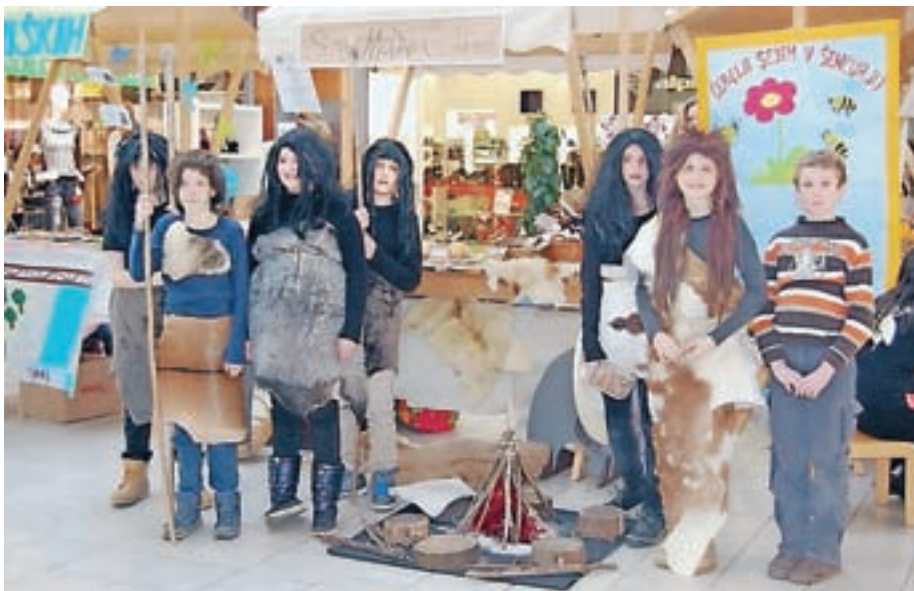
Mladi Kokričani so v opremi pračloveka poskušali navdušiti obiskovalce in prepričati zahtevno komisijo. Med šestnajstimi gorenjskimi šolami so si prislužili srebrno priznanje!

Zasnovane naloge so na verjetno najbolj mrzlo soboto v tej zimi preizkusili učenci matične in podružnične šole Franceta Prešerna. V mesecu marcu pa se je turistični podmladek predstavil na Turistični tržnici, ki je v okviru 30. festivala Turizmu pomaga lastna glava potekala v Mercator centru na Primskovem. Naši mladi Kokričani so v opremi pračloveka poskušali navdušiti obiskovalce in prepričati zahtevno komisijo. Kar dobro jim je šlo, saj so si med šestnajstimi gorenjskimi šolami prislužili srebrno priznanje. V veliko pomoč pri zasnovi in izvedbi projekta nam je bilo tudi Turistično društvo Kokrica, ki je dobrovoljno delilo svoje znanje in prosti čas, ter vodstvo šole.