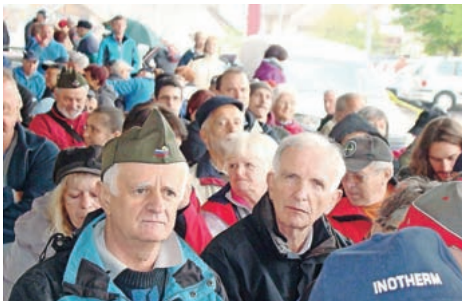
Tudi letos je bil pohod dobro obiskan.

V zaključni besedi se je povezovalka v imenu soorganizatorjev zahvalila vsem, ki so na kakršenkoli način pomagali pri organizaciji. Prisotne je povabila, da se v letu 2017 udeležijo 24. Pohoda spominov in tovarštva – Udin boršt 2017. Uradni del prireditve se je kljub dežju v nadaljevanju prevesil v praznično popoldne. Pohod je potekal v soorganizaciji ZB NOB Kranj, Krajevne organizacije borcev ZB NOB Kokrica, Krajevne organizacije borcev ZB NOB Duplje in ob pomoči Krajevne skupnosti Kokrica, Prostovoljnega gasilskega društva Kokrica, Turističnega društva Kokrica ter Društva upokojencev Kokrica. Že šesto leto zapored so se ga udeležili tudi članice in člani OZVVS Kranj in PVD Sever Gorenjska.