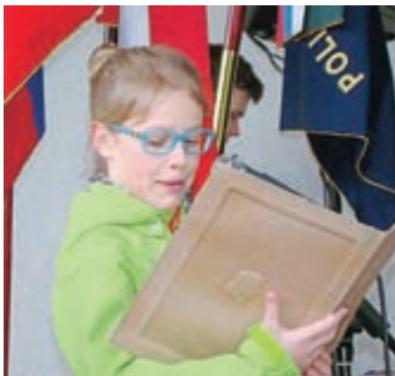
Nastopili so učenci PŠ Kokrica.

Pohodniki so se nato vrnili po gozdni trasi mimo naselja Cegelnica in Zelencev na izhodišče, kjer se je popoldne na javni površini pred trgovskim centrom Mercator na Kokrici odvil zaključni del prireditve. V družabno-kulturnem programu, ki ga je povezovala mag. Ana