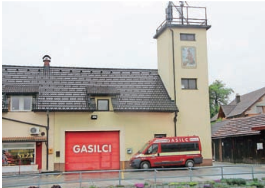
Po nekaj več kot 40 letih bomo spet prenovili notranjost gasilskega doma.

Logotip Turističnega društva Kokrica vsebuje lik mamuta, saj so leta 1953 pri izkopu gline v Krokodilnici (tako se imenuje eno od jezerc na Čukovi jami, kjer je imelo društvo svojo brunarico) našli njegovo okostje, ki je sedaj shranjeno v Prirodoslovnem muzeju v Ljubljani. Članice in člani Turističnega društva Kokrica skrbijo, da je tudi znamenito krožišče z mamutom vedno lepo urejeno.