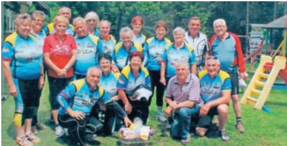
Srečanje kolesarjev Gorenjske v Komendi

Avgusta smo organizirali tradicionalni piknik, prišlo je zelo veliko članov društva. Imeli smo tudi srečanje starejših članov nad 80 let v brunarici Štern, srečanja se je udeležilo 78 članov. Udeležili smo se tudi Srečanja gorenjskih upokojencev v Bohinjski Bistrici, bilo nas je 76 članov. Letos bo Srečanje gorenjskih upokojencev 8. septembra, kraj pa še ni določen.