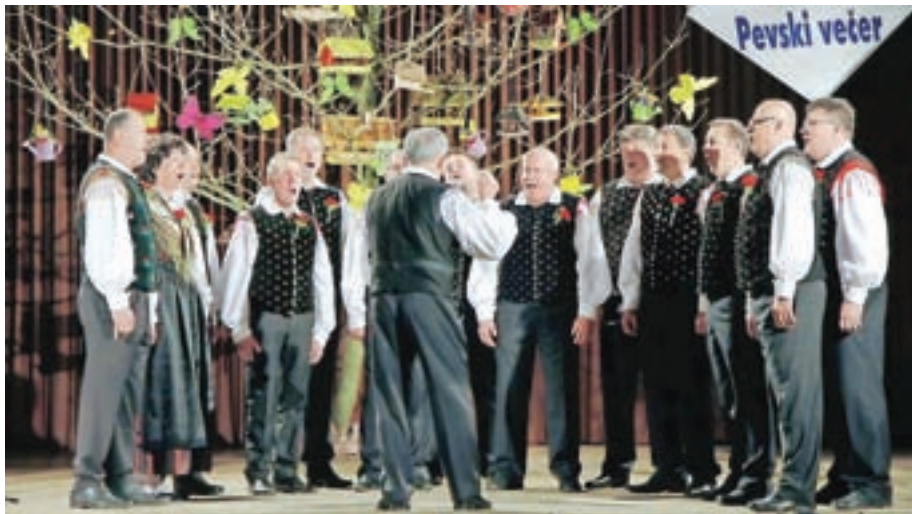
Vokalna skupina Kokrčan ustvarja in razveseljuje s pesmijo že več kot dvajset let.