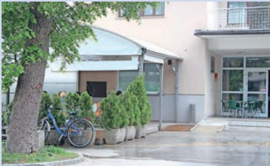
Oddajajo tudi gostinski vrt.

Javna dražba za najem poslovnega prostora bo v torek, 24. maja, ob 10. uri v sejni sobi številka 14 na sedežu Mestne občine Kranj na Slovenskem trgu 1 v Kranju. Najkasneje do petka, 20. maja, do 12. ure pa morajo pravne in fizične osebe na občinski Urad za splošne zadeve dostaviti zahtevane dokumente iz splošnih pogojev. Za pogoje najema in pravila javne dražbe in še več drugih informacij v zvezi s tem se kandidati lahko obrnete na Mestno občino Kranj na telefonski številki 04 2373 113 ali 051 603 297 ali na spletni strani www.kranj.si . S.K.