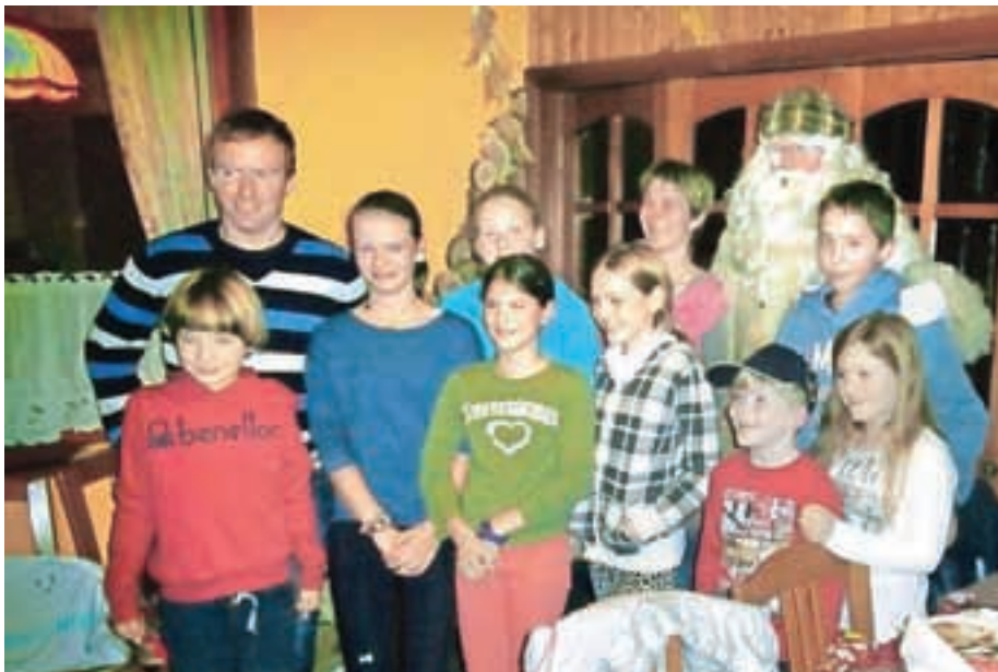
Prišel je dobi, stari Dedek Mraz.

V prvem decembrskem tednu je pretoplo vreme naredilo svoje. Kljub izjemnemu trudu vseh klubov in predvsem organizatorjev SP na Pokljuki je sneg namreč skopnel. To je prisililo organizatorja prve biatlonske tekme in tekme v teku na smučeh, ki naj bi bili prvi konec tedna v decembru, k odpovedi. V upanju na hladnejši december in vsaj nekaj pošiljk snega vsi tekmo-