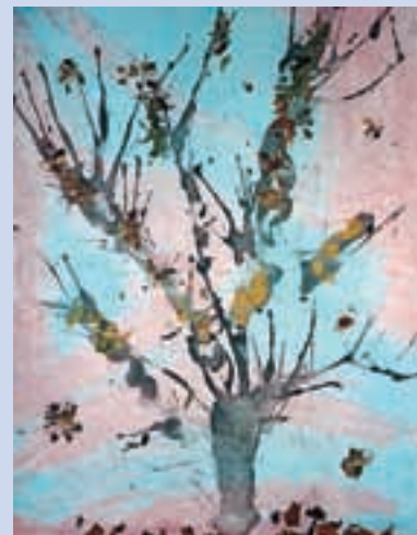
Alja, 1. c