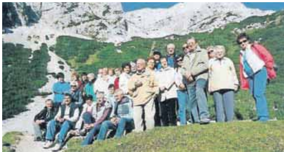
Pohod na Vršič