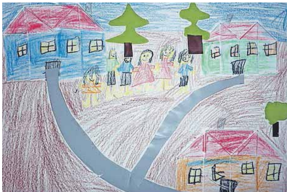
Blaž Gregorc, 1. č