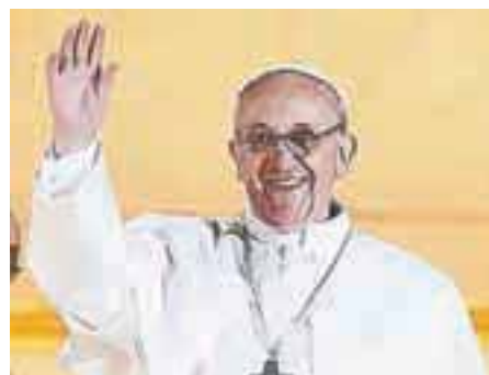
Novi papež Frančišek

Velikonočni čas nam vsak dan v bogoslužju božje besede zagotavlja, da se z Vstajim srečujemo v vsakdanjem življenju. V vsakem od