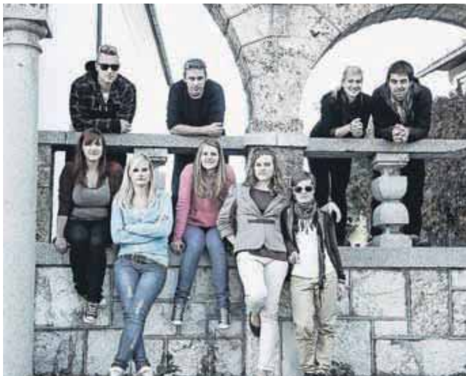
Skupinska slika GD Toj to!