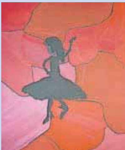
Julijana Isabel Seechase, 4. c

Katarina Zupančič in Tara Podjavoršek iz 5. č razreda