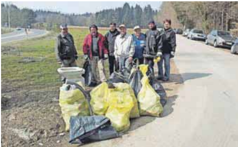
Letos je bilo smeti nekoliko manj, kar pomeni, da se krajanje počasi ozaveščajo, kako pomembno je zdravo in čisto okolje.

Skupaj z osnovno šolo se je zbralo okoli tristo udeležencev. Podeljene so jim bile rokavice in vrečke. Razdeljeni so bili na večje skupine. Prva skupina se je napotila proti Čukovi jami, druga skupina mimo gostilne Laknerja proti Udinborštu in rolkarski progi ter Mlaki, tretja v naselje Bobovek in proti protokolarnemu objektu Brdo, četrta v zaselke Srakovelj in Tatinca in peta mimo brunarice "Štern" proti