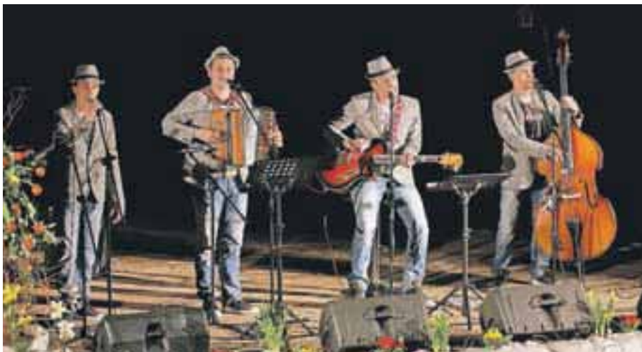
Na dobrodelnem koncertu je nastopil tudi Joc bend iz Poljanske doline.

Čeprav dvorana ni bila povsem polna, je bila Hozjanova z odzivom obiskovalcev in njihovo darežljivostjo zadovoljna: »Vsem, ki