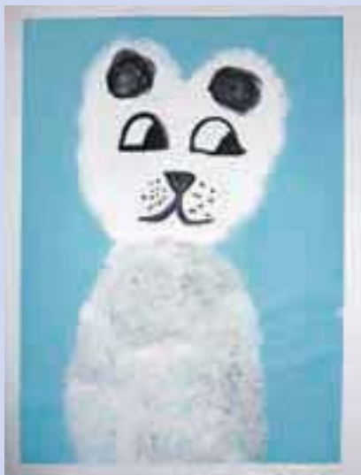
Lea Žmavc, 4. c