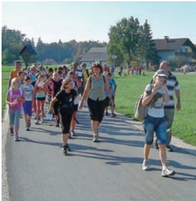
Četrty Pohod po mamutovi deželi

Bliža se konec leta, zato je čas, da predstavimo delo Turističnega društva Kokrica v tem polletju. V letu 2012 praznujemo 40-letnico delovanja društva.