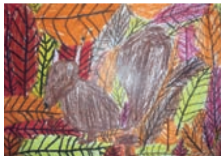
Tim Pogačnik, 3. c