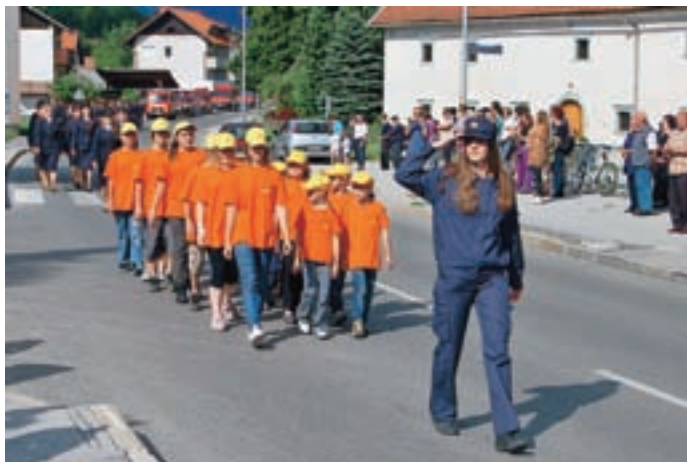
Parada in prevzem vozila