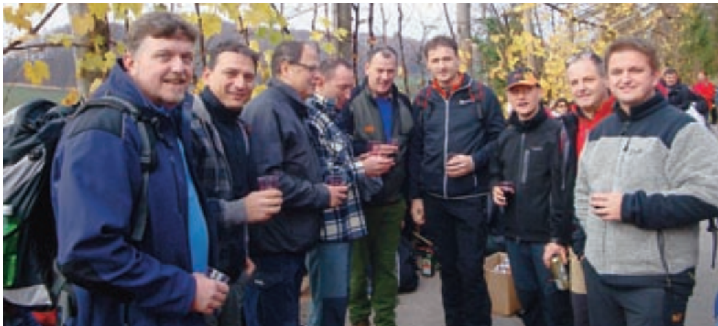
Kokrčani na zadnjem pohodu od Litije do Čateža

Naša osrednja prireditelja, za katero naš glas ponašamo med ljubitelje petja, pa je seveda naš Pevski večer. V osemnajstem letu delovanja smo ponosni, da je teh za nami že kar šestnajst in da vsako leto izbiramo skupine, ki želijo nastopiti v dvorani Kulturnega doma na Kokrici. Na tej prireditvi namreč v goste povabimo še pet pevskih skupin iz drugih slovenskih pokrajin in s ka-