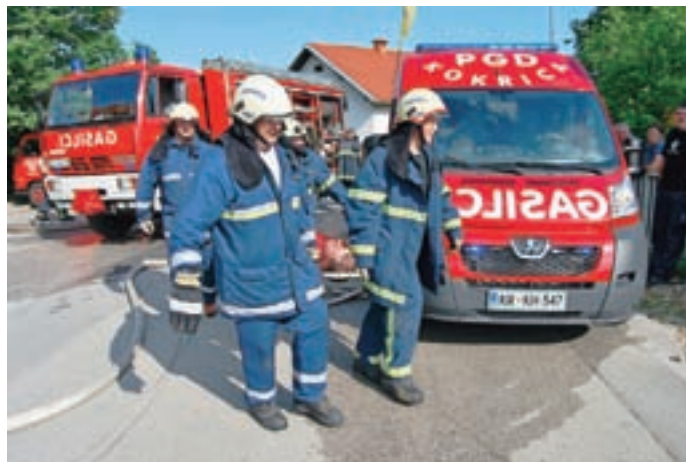
Vaja - prikaz reševanja