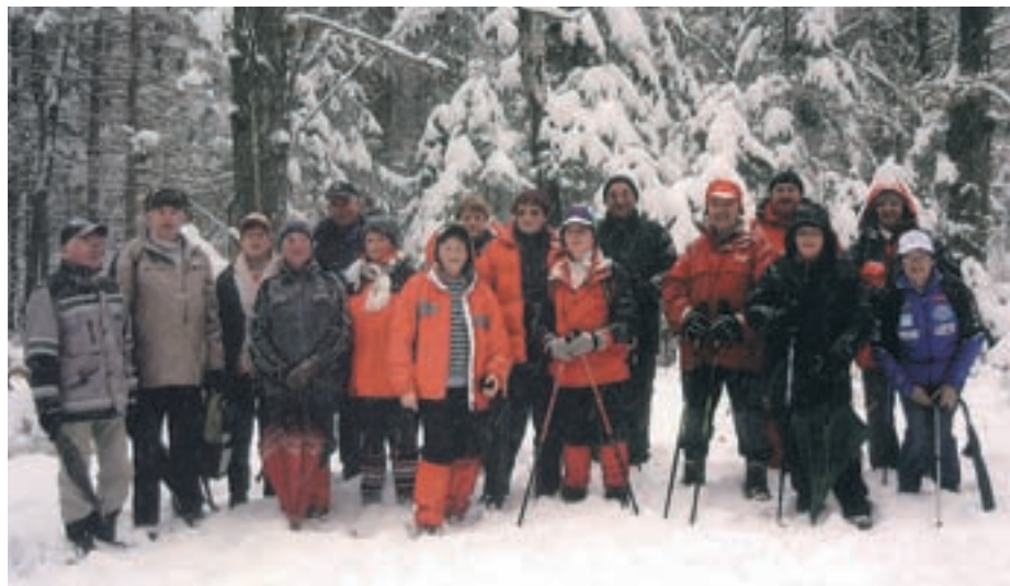
Pohod na Pangeršico (lovski dom)

Kakor vidite, je naše društvo zelo delavno. Priskrbljeno je za vsakogar nekaj. Če se udeležijo samo nekaterih aktivnosti, si že polno zase, kajti tudi doma nas čaka delo, saj varuje-