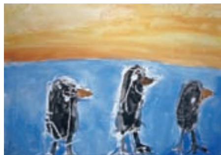
Lea Bodiroža, 1. c

Tara Podjavoršek: Jesenske počitnice sem preživela na Primorskem.