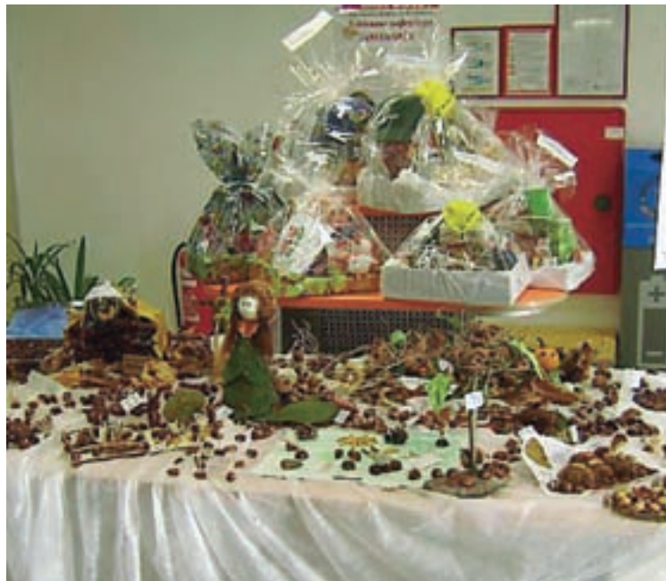
Izbor za naj kostanjček

V mesecu avgustu smo na nogometnem igrišču pripravili že tradicionalno prireditev Življenje v času mamuta in septembra 4. Pohod po mamutovi deželi. Z obiskom obeh smo zadovoljni in pričakujemo še večji obisk v prihodnjih letih. Ob koncu oktobra smo v sodelovanju z Mercatorjem pripravili izbor za naj kostanjček. Izdelke iz kostanjev zbira trgovina na Kokrici, ocenjujejo jih kupci in komisija. Mercator bogato nagradi najboljše iz obeh ocenjevanj. Ob prebiranju tega članka bo za nami tudi že 12. Večer ob krušni peči, v katerem prikazujemo kmečke običaje ob zimskih večerih. V letošnjem večeru so naš program obogatili gostje iz Gradeža pri Turjaku s svojimi deli in skupino Odmev.