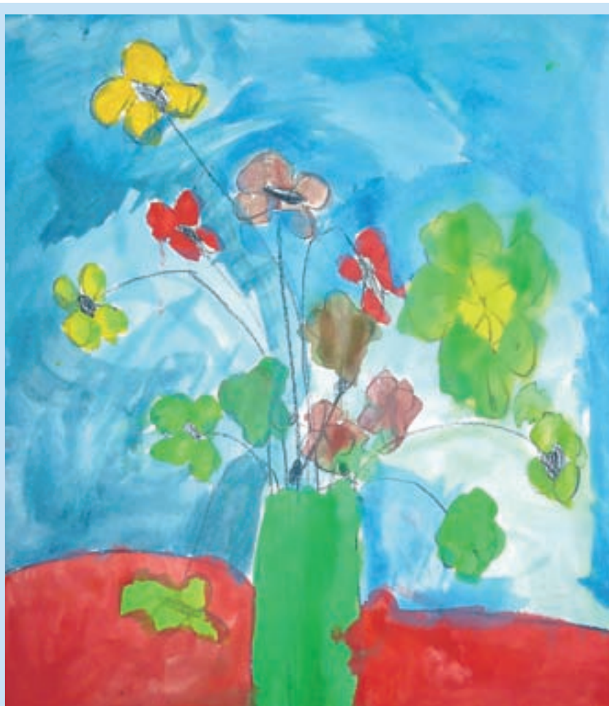
Eva Jeraca, 5 let, skupina Škratek