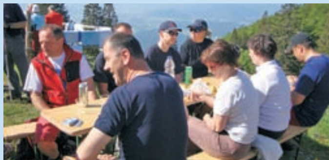
V okviru skupine deluje tudi planinska sekcija.