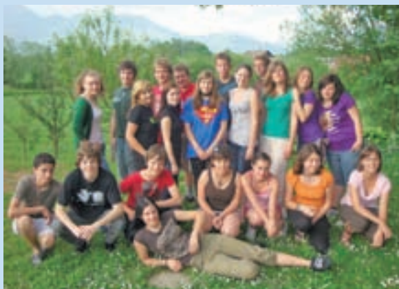
Animatorji Oratorij 2010