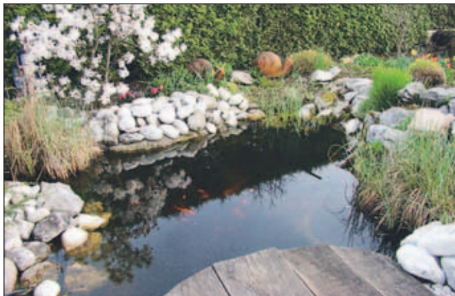
Konec aprila je ob vodnem motivu v središču pozornosti zvezdasta magnolija, prebuja pa se tudi živalski svet.

Naj zaključim zimsko sanjarjenje na realnih tleh. Če bomo veliko fizičnega dela opravili sami, postavitev vodnega motiva ne bo predstavljala večjega finančnega zaloga. Zato - čim prej od sanj k dejanjem!