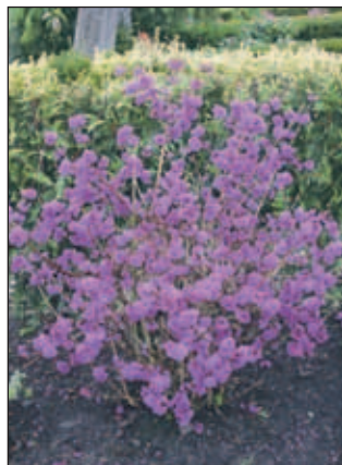
Vijoličasti plodovi kalikarpe

Iglavci in druge zimzeleno rastline so ena izmed možnosti. Nekateri predstavniki iglavcev so večini že znani, pogosto so na vrtovih zasajene srebrne smreke, ciprese ali različni bori, ki so čudoviti, ko jih pobeli sneg. Tudi strižene oblike iglavcev so pozimi v naših vrtovih zanimiv okras, lepo se obneseta tisa ( Taxus baccata ) in pritlikave sorte bora. Manj pogosti iglavci, ki si zaslužijo nekoliko več pozornosti v na-