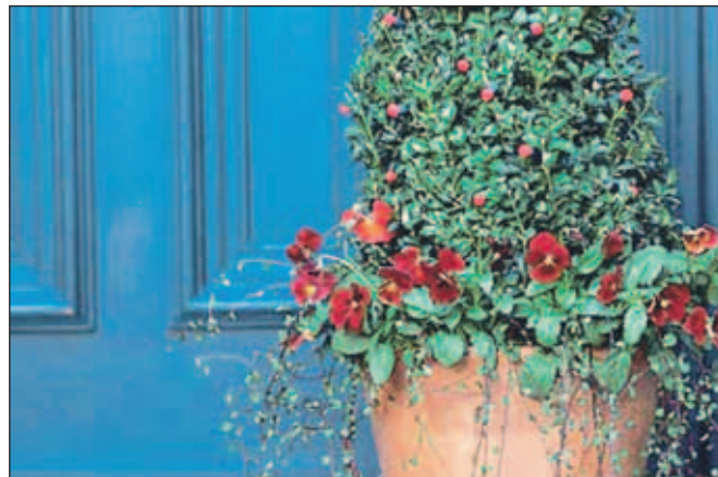
Zimski pozdrav pred vhodom

si ne moremo privoščiti tisti z majhnimi vrtovi, lahko pa zasadimo rdeči dren ( Cornus sanguinea ) ali izberemo med številnimi vrstami in sortami bambusa ter prav tako popestrimo zimsko belino z rdečimi, zelenimi in celo progastimi različicami. Advent in božič nam dovolita spet začutiti otroško pričakovanje, ko se veselimo barv in okrasimo naše do-