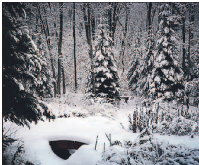
Prvi sneg na vrtovih

V zimskem vrtu so pogosto prezrte listopadne rastline, saj so odvrgele listje in že dolgo več ne cvetijo. Vendar pa so tudi nekatere listopadne grmovnice lepe celo leto. Na njih se bohotijo zanimivi plodovi, imajo izrazito razpokano ali obarvano lubje ali posebno obliko rasti. Izbira rastlin z jesenskimi plodovi, ki se ohranijo čez zimo, je izjemno pestra, tako da vsak vrt lahko obogatimo tudi s takimi, ki ga obarvajo v mrzlem letnem času. Šipek, ognjeni trn in trdoleško poznamo vsi, manj pogosto pa na vrtovih srečamo grmovnice s pisanimi plodovi, kot so kalikarpa ( Calliopsis bodinieri ), razni biseriniki ( Symphoricarpos sp.) in ameriška zimska jagodičnica. Občudovati lubje breze, platane in nekaterih javorjev