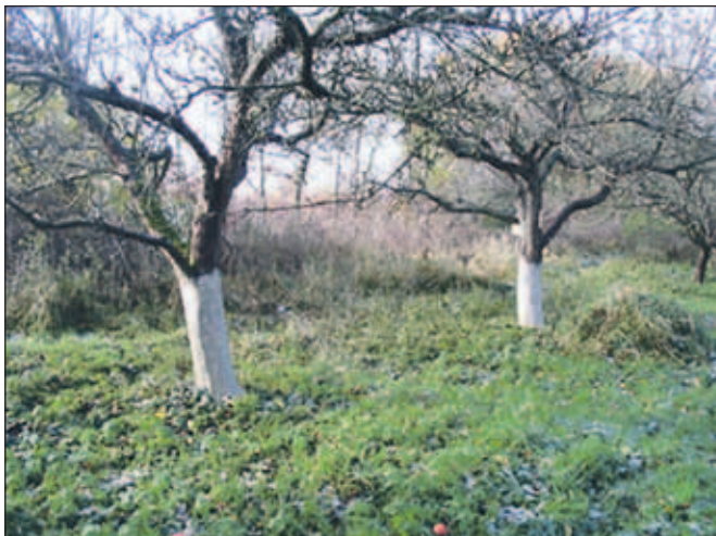
Zaščita z apnom