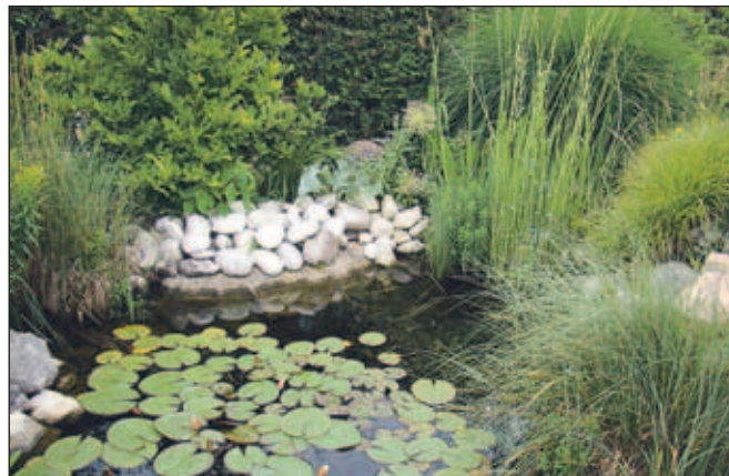
Julija je podoba ribnika spremenjena, saj večino vodne površine prekrivajo listi lokvanja. Na njih se v sončnih dneh grejejo zelene žabe.