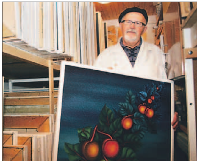
Tržiški umetnik je v štirih desetletjih ustvaril mnogo slik.