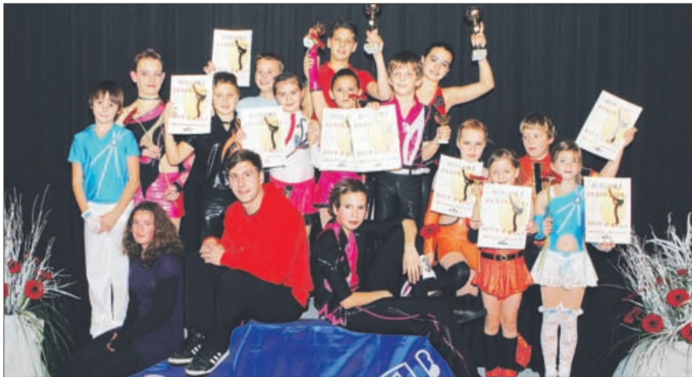
Uspešna ekipa tržiških tekmovalcev