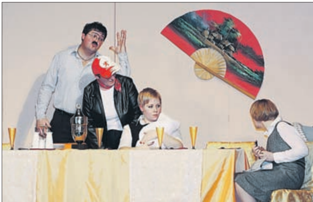
Odlomek iz predstave Mama je umrla dvakrat .

Kot predsednik lomskega KUD-a pa delujem že dvajset let. V času, ko sem nastopil do funkcijo, je kultura v Lomu cvetela, potem pa je prišlo do menjave generacij. Predvsem v dramski sekciji je prišlo do zatišja, zadnjih nekaj let pa je