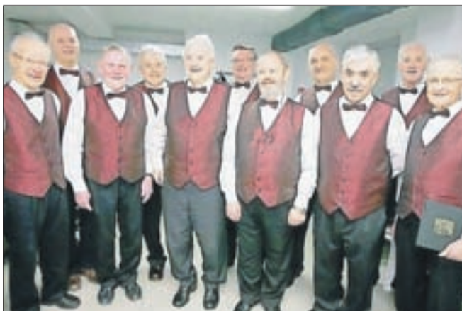
Moški pevski zbor Društva upokojencev Tržič praznuje 35-letnico.

namene uresničuje še danes, saj se udeležujejo raznih srečanj upokojenskih zborov tako doma kakor tudi zunaj občine. Vsako leto sodelujejo na Srečanju usnjarske in predelovalne industrije v Tržiču, dobre sosedske odnose vzdržujejo tudi s Koroško, kjer so na primer nastopili v Borovljah, pa tudi drugod. Vaje imajo enkrat tedensko, veseli pa so vsakega novega člana, ki želi sodelovati v zboru. Tudi v prihodnje želijo ohranjati visoko kulturno