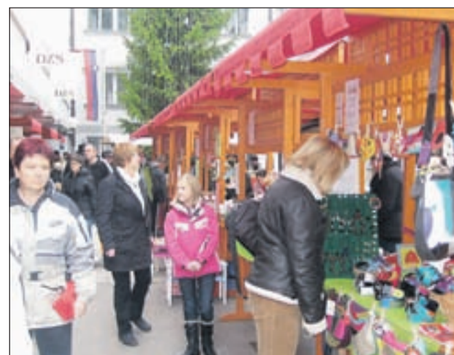
Lične pokrite lesene stojnice