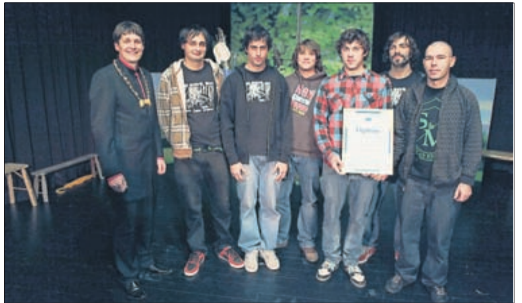
Ekipa Red Shovel team

ne odgovornosti zaposlenih Tržičanov, pa tudi konstruktivnega odnosa občinskih struktur zadovoljna z izbiro svojega stalnega bivališča.