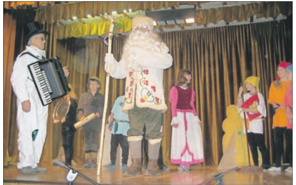
Dedka Mraza so se otroci zelo, zelo razveselili.