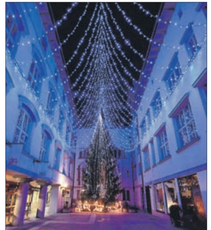
Mesto je že okrašeno, Atrij občine Tržič pa vabi na praznične dogodke.

ob 17. uri tekmovala v okraševanju jelk, dogodek bodo popestrili plesni nastopi pod božičnim drevesom. Otroke bo v sredo, 21. decembra, ob 18.30 obiskal Božiček. Božični sejem bo prihodnji teden v ponedeljek, sredo in petek med 8. in 12. uro ter med 17. in 20. uro ter 24. decembra dopoldne. V petek, 23. decembra, ob 18.30 vabljene tudi na koncert božičnih pesmi, v goste bodo prišle pevke ŽPZ Dupljanke. Organizatorja dogodkov sta Turistično društvo Tržič in Občina Tržič. Na zadnji dan staroga leta od 21. ure dalje vabljene v atrij Občine Tržič na silvestrovanje z domačim ansamblom Lajb.