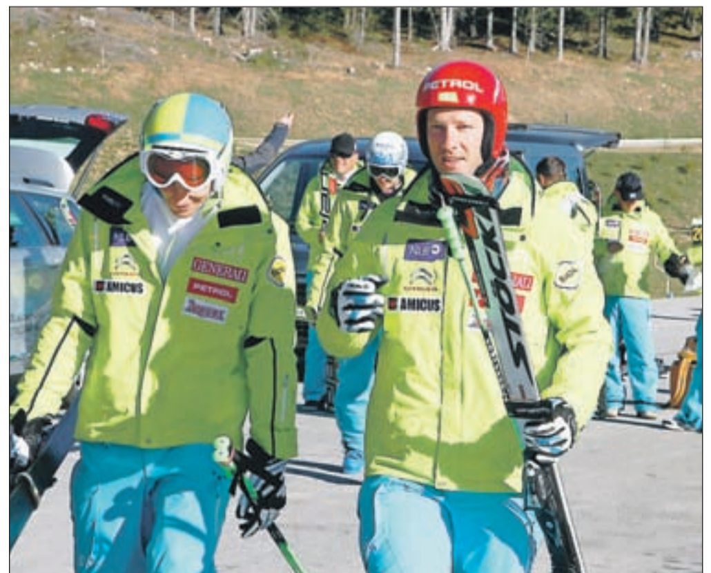
Za Andreja Jermana se je nova sezona končala po padcu na smuku v Beaver Creeku.