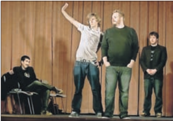
Z izvirno igro so improvizatorji poskrbeli za odlično predstavo.

možnosti interpretacije. Publika se je vključevala s predlogi, kot so prostor dogajanja, odnos dveh ljudi, dogodek, kjer se prizor odvija, čustva, ki to niso, in podobno. Za prostor dogajanja so med predlogi iz občinstva izbrali vrt, dnevno sobo in srednjeveško taverno, v odnosih dveh ljudi so se znašli čarovnik in vajenec, brata, medicinska sestra in pacientka, dogodek, kjer se prizor dogaja, sta bila šola v naravi, pokopališče. Čustva, ki to niso, so bila recimo jezna požrešnost, navdušenje veselje in žalost. Improvizatorji so se tako morali postaviti v različne vloge in namišljene prostore ter celoten skeč izpeljati kar se da komično in med seboj povezano. To jim je tudi uspelo, saj je bilo občinstvo več kot navdušeno.