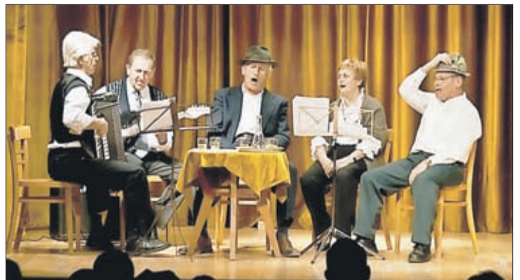
Člani KUD Podljubelj ob prepevanju ljudske pesmi Moj klobuk ima tri luknje.

Najprej so se predstavili s skečem Dobri sosede. Skeč je temeljil na odnosih med sosedi, kjer naj bi bilo na zunaj vse lepo in prav, kaj se v resnici dogaja med sosedi, pa vedo le vpleteni, in to v vsak svojo resnico. Prireditev se je nadaljevala s skečem in glasbeno točko najstarejših občanov KUD Podljubelj, ki so zapeli domače pesmi in občinstvo