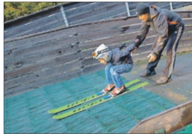
Skakalnice v Sebenjah so v uporabi celo leto.