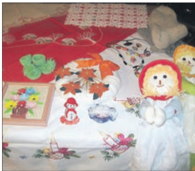
Nekaj izdelkov članic skupine Nežke, ki za ročna dela želijo navdušiti tudi mlajše generacije.