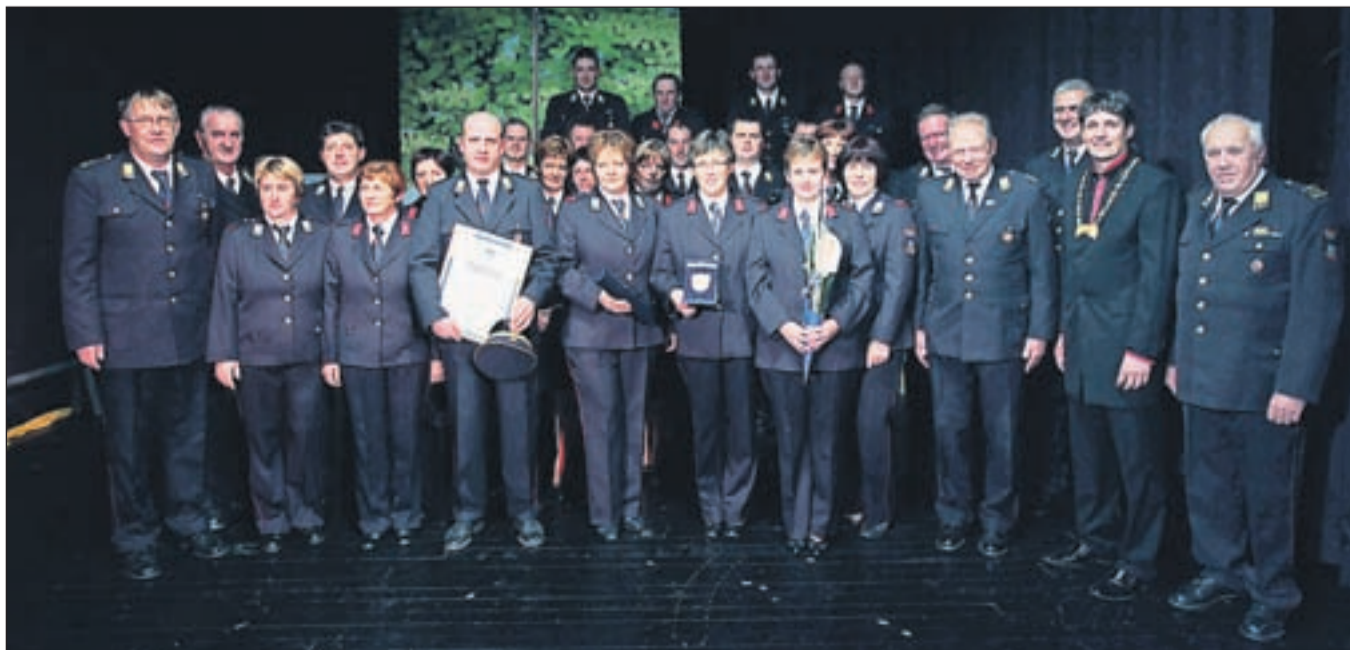
Članice in člani Prostovoljnega gasilskega društva Lom pod Storžičem

Vseh devetdeset let so člani in članice Prostovoljnega gasilskega društva (PGD) Lom pod Storžičem nesebično delovali v prid kraja in pomagali ljudem ne le v primeru požara, temveč ob vseh elementarnih nesrečah in ne ljubih dogodkih posameznih krajanov. V zadnjem obdobju so dogradili in posodobili gasilski dom, ob pomoči občine Tržič pa so pridobili tudi kombinirano gasilsko vozilo. Vse aktivnosti pri delu gasilskega društva opravljajo člani sami na prostovoljni bazi. S tem se društvo razvija in posodablja, posledično pa to pripomore k sodelovanju in druženju velikega števila ljudi. PGD Lom poleg redne gasilske dejavnosti vedno sodeluje tudi pri organizaciji vseh prireditev v kraju, ki jih organizirajo bodisi sami, krajevna skupnost, društva ali drugi. "Ob devetdesetletnici smo predali namenu orodno vozilo za prevoz moštva, obnovili in dokončali fasado na gasilskem domu, vse skupaj v sodelovanju s krajevno skupnostjo, krajanji in občino, ki nam je ob tem tudi finančno pomagala. Plaketa je sad preteklega dela, hkrati pa nam daje motivacijo za delo naprej. Trenutno nas je v PGD Lom 130 članov, od tega trideset operativnih. V svoje vrste vključujemo tudi mladino," je povedal predsednik PGD Lom Gregor Meglič.