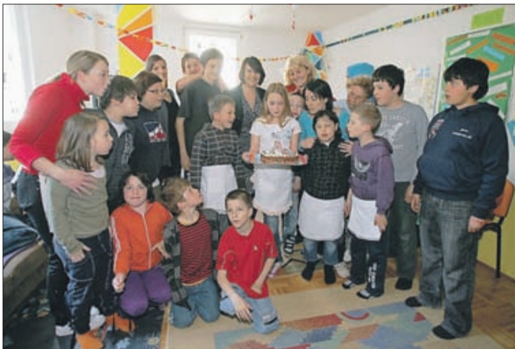
Šest svečk na rojstnodnevni torti za šesti rojstni dan