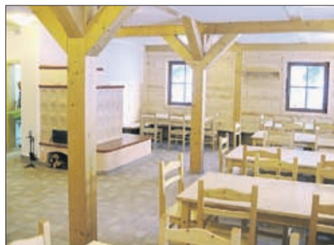
Notranjost doma