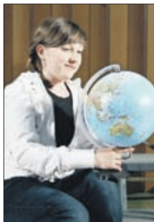
Delček nastopa dramskega krožka OŠ Bistrica