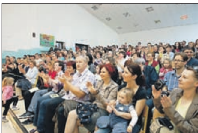
Številni obiskovalci so bili nad nastopi navdušeni.