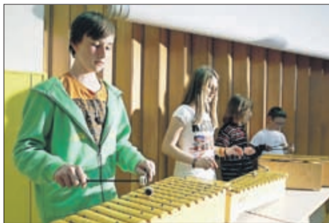
Orffova skupina, ki je spremljala otroški zbor OŠ Tržič.