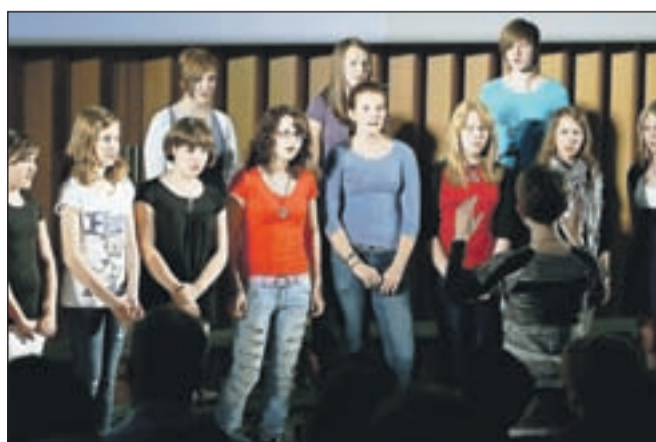
Navdušil je tudi Mladinski pevski zbor OŠ Bistrica.