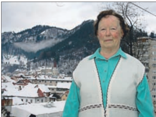
Klena planinka na Virju, od koder je lep pogled na Tržič in hrib Kamnek.

vrha me kdaj bolijo kolena in kolki, a to kmalu mine. Ostanjejo lepi spomini na rože, živali, potoke in neokrnjeno naravo. Nepozabni so tudi razgledi z vrhov in idiličnih krajev, kakršni so zame Kriški podi. Hribi človeka zasvojijo. To je edino, kar mi je v veselje. Če dalj časa ne morem v gore, mi nekaj manjka. Ko se vracam s hribov, sem boljše volje in se dobro počutim. Zato je moja velika želja, da bi me noge čim dlje dobro nosile. Na Kamnek hodim tudi zato, ker je Virje od jeseni v senci, tam pa je pobočje obsijano s soncem," je dejala klana tržiška planinka.