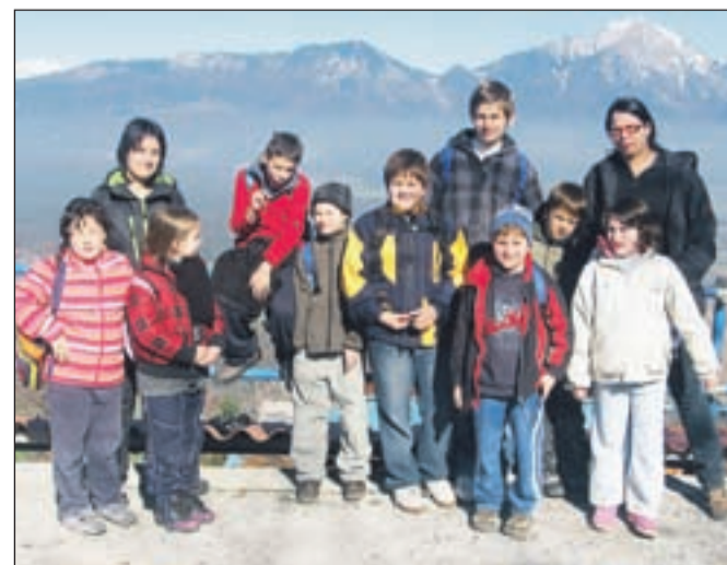
Mladinski center Centra za socialno delo Trzič poskrbi tudi za zanimive izlete.