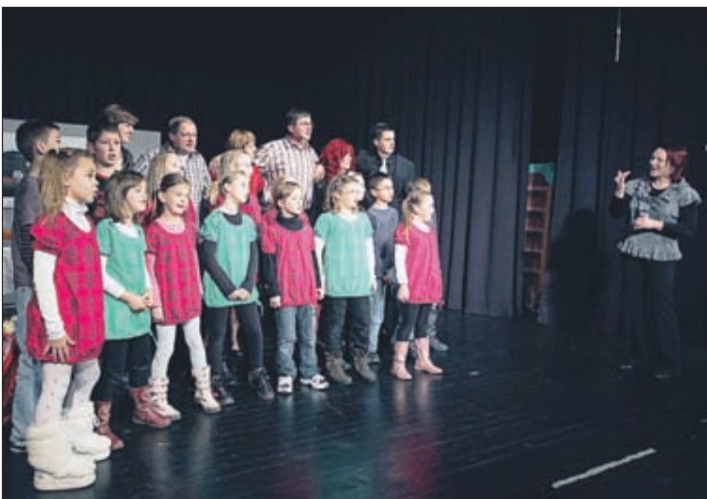
Otroškemu pevskeemu zboru podružnične šole Lom so se na koncu pridružili igralci in voditeljja kulturnega programa.