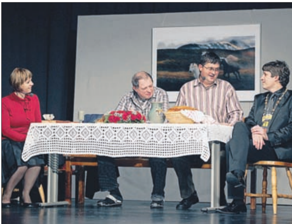
Igralci iz Loma so povabili župana, da je podelil priznanja Občine Tržič.