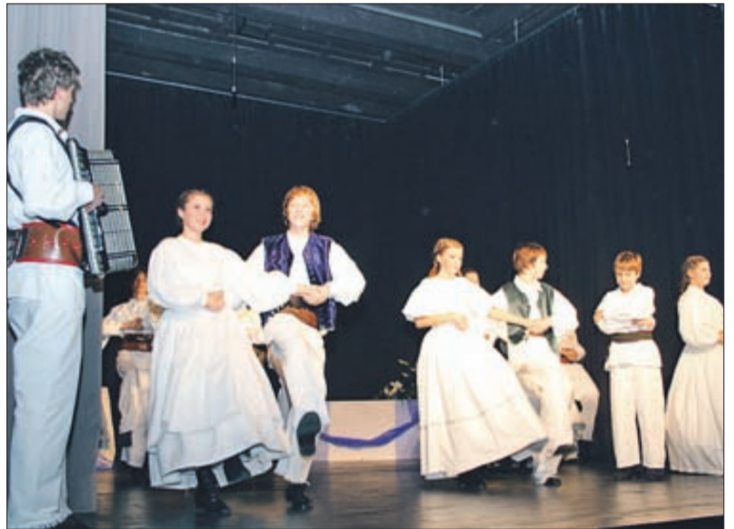
Mladinska folklorna skupina Karavanke v postavitvi Ptčki Saše Meglič