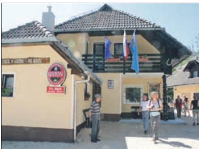
Ob zavetišču v Gozdu imajo člani Planinskega društva Križe tudi društvene prostore.