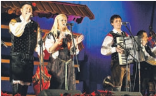
Nastopil je tudi jezerski ansambel Veseli Gorenjci.