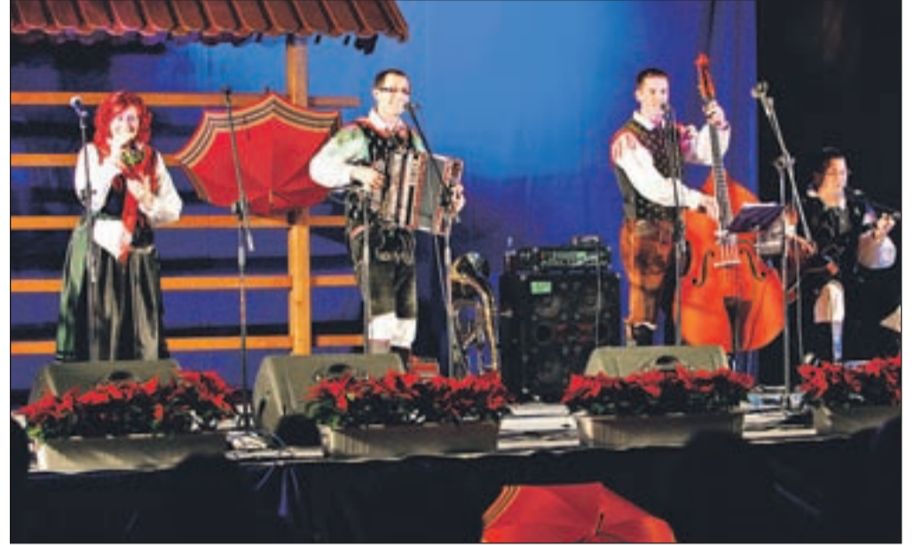
Jubilejni koncert ansambla Zarja je napolnil Dvorano tržiških olimpijcev.