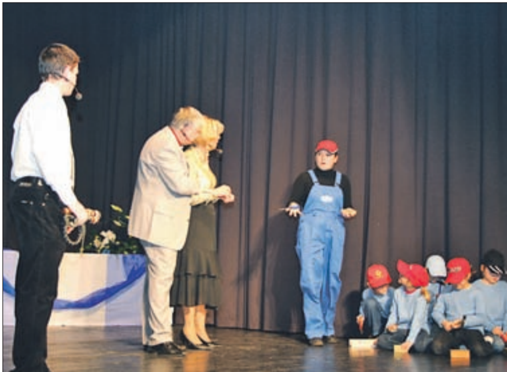
Odrasli igralci in Otroška gledališka skupina POŠ Lom v vlogi delavcev