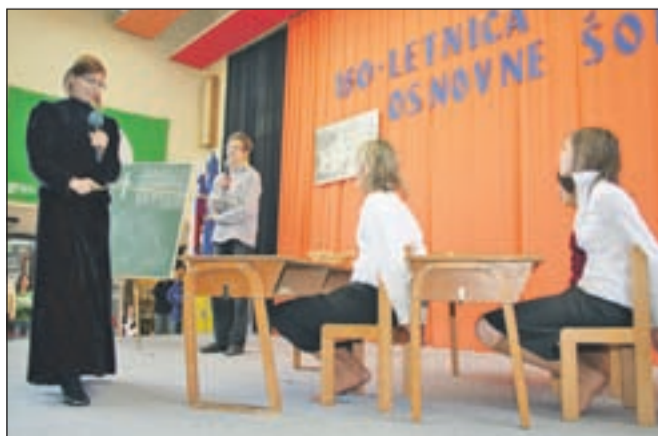
Učenci so uprizorili, kako je nekdaj potekal pouk in kakšen red je vladal.