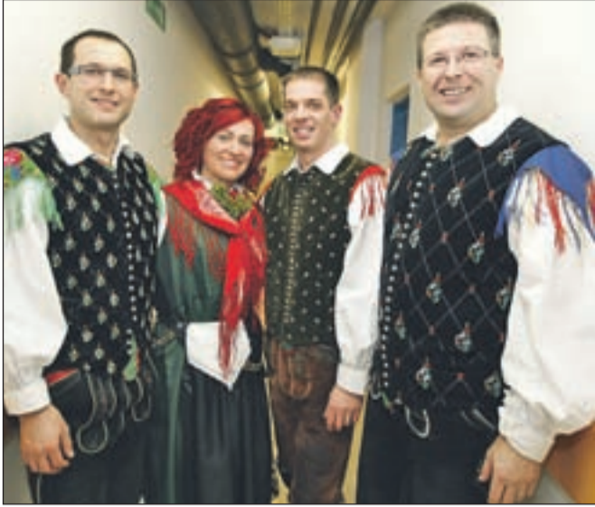
Člani ansambla Zarja