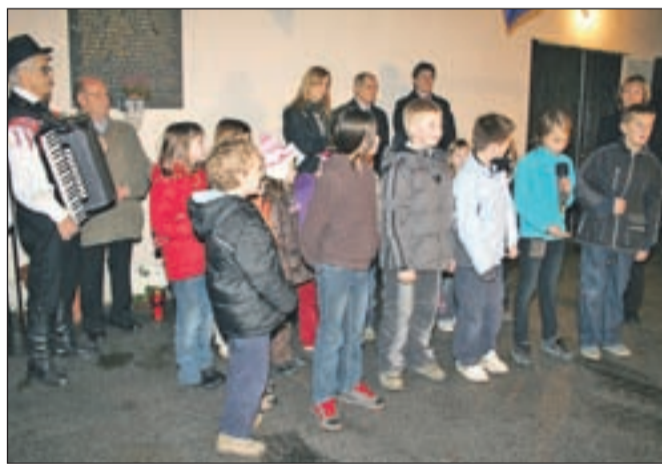
Učenci iz Podljubelja so predstavili pesem o novi cesti v vasi.