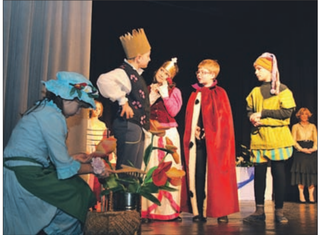
Otroška gledališka skupina POŠ Podljubelj je zaigrala Modro vrtnico.