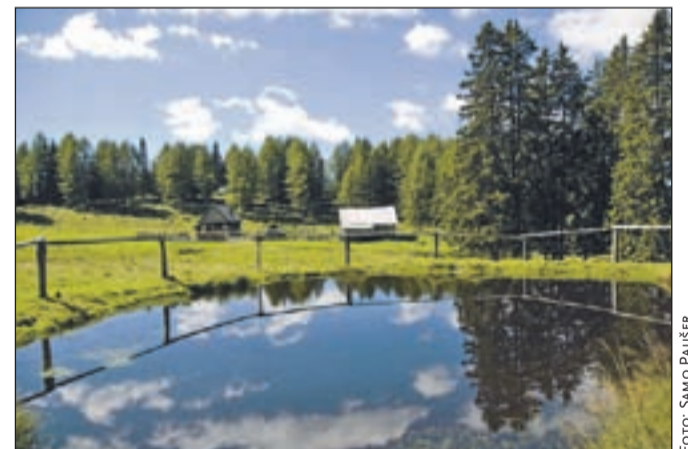
Kraj, kjer se spočijeta duša in telo.

Edina krava molznica da tri do štiri litre mleka na dan, ki ga predelata v kislo mleko, skuto, smetano in masovnek. Ker mleka močno primanjkuje, ga morata za druge potrebe, tudi kavo, kupovati v trgovini. Vse pridelane mlečne dobrote pa z veseljem ponudita tudi vsem obiskovalcem. Letos jih je bolj malo, po besedah majerja je za to kriva tudi zapora ceste pri kmetiji Pavšel v Grahovšah in močna konkurenca planšarij pod Košuto, ki se vse bolj usmerjajo v turizem in poleg tipičnih planšarskih nudijo tudi druge storitve. Obisk planine Konjščica je pisan na kožo vsem tistim, ki imajo radi mir in samotne poti. Živina bo na planini do 8., planšarija pa bo odprta do 12. septembra. Pot čez Konjščico, poimenovana Na planinah lušno biti, je tudi prva od urejenih tematskih poti v občini Tržič in predstavlja način življenja v sredogorju. Od kmečkega do planinskega doma popotnik odkriva zaklade kulturne in naravne krajine, zanimiva