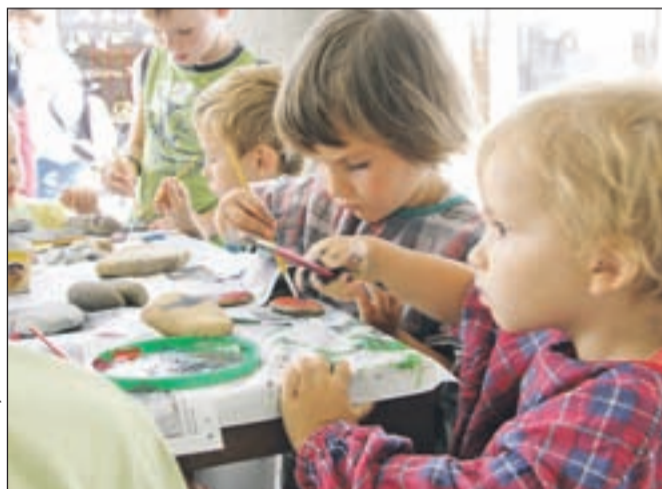
Tudi najmlajši so uživali pri barvanju kamnov.

nosti ali oddih. Na ustvarjalni delavnici, ki jo je v soboto, 15. avgusta, v sklopu otroških matinee Tržiških poletnih prireditev 2009 organizirala Občina Tržič, so otroci spoznavali, kako zanimive kamne lahko poberejo na bregu naše reke in kaj vse lahko z njimi ustvarimo.