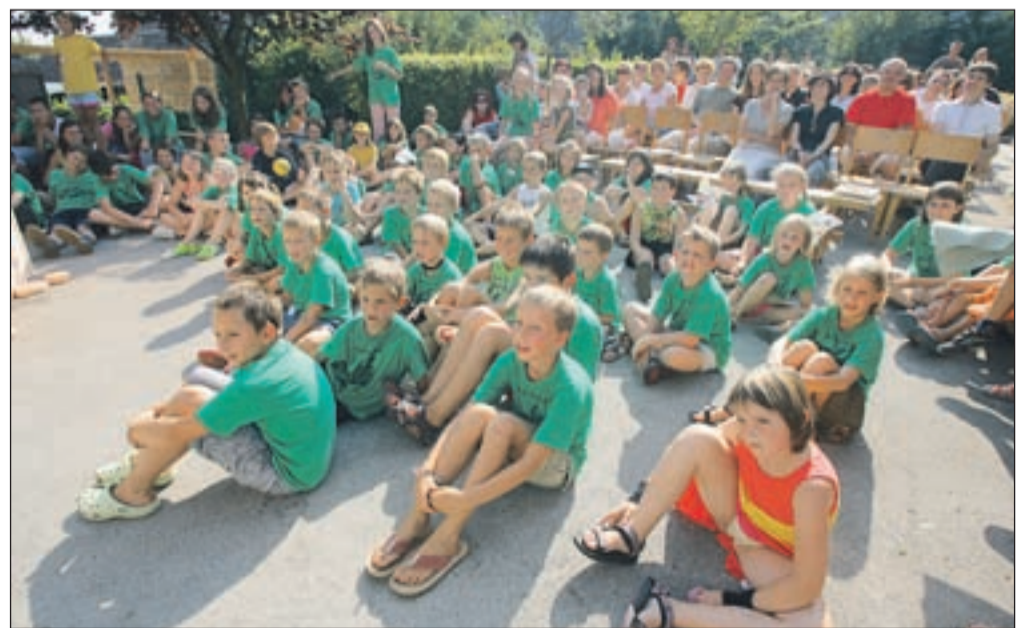
Na oratoriju je bilo približno osemdeset otrok; za njihovo varnost je skrbelo okoli 20 animatorjev.

Letošnji oratorij v Križah je potekal od 17. do 21. avgusta. Otroci so bili od doma odsotni od devete ure zjutraj pa vse do pozne četrte popoldanske ure. Tudi letos je bil oratorij izredno razgiban, zanimiv in niti približno dolgočasen. Vsaj tako so ga označili otroci, ki so konec avgusta povedali in predstavili, kaj vse so tam počeli. Tudi letos je bilo otrokom na voljo veliko ustvarjalnih delavnic, ki so imele prav zanimiva imena. Tako so na primer pri delavnici z imenom Čiv Čiv izdelovali ptičke, pri delavnici Lepo in mehko blazine, pri delavnici Lepo diši pa so se učili izdelovati pogrinjke. Otroci so poleg vsega tega izdelovali tudi vetrnice, mozaike, skladali pesmi, plesali in počeli še mnogo drugih stvari, da so zapolnili vroče poletne dni. Tudi letošnji oratorij je imel svojo himno ter istoimenski slogan "Nate računam". Za približno osemdeset otrok, ki so se udeležili letošnjega oratorija, je skrbelo okoli dvajset animatorjev. Zaključ-