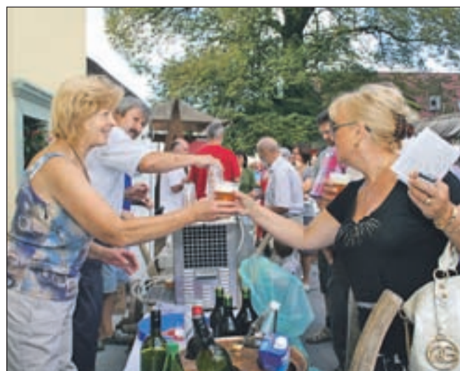
Lojzka in Vanč sta skrbeli, da obiskovalci niso trpeli žeje.