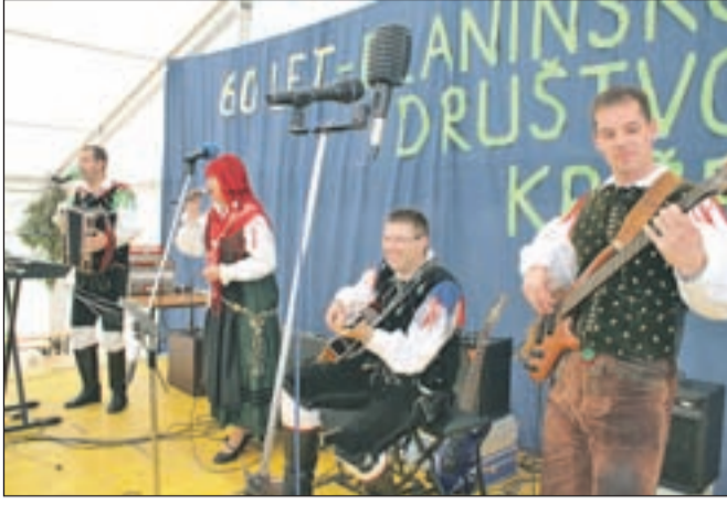
Nastop ansambla Zarja na letošnji 60-letnici PD Križe v Gozdu