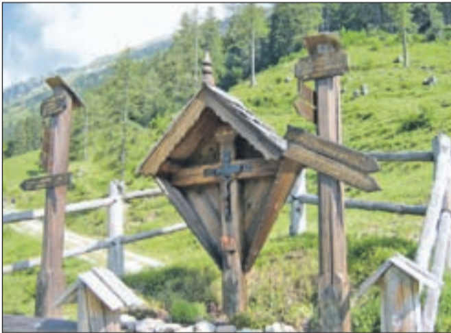
Kažipotni ob znamenju vas usmerijo dalje.

kjer na velikem parkirišču pod Domom Oaza miru parkiramo avto, se opremiljeni s svetilko odpravimo najprej po kamniti, nato pa gozdni poti proti Prevali. Kmalu se nam začnejo odpirati pogledi na Šentansko dolino, preko melišča na nasprotni strani doline pa se vije pot na Korošico. Za vse tiste, ki jim pogled v globino ni prijeten in imajo strah pred višino, je poskrbljeno s trdnimi jeklenicami, vsem drugim pa se pogled lahko ustavi tudi na območju nekdanje podružnice koncentracijskega taborišča Mauthausen, kjer so med 2. svetovno vojno hiral taboriščniki, graditelji ljubeljskega predora. Ko prispemo do prvega Bornovega tunela, pride prav tista svetilka na dnu nahrbtnika, če pa je nimamo, bo sprehod skozi tunel nekoliko bolj