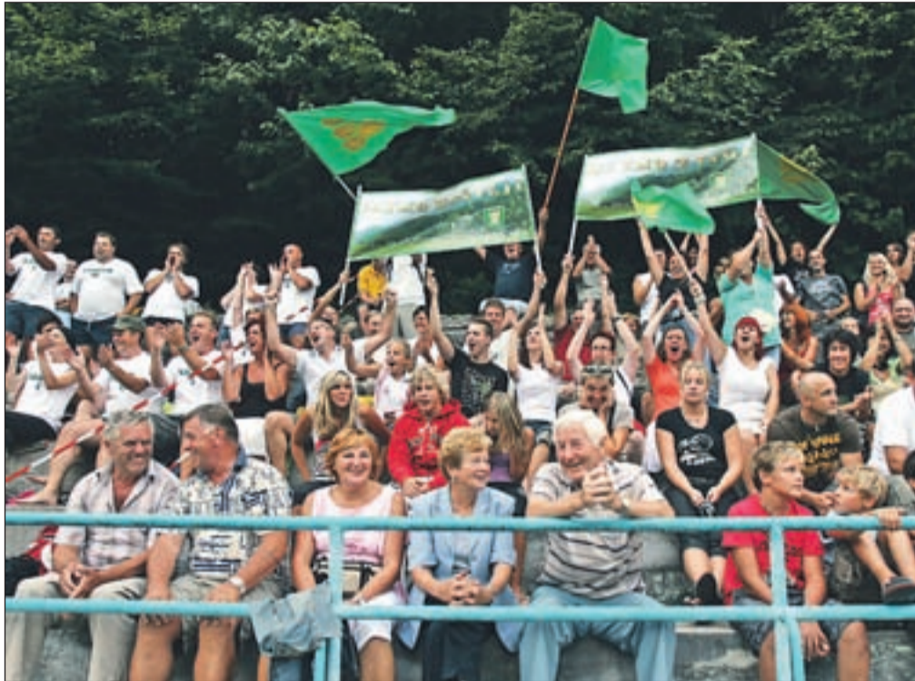
Na letošnjih igrah so bili najbolj živahni in glasni navijači Kašarjev iz Žirovnice.

Letno kopališče Tržič je letos doživelo dvojne igre. Na zimo se je končala drama o zaprtju bazena in gradnji trgovine. Poleti pa so uprizorili tradicionalno komedijo za občinstvo, enajste Tržiške igre veselja in smeha.