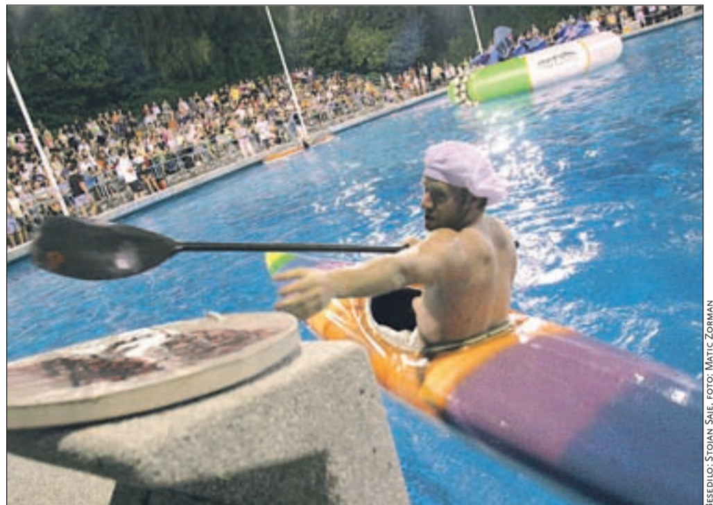
Rdeča nit Halo pizza je terjala veliko spretnosti tekmovalcev pri vožnji v kajaku.