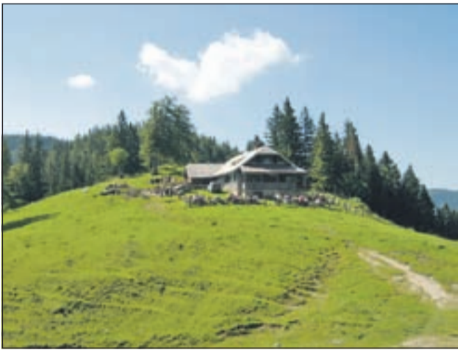
Kočna na Prevali

adrenalinski. Pazimo na glavo, predvsem pri vходу, korak pa prilagodimo tudi nekaj velikim lužam. Ko tunel pustimo za seboj, še nekaj časa hodimo po robu vzhodnega ostenja Begunjščice, nato pa nas od kočne na Prevali loči le še zmeren vzpon, sicer pa gozdna pot, ki se pod kočjo priključi poti iz Potočnikovega grabna. Spotoma utrgamo kislo robido in občudujemo metu-lja, ki mirno počiva. Po dobri uri hoje prispemo pred