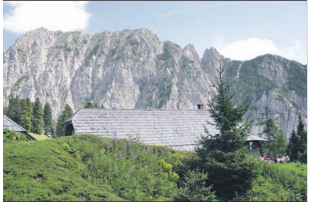
S planine je lep razgled na visokogorje.