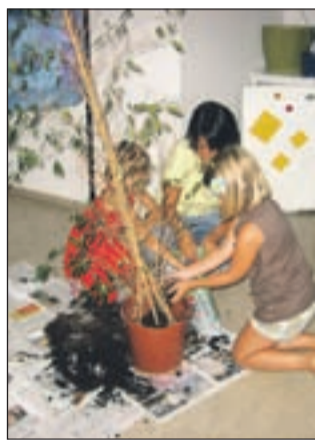
Med ekološko delavnico so otroci presajali rože, ki krasijo center.

Ekipe Mladinskega centra se je kljub temu potrudila, da so mladi nadomestili vse zamujeno. Svoje kreativne prste so preizkušali pri izdelovanju različnih klobukov. Vroče dni smo skupaj krajšali ob družabnih igrah in v filmski delavnici. Za športno dogajanje smo po-