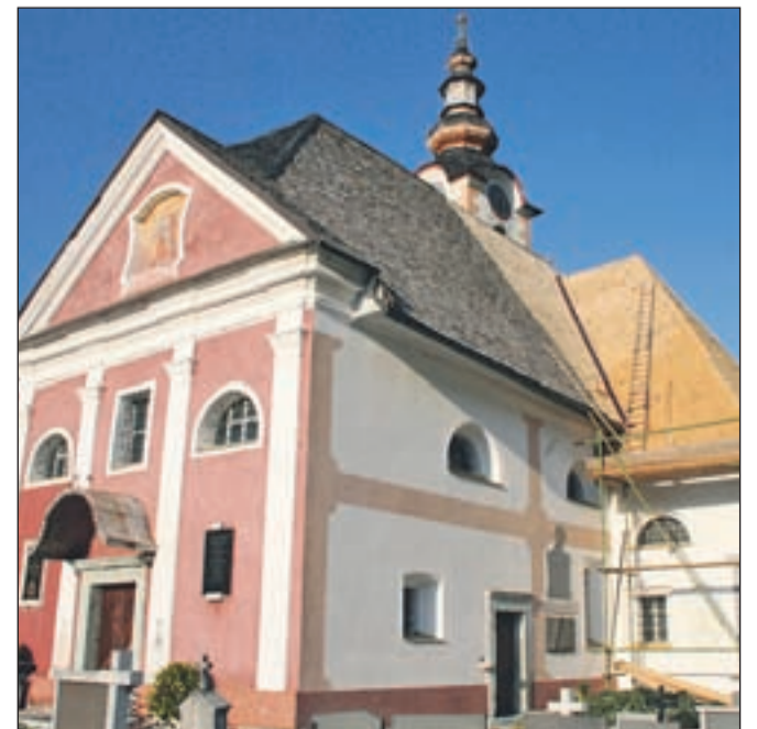
Letos so dokončali obnovo strehe na cerkvi v Lomu.