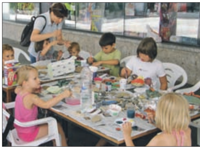
Delavnica ustvarjanja s kamni je bila dobro obiskana.