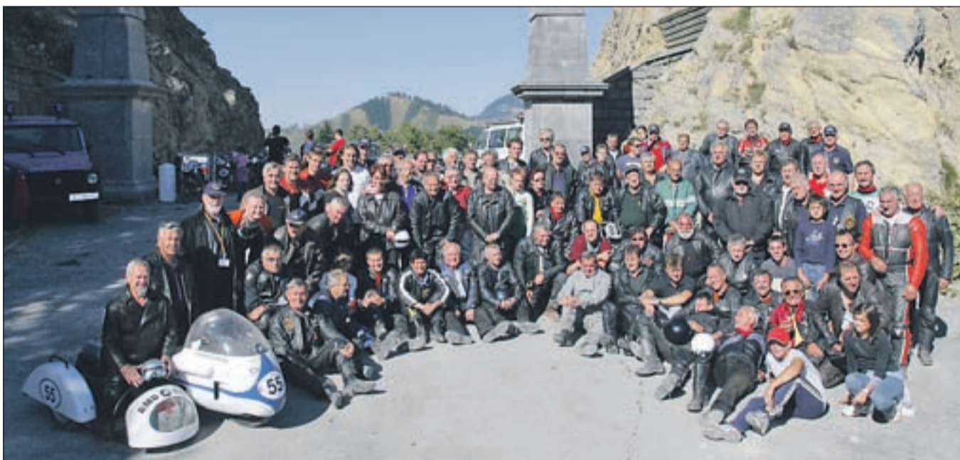
Udeleženci Hrastovega memoriala po tekmi na vrhu Ljubelja