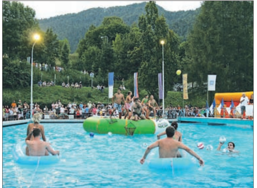
Takole je izgledala Ribiška košarka, v kateri je bila najboljša ekipa Leteča teleta.