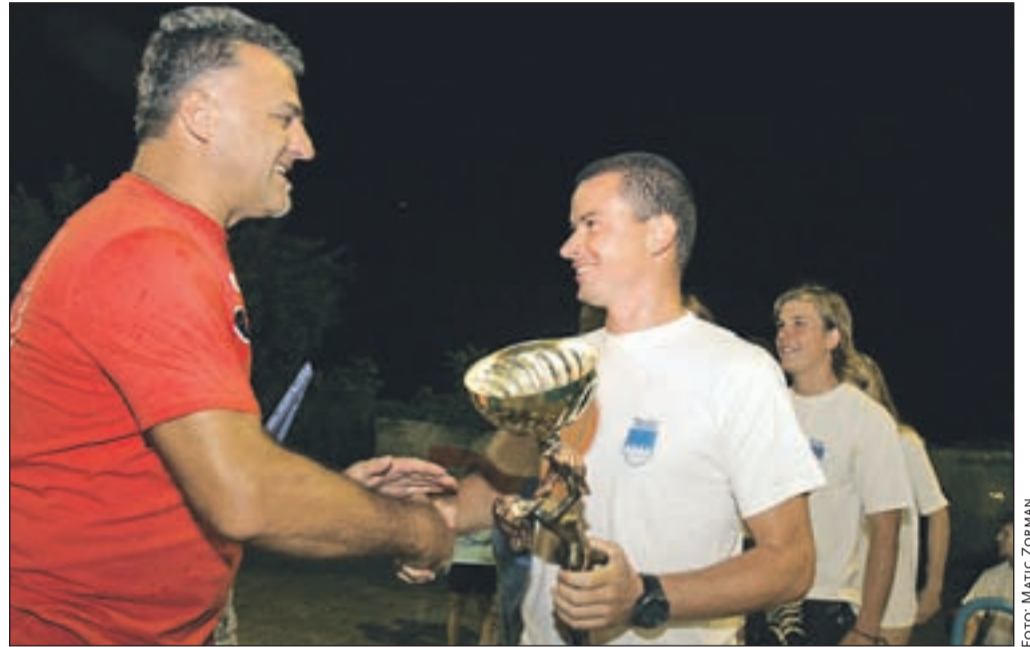
Ekipa Tržiča je z zmago na igrah vrnila prehodni pokal v domačo občino.

Domačini so sestavili ekipe z imeni Tržič, Biljard in Leteča teleta. V slednji je bilo tudi nekaj tekmovalcev iz Kranja. Poleg ekipe Žirovnice so tekmovali še Preddvorski hudički in Poskočni krompirčki iz Naklega. Lanski zmagovalci so prinesli vreče krompirja, da bi z malo sreče ponovili uspeh. Na veselje domačinov se to ni zgodilo. Dogajanje je bilo ves čas napeto. Po štirih igrah so vodili Kašarji, Poskočni krompirčki so bili tik za njimi, Tržič in Leteča teleta pa so si delili tretje mesto.