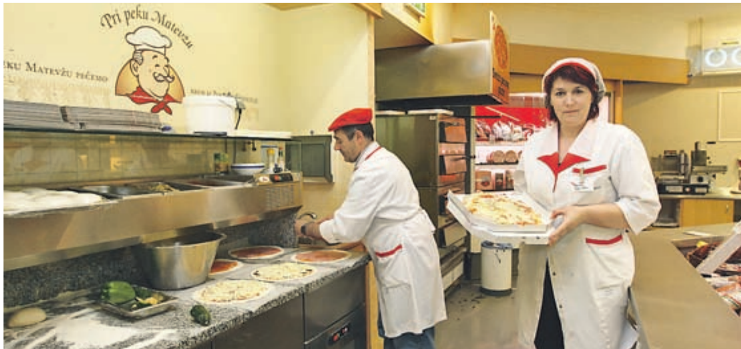
V Supermarketu Tržič vas vsak dan pričakuje prijazno osebje.