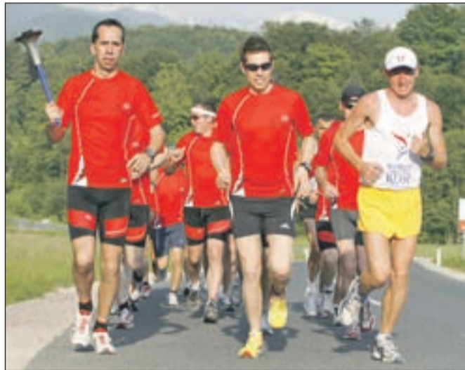
Mednarodni ekipi tekačev so se na teku svetovne harmonije pridružili tudi člani Tržiških strel.

Pihalni orkester Tržič in plesalci Plesnega kluba Tržič. Tekalci so v Tržiču prespali, naslednji dan pa s plamenico, ki simbolizira temeljno človekovo potrebo po prijateljstvu in razumevanju, obiskali tržiško šolo in vrtec, nato pa se podali naprej na pot po Gorenjski.