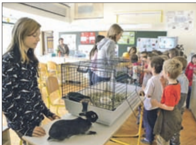
Otroke so očarale žive živali, ki so jih pokazali v eni od delavnic.