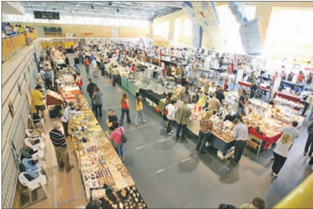
Pogled na Dvorano tržiških olimpijcev, ki se je spremenila v geološko tržnico.

Mednarodni dnevi mineralov, fosilov in okolja so največja spomladanska prireditev v Tržiču. Letos je Turististično društvo Tržič razširilo razstavní prostor tudi v nadstropje, kjer so bile razne delavnice. Kaj se je dogajalo v pritličju in zunaj, je ujela v objektiv fotografinja Gorenjskega glasa.