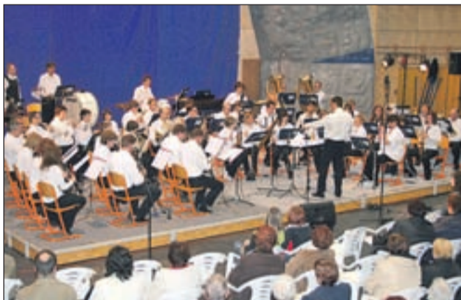
Pihalni orkester Tržič na spomladanskem koncertu v Tržiču