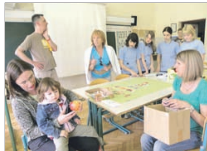
Starša sta rešila kviz o zdravi hrani, Neža pa je dobila jabolko.