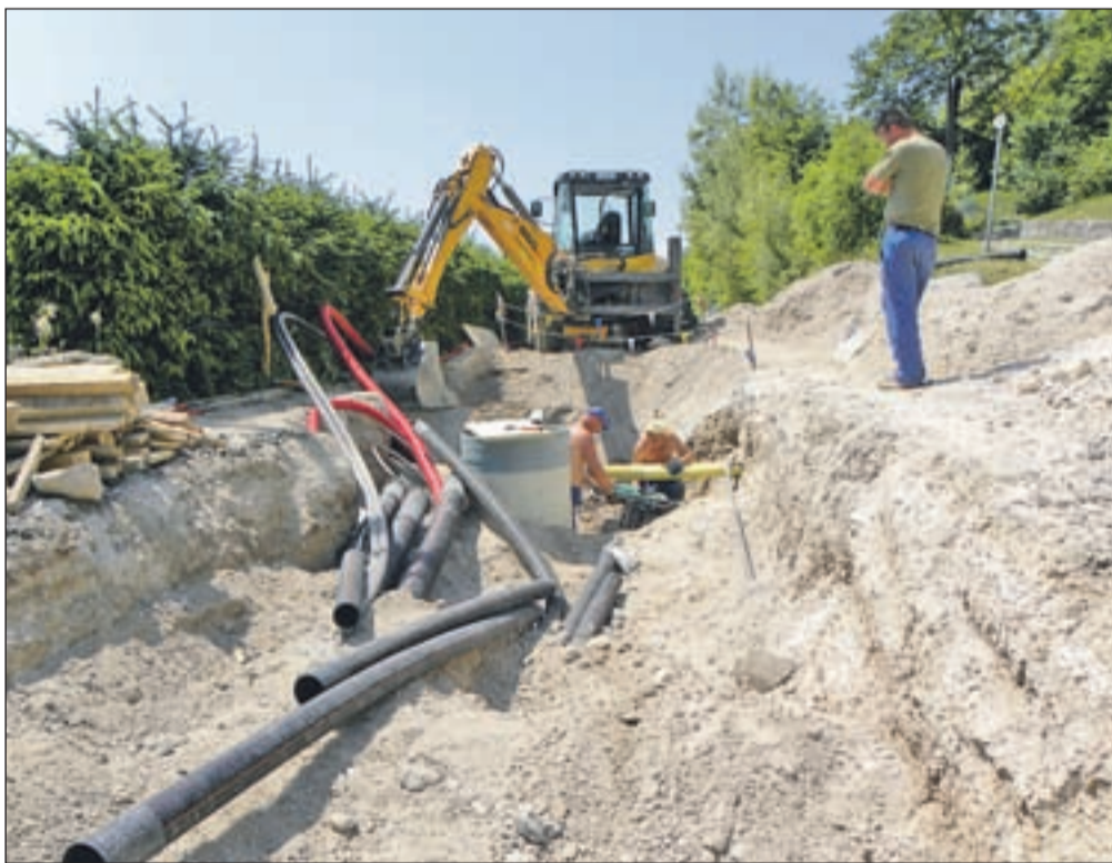
Na klancu v Bistrici končujejo gradbena dela pri komunalnih napeljavah.

Kako obsežen je projekt, pove podatek, da je hkrati odprtih do 25 gradbišč po vsej občini. Skoraj v celoti je zgrajen 1497 metrov dolg vodovod od zajetja Črni gozd do Podljubelja. Končujejo tudi gradnjo 5390 metrov vodovoda Črni gozd - vodni zbiralnik Ibelc. Od tega zbiralnika so letos začeli graditi 644 metrov vodovoda do mesta in 1522 metrov vodovoda med Presko in Pristavo. V industrijski