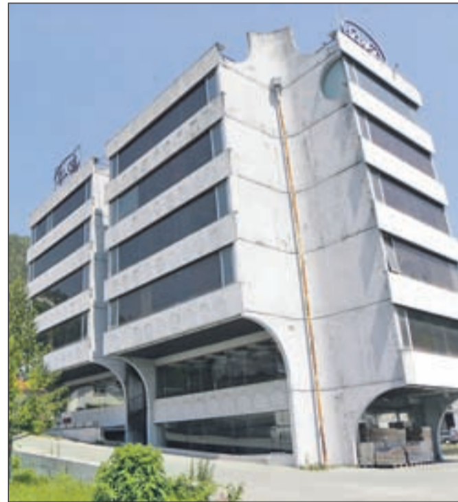
Pogled na stolpič, kjer je bila nekdanja uprava podjetja Peko.

dajo je tudi, da kupec zgradi novo dovozno cesto do podjetja Peko. Vodstvo občine je potrdilo, da je največji interesent za nakup stavb Kranjska investicijska družba. Ker je propadla namera za gradnjo trgovine Hofer na tržiškem kopališču, bi jo sedaj postavili na tej lokaciji. Del prostorov bi odkupili domači podjetniki, kar obeta nova delovna mesta v Trzinu. Sprva je kazalo, da bo edina ovira pri tem projektu spomeniška zaščita ene od treh stavb. Tik pred javno dražbo so ugotovili, da so v lasti Peka tudi zemljišča z mestno vpadnico in Parkom prijateljstva prek te ceste. Občina se že dogovarja za odkup teh zemljišč in ureditev lastniških razmerij s tovarno Peko, saj bi rada čimprej omogočila prodajo nepremičnin resnim investitorjem.