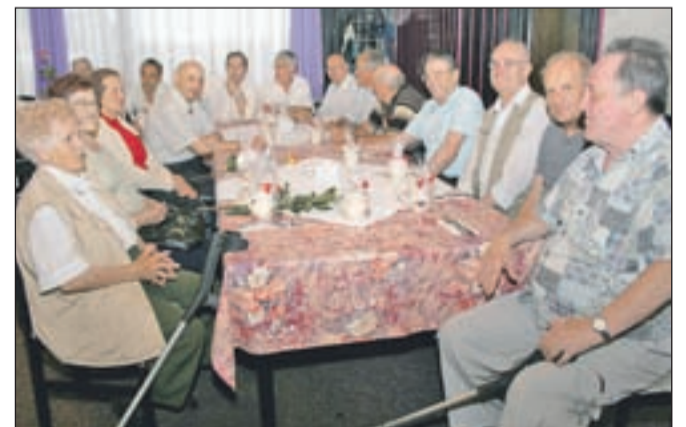
Del omizja, kjer so se zbrali 75-letniki iz Tržiča in okolice.