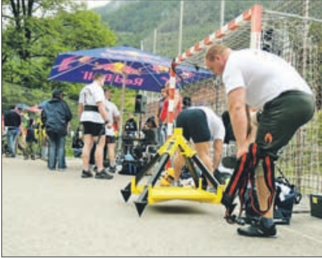
Tekmovalci za Martina Krpana so se morali pred tekmo dobro ogreti.