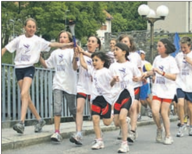
Plamenico so ponesli tudi mladi Tržičani.