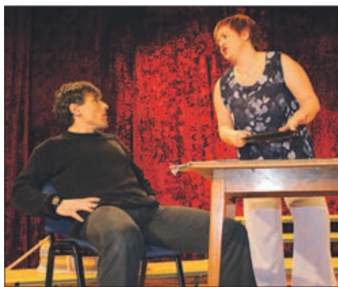
Prizor iz humoreske Zakonski stan, ki je razvedrila občinstvo.