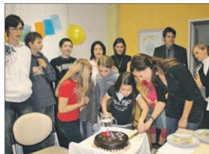
V mladinskem centru so razrezali torto za četrty rojstni dan.