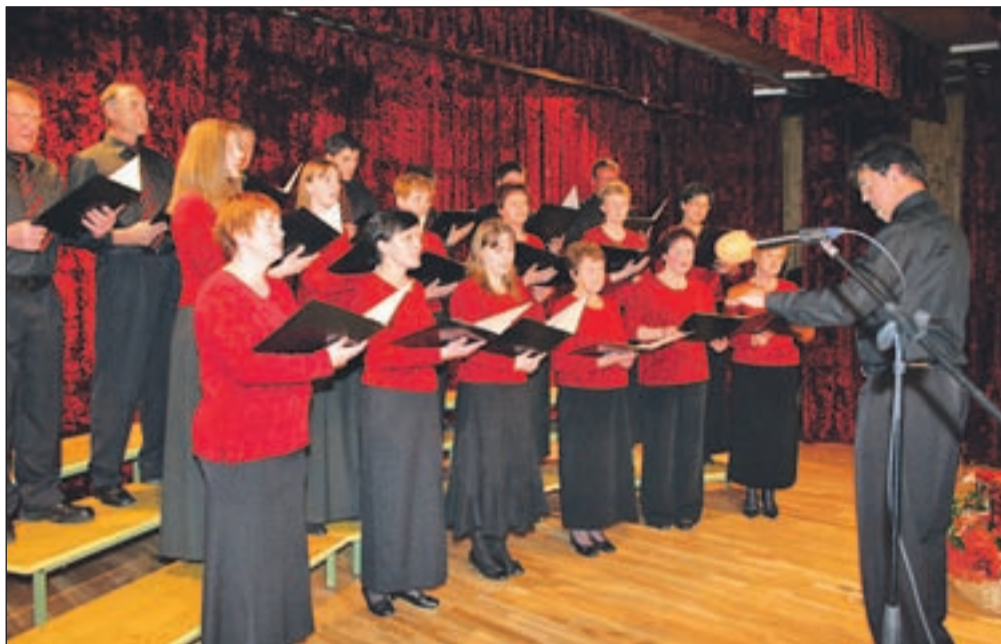
Mešani pevski zbor povezuje največ ljubiteljev petja v Lomu.