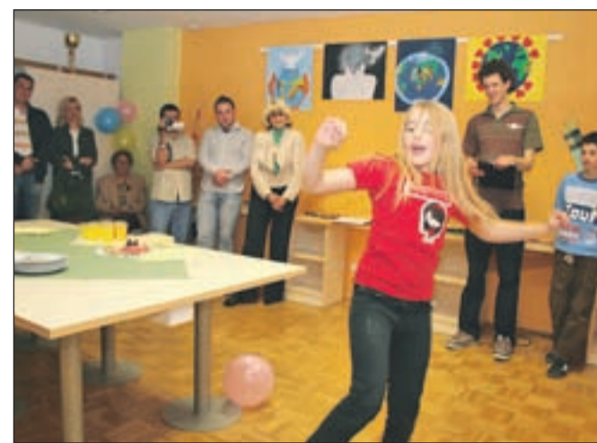
Obiskovalci so uživali v programu, v katerem je bilo veliko plesa.