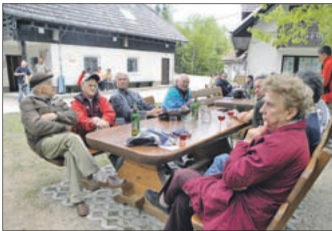
Borci v Gozdu, kjer so bili tudi predstavniki krajevnih organizacij Bistrica in Križe.