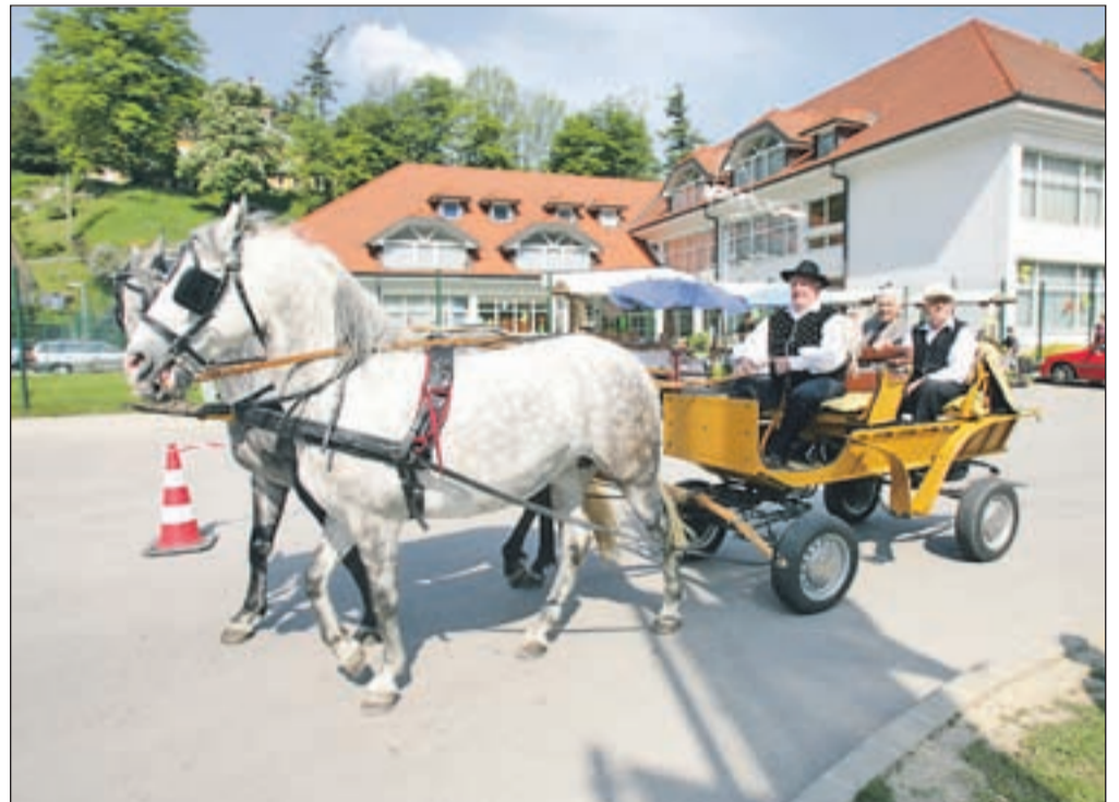
Kdor ni želel peš po mestu, se je lahko zapeljal po okolici s kočijo.