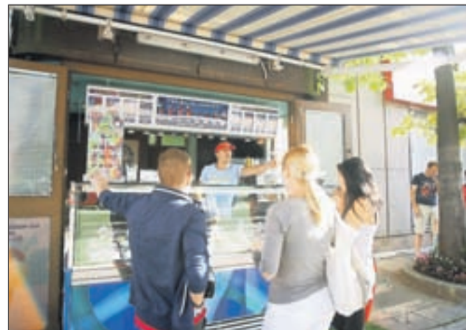
Okusna tržiška kepica sredi Kranja

Festival Kranfest s svojo Kranjsko nočjo je v Kranju potekal zadnji vikend v juliju. Dvodnevni mozaik številnih dogajanj je ponudil glasbene ter športne dogodke, modno revijo gledališke predstave in animacijski program za obiskovalce vseh generacij. Vreme je zdržalo, obisk festivala pa je bil namig, da Kranjčanom manjka tovrstnega dogajanja čez vse leto.