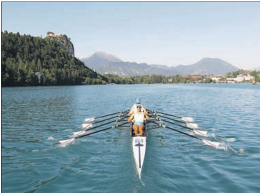
Čudovita naravna veslaška proga na Bledu je bila v preteklosti prizorišče številnih mednarodnih in domačih tekmovanj, svetovno prvenstvo pa bo Bled gostil četrtič.