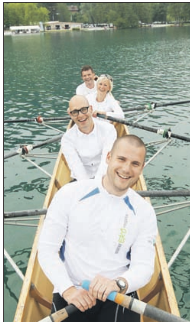
Posadka iz podjetja BMW Group Slovenija na eko regati na Bledu

"BMW eko regata je odličen primer projekta, ki je uspešno povezal podjetja in šole za dober namen. Letošnja prva BMW eko regata je presejala pričakovanja in želimo si, da bi postala tradicionalna. Tudi v prihodnje se moramo predstaviti gospodarstva in širše družbe odzvati na takšne pobude in sodelovati pri projektih, ki podpirajo družbeno in okoljsko odgovornost."