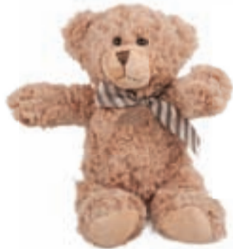
MEDO TIM S PENTLJO, velikost 29 cm, na voljo v dveh barvah