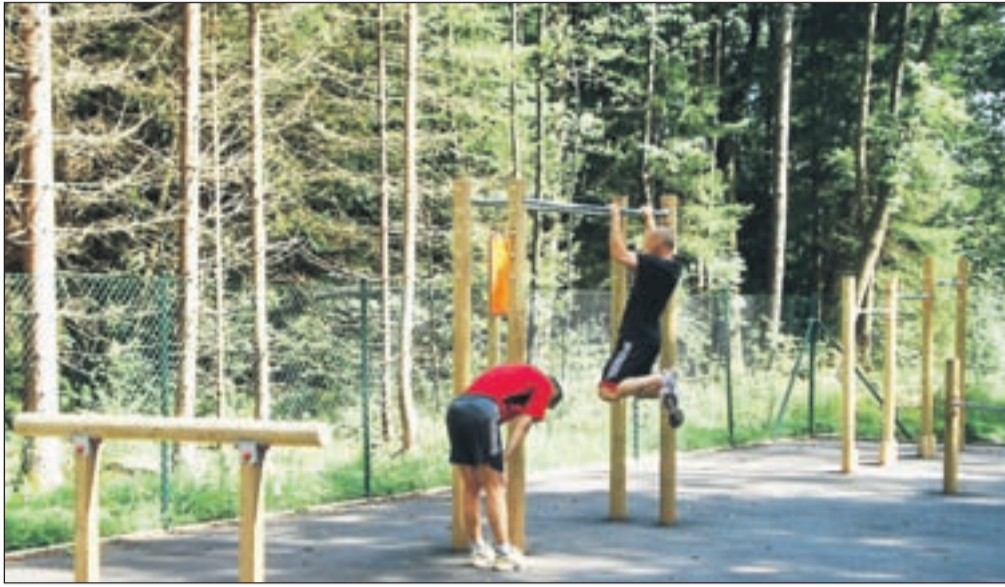
Osem orodij iz naravnih materialov omogoča boljšo pripravo na vadbo in vaje po njej.