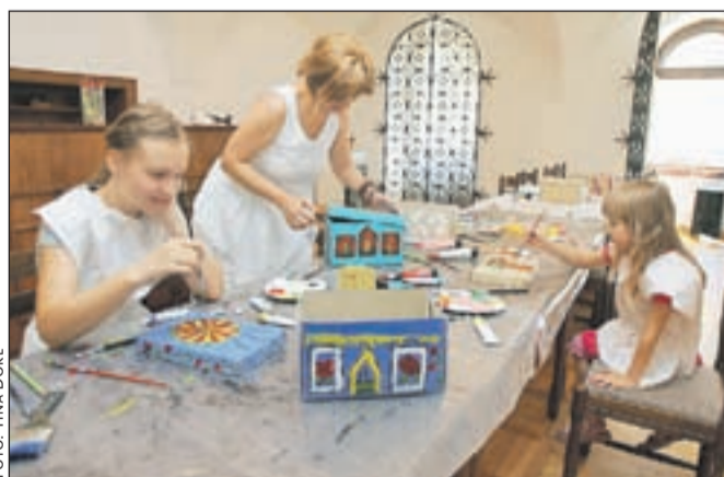
Ustvarjalna delavnica pod vodstvom Gorenjskega muzeja