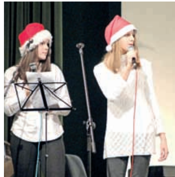
Solistki Šolskega benda

Za veliki finale so se vsi nastopajoči, skupaj z učiteljicami, ki so v pripravo koncerta zagotovo vložile veliko truda, zbrali na odru. Veselih praznikov ne bi