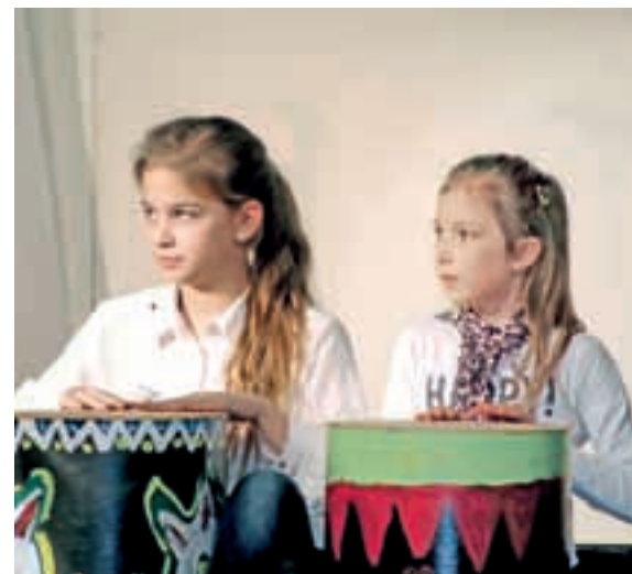
Glasbeni mojstrovalki pri igranju na bobne