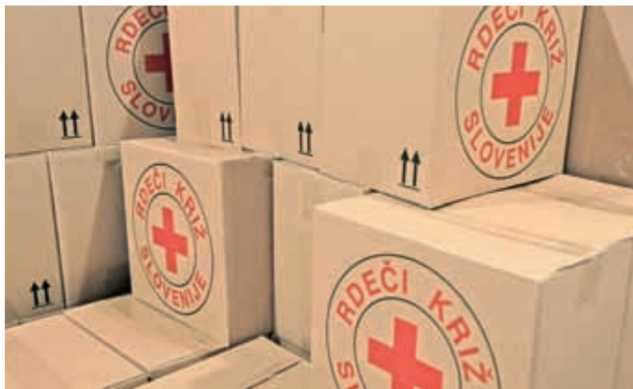
Skladišče RK v Kranju / Foto: Gorazd Kavčič

Istočasno v istem prostoru bomo praktično demonstrirali namen in uporabo defibrilatorja. Želimo, da bi se čim širši krog krajanov seznanil in usposobil uporabljati defibrilator za oživljanje prizadetih. Defibrilator je po hitrem postopku vsak trenutek dosegljiv v Domu krajanov. Uporabnik mora le imeti določeno zna-