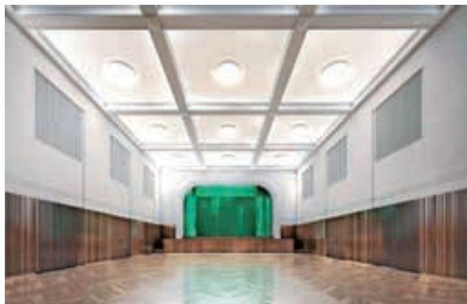
Idejni načrt prenove dvorane v Domu krajanov