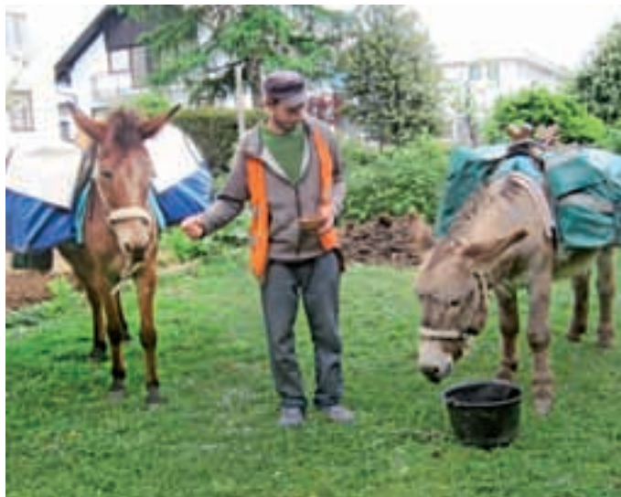
Postanek na Primskovem / Foto: Janko Zupan