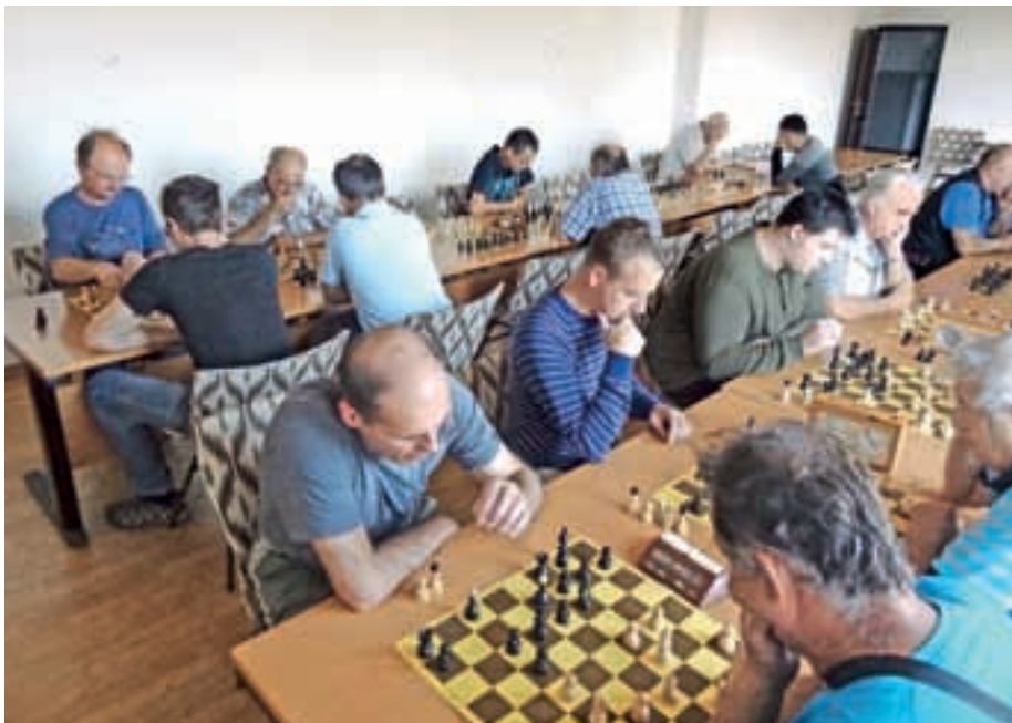
Šahovski turnir 17. septembra 2015

Do konca letošnje serije šahovskih turnirjev, ki se upoštevajo za skupno razvrstitev, so preostali še trije turnirji, in sicer: 15. 10. (za krajevni praznik), 19. 11. in 3. 12. 2015. Razglasitev skupnega končnega vrstnega reda v celoletni razvrstitvi za letošnje leto bo po končanem novoletnem turnirju dne 17. decembra 2015, ko bomo najboljšim trem šahistom na Primskovem za leto 2015 podelili tudi priznanja. Vse ljubitelje šaha vabimo, da se nam