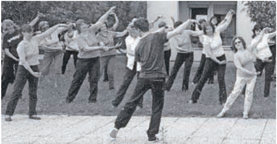
Vadba z upokojenci na prostem

Na dopoldanskih delavnicah v Domu krajanov Primskovo se udeleženci seznanjajo s principi kitajskih gibalnih veščin. Na sistematičen način je na tečaju možno usvojiti nov način dojemanja telesa in gibanja, ki je značilno počasno, nadzorovano in sproščeno. Poudarek je na vajah, ki povečujejo prekrvavitev, nežno razmišljajo sklepe, predvsem pa krepijo mišične