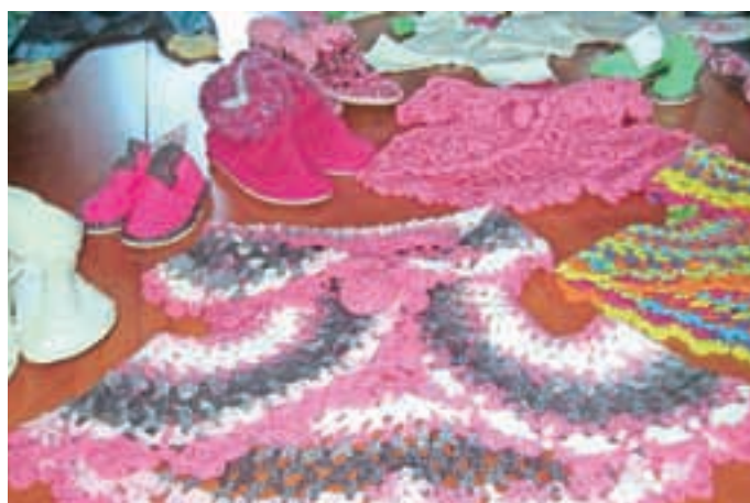
Nekaj idej za otroška oblačila