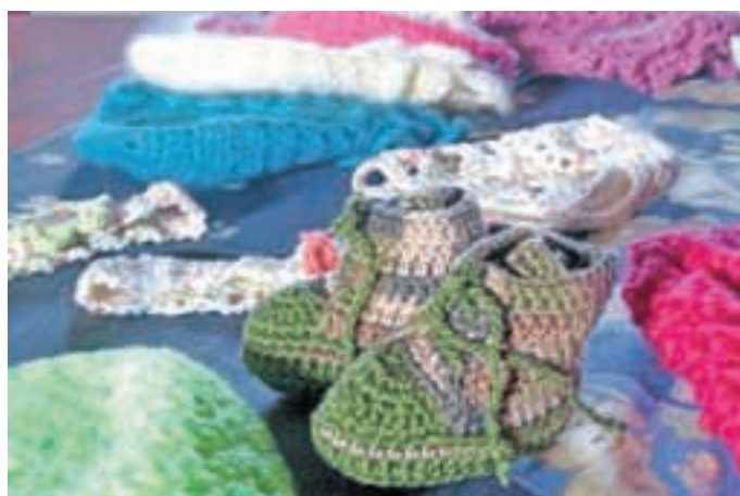
Pleteno, kvačkano ...