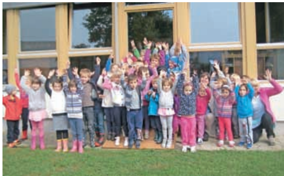
Radi imamo vrtec!