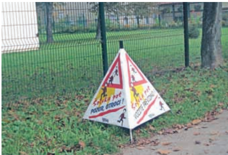
Naj bo pot v šolo varna.

Otroci naj iz vozila izstopajo na tisti strani, kjer ni ceste (običajno na desni), kadar je to možno.