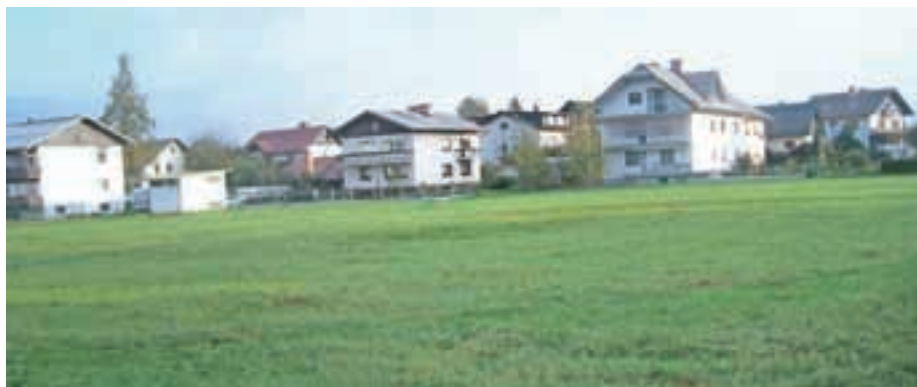
Travnik ob domu je MO Kranj umestila v zeleni pas.