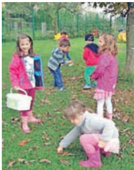
Kostanj so nabirali kar na »domačem vrtu«.