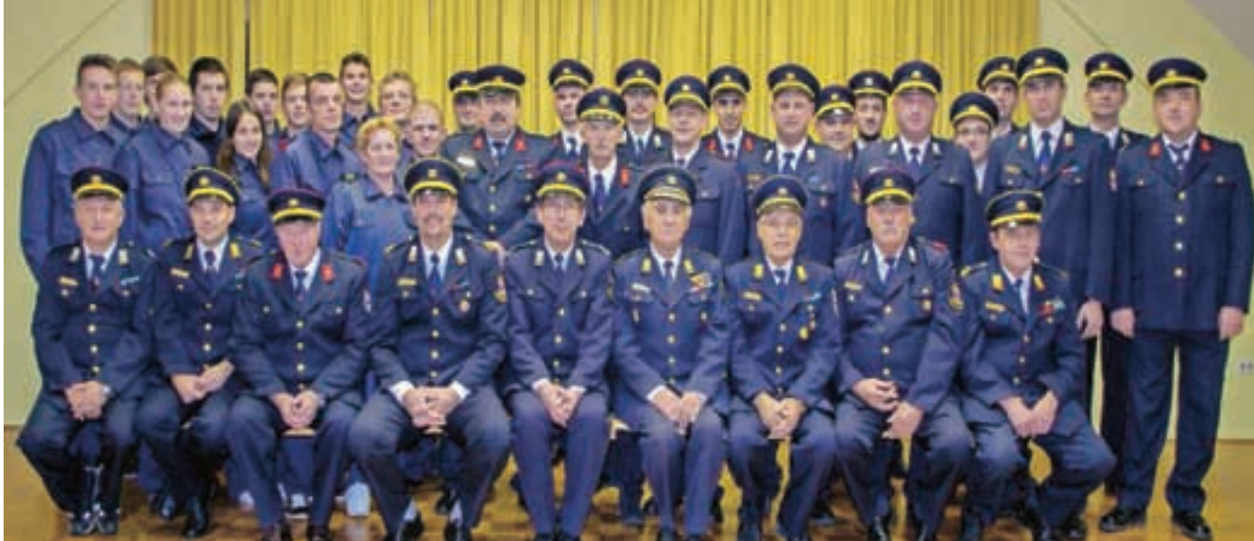
Skupinska slika članstva PGD Kranj - Primskovo