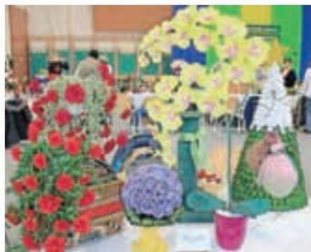
Cvetje Vedrane Golorej na razstavi na Vranskem