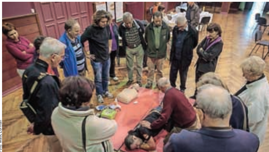
Priznanje prostovoljstva v Rdečem križu

Koronarno društvo Gorenjske je neprofitna humanitarna organizacija, ki združuje bolnike s srčno-žilnimi boleznimi in njihove svojce. Uporabniki programa so bolniki po prebolelem infarktu, z angino pectoris – srčnim popuščanjem (stabilno obdobje), po premostitveni operaciji (bay pass ali širitvi koronarnih arterij), z vstavljenimi umetnimi zaklopkami ali srčnim spodbujevalnikom, bolniki s povečanim tveganjem za nastanek srčnih bolezni (visok krvni tlak, sladkorna bolezen, debelost ...) ter njihovi družinski člani. Rehabilitacijski program zajema rehabilitacijsko vadbo (telovadbo, plavanje, pohode), psihološko pomoč in samopomoč, zdravstveno vzgojo, šolo zdravega življenja (dvakrat na leto je enotedenska celovita obnovitvena rehabilitacija v toplicah), tečaje prve pomoči