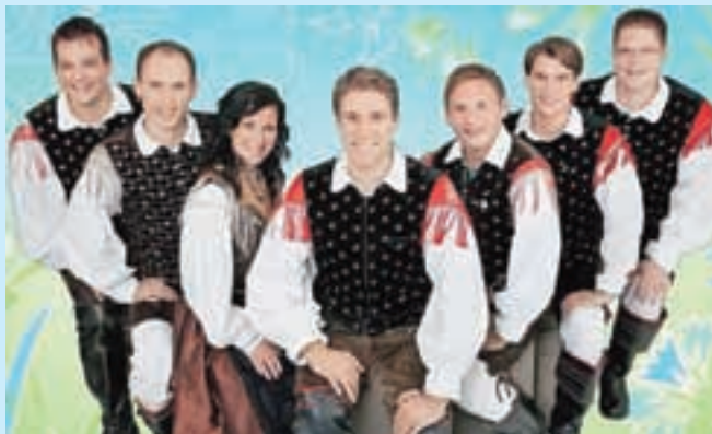
Ansambel Saša Avsenika