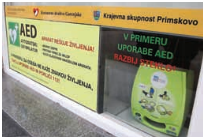
Zunanji avtomatski defibrilator (AED)

jem je samo namestitev elektrod ter sledenje navodilom. Pri tem je zelo pomemben čas, ki preteče od nastopa srčnega zastoja do začetka defibrilacije: če z njo začnemo