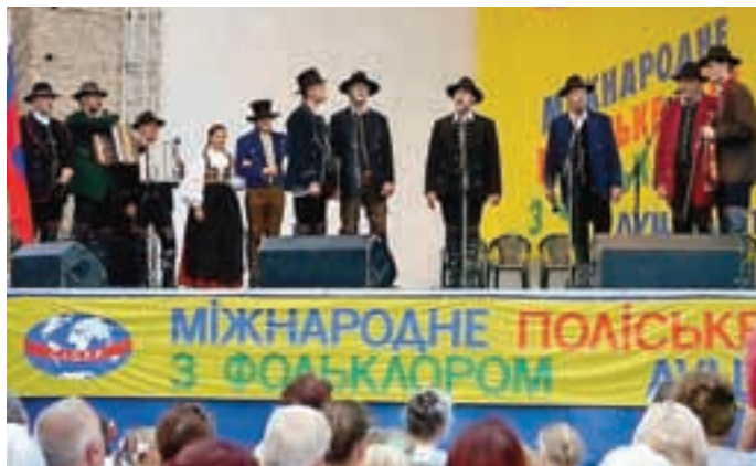
Na odru glavnega trga v Lutsku

Dva in dvajsetega avgusta se je začelo zares, trajalo pa do poznega večera 26. avgusta, ko je bila na osrednjem stadionu v Lutsku zaključna ceremonija, okrašena s pompoznim ognjemtom. Tudi sicer so bili večeri v večini zelo pozni, enkrat smo se na primer z nastopa vrnili