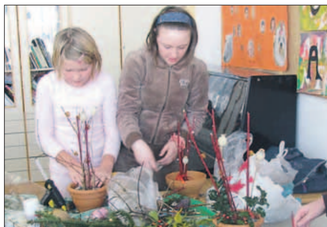
Izdelke za semenj so naredili na tehniškem dnevu.

učenci pod vodstvom svojih mentorjev. Denar od prodaje izdelkov bo, kot je še spomnil, namenjen nakupu