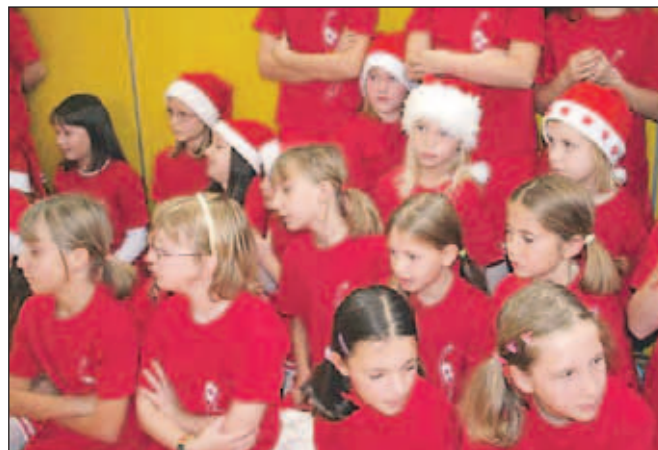
Prednovoletni semenj so popestrili nastopi učenek in učencev.