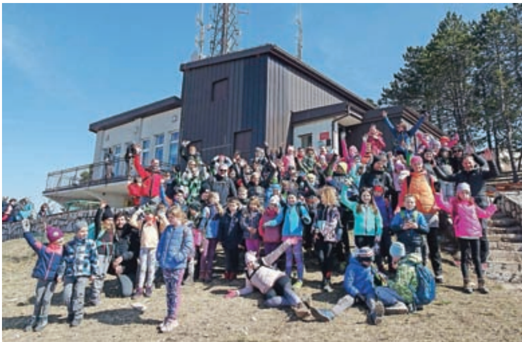
Otroci so na vrhu Slavnika uživali. Takole so se postavili za skupinsko fotografijo.

PD Medvode je eno najbolj aktivnih društev v občini. Ne skrbijo samo za poti v Polhograjskih in planinske izlete, ampak sodelujejo tudi z ostalimi društvi in tako svoje poznavanje okolja prenašajo na vse občane. Kot vsa društva si tudi v PD Medvode želijo podmladka in njihova dolgoletna prizadevanja so letos obrodila prvi sad – sodelovanje z osnovnimi šolami pri uvajanju otrok v planinarjenje. S pomočjo pristojnih na občini in aktiva ravnateljev osnovnih šol v