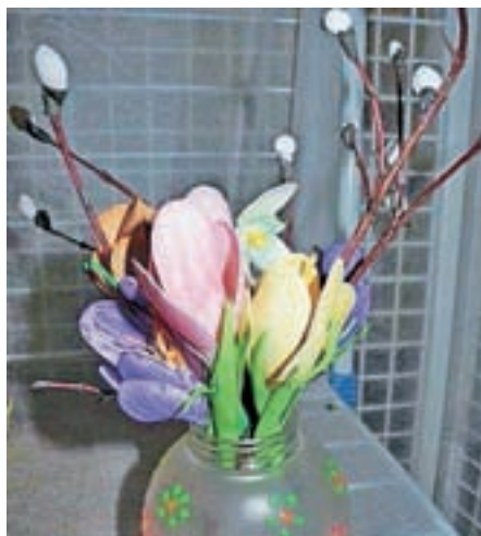
Utrinek z razstave