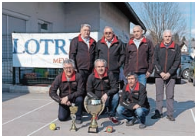
Ekipa ŠD Senica – Lotrič Meroslovje je lani osvojila naslov prvaka vseh slovenskih prstometnih lig.

Na tekmovanju za prvaka vseh lig tekmujeta po dve najboljši ekipi iz vsake lige, lani pa so bili na njem najboljši igralci ekipe ŠD Senica – Lotrič Meroslovje, ki nastopa v prvi ligi. Na Senici prstomet organizirano igrajo že enajst let, trenutno pa ga trenira 23 tekmovalcev, od katerih dve tretjini prihajata iz medvoške občine. Pravila Prstometne organizacije Slovenije določajo, da v ligi lahko igra samo ena šestčlanska ekipa iz posameznega društva, zato so igralci iz ŠD Senica prisiljeni nastopati v treh ligah. Ligaška sezona traja od pomladi do jeseni, pozimi v dvorani tekmujejo na Pokalu Slovenije in Memorialu Borisa Brezarja. Prstomet igrajo tudi v drugih državah in za pomlad slovenski prstometalci pripravljajo mednarodno tekmo na Otočcu. "V mesecu maju bo na Otočcu mednarodno tekmovanje, na katerem bodo sodelovali tekmovalci iz Italije, Avstrije, Hrvaške in Slovenije. Dogovorili smo se, da ne bomo oblikovali reprezentance, pač pa se bomo slovenske ekipe dan prej pomerile med seboj, na tekmi pa se bo s tujci nato pomerila samo najboljša slovenska ekipa,"