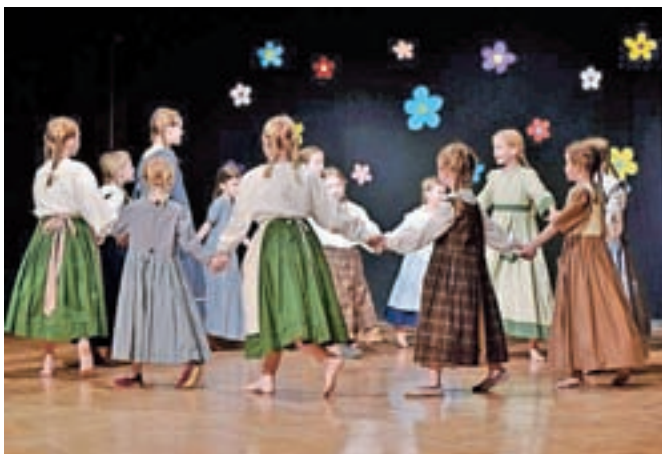
Otroške folklorne skupine KUD Oton Župančič Sora po dveletnem premoru uspešno nadaljujejo delo.

V Sori je bilo 17. marca območno srečanje otroških folklornih skupin Ljubljana okolica Ko mlinček ropoče 2022. Na njem so nastopile štiri otroške folklorne skupine, od teh tri iz domačega društva. Srečanje je bilo bolj kot tekmovanju namenjeno spodbujanju društev, da po dveletni prekinitvi zaradi koronavirusa spet začnejo delati. Uradnih rezultatov sicer še niso prejeli, so pa sorški folklorniki dobili zagotovilo, da so bili njihovi nastopi povsem na ravni pred epidemijo. V društvu pravijo, da je to glede na le tritedenske priprave lepa pohvala. P. K.