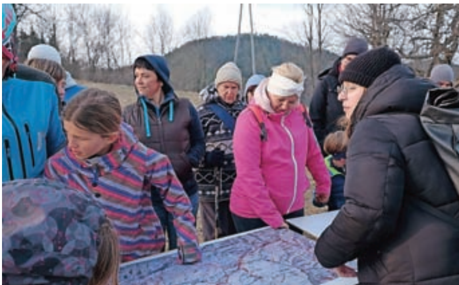
Udeleženci so na zemljevidu označili, kje na območju Krajinskega parka Polhograjski dolomiti vidijo možnost za vzpostavitev javnega prostora.

Dogodek je bil organiziran v okviru mednarodnega projekta Smoties, ki ga v Sloveniji izvaja Urbanistični inštitut (UI) RS. Ukvarja se z ustvarjalnostjo v majhnih in oddaljenih krajih, predvsem s participacijo v javnem prostoru oziroma s sodelovanjem javnosti pri urejanju javnega in skupnega dobra.