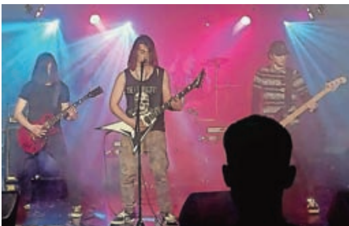
V Klubu Jedro je ponovno zaživel glasbeni natečaj BOB (Battle of Bands – Bitka bendov). V finalnem večeru 1. aprila sta se pomerili mladi glasbeni skupini Night Crawler in Life on Display. Več glasov je prejela Life on Display. S. L.