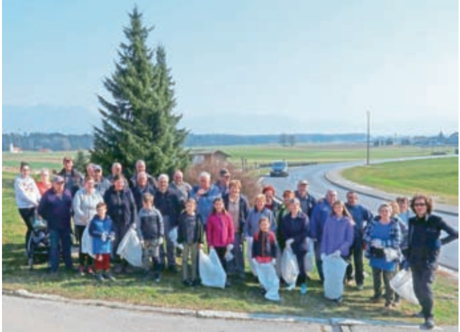
Večina udeležencev čistilne akcije v Hrašah