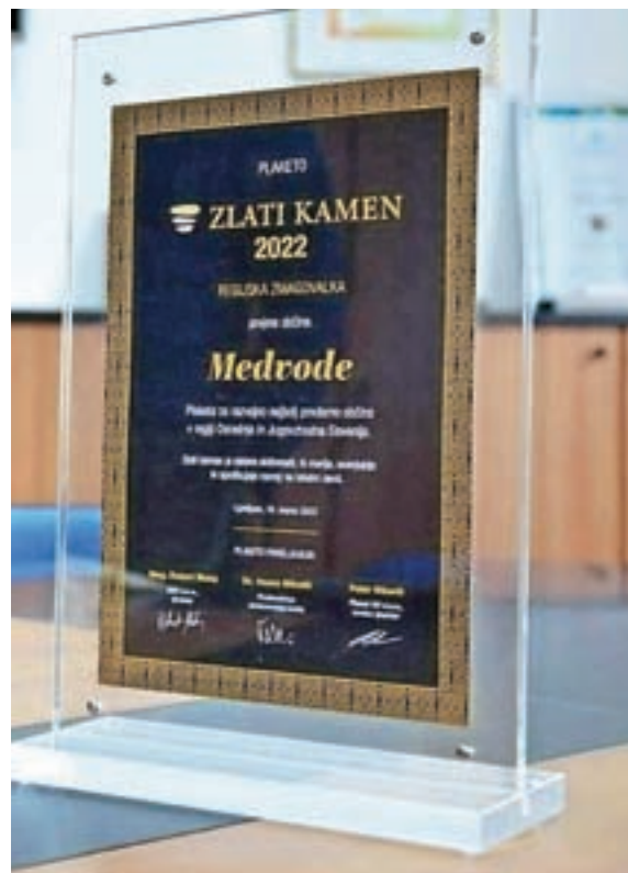
Prostore občine krasijo novo priznanje.

so se ob zaključevanju mandata posvetili analizi uresničevanja predvolilnih zavez, in kot so pojasnili, je medvoški župan Nejc Smole med najmlajšimi in je bil leta 2018 izvoljen drugič. "Njegov program je v celoti dostopen in je dokaj ambiciozen. Glavne obljube so izpolnjene, zlasti uspešna prenova in oživitve jedra kraja." Župan Nejc Smole je priznanje posvetil sodelavcem, ki niso tako izpostavljeni, a vsekakor zaslužni za razvoj skupnosti. Pred podelitvijo je sodeloval tudi na okrogli mizi regijskih finalistk, kjer je beseda tekla predvsem o velikih razvojnih projektih, s katerimi se trenutno ukvarja občina. Na konferenci je bil prisoten tudi minister za javno upravo Boštjan Koritnik. Poleg Občine Medvode so regijske zmagovalke in prejemnice priznanj za razvojno najbolj prodorne občine še Občina Ajdovščina v zahodni Sloveniji, Občina Solčava v regiji od Koroške do Posavja ter Občina Dobrovnik v vzhodni Sloveniji.