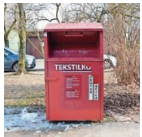
Zabojniki za odpadni tekstil so na štirih lokacijah.

umazana oblačila ter tekstil v zelo slabem stanju, ki se ne da ponovno uporabiti ali predelati. Te predmete lahko oddate v Zbirnem centru za ločeno zbiranje odpadkov Medvode. Zabojniki za odpadni tekstil so na naslednjih mestih: Zgornje Pirniče – pri OŠ Pirniče (zabojnik Tekstilko na prostoru levo od garaže), Smladnik – pri OŠ Smladnik (zabojnik Tekstilko na parkirišču za zaposlene), Medvode – pri OŠ Medvode (zabojnik Tekstilko ob stari kolesarnici) in Medvode – Zbirni center za ločeno zbiranje odpadkov (v času odprtja). Največ, približno 60 odstotkov vsebine iz tovrstnih zabojnikov, gre v ponovno uporabo.