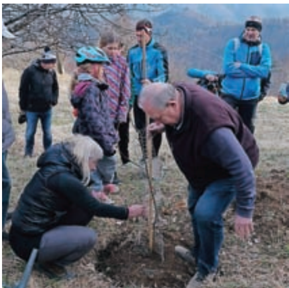
Ob Poti starih hrušk so posadili tri stare sorte dreves.