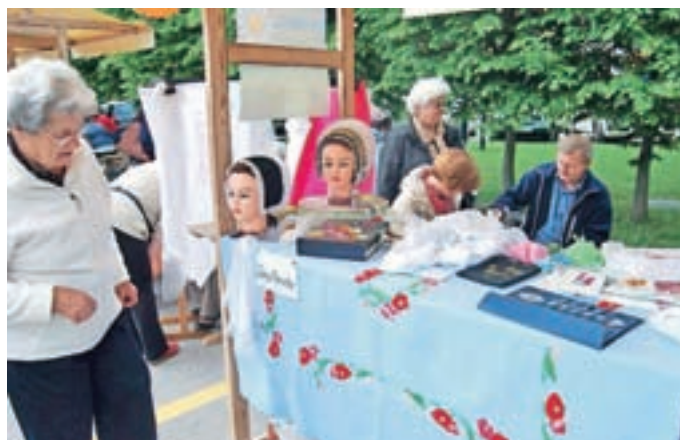
Seznani se boste lahko z različnimi znanji.