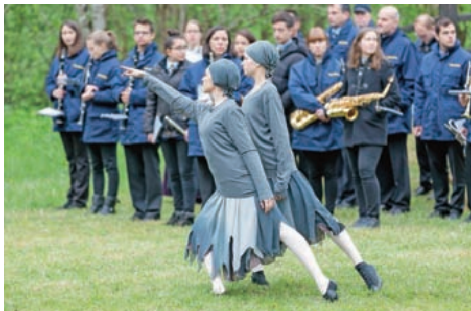
Program je povezal številna medvoška društva, organizacije in posameznike.