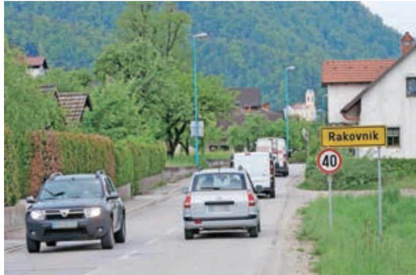
Veliko kršitev hitrosti so zaznali tudi v Rakovniku.