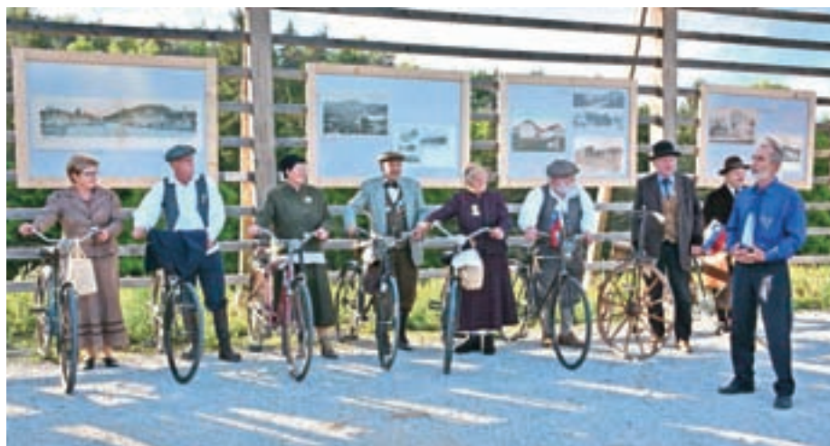
Utrinek z odprtja druge razstave v galeriji pod kozolcem v Žlebeh