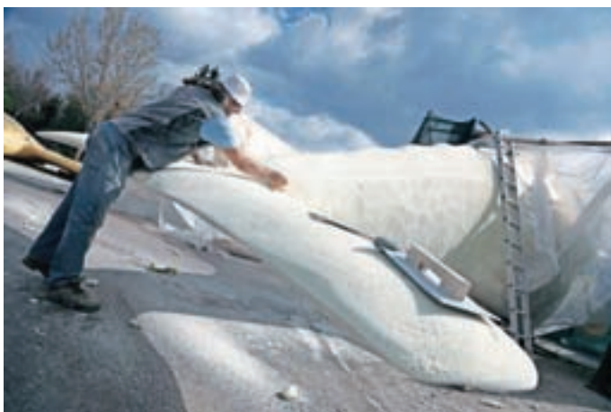
Edo Šćuk pri izdelavi enega od kitov v naravni velikosti

Edo Šćuk je bil doslej kot kipar vaje obdelovati predvsem kamen in druge naravne materiale, zato je bilo pol leta obdelovati predvsem umetne materiale svojevrsten izziv. Pa ne le to