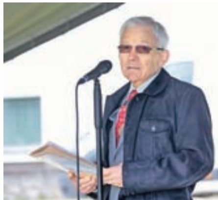
Slavnostni govornik je bil minister za kulturo Anton Peršak.