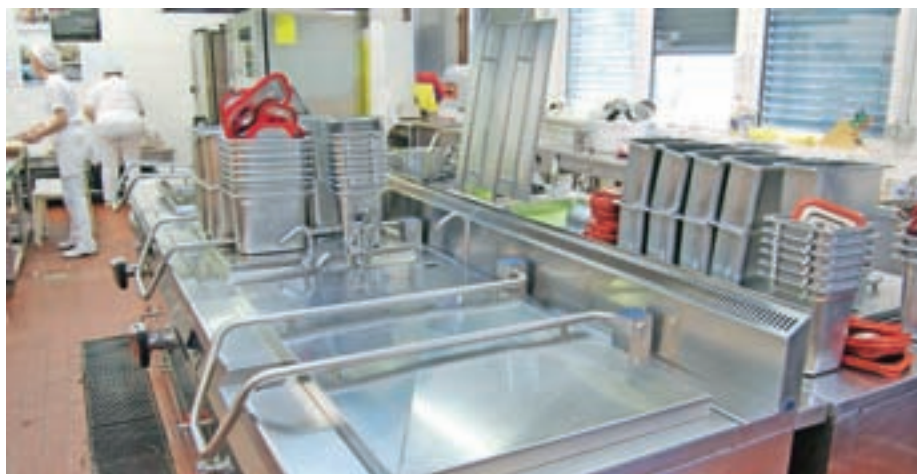
Kuhinjo, v kateri dnevno pripravijo okrog devetsto kosil, bodo celovito prenovili in nekoliko povečali.