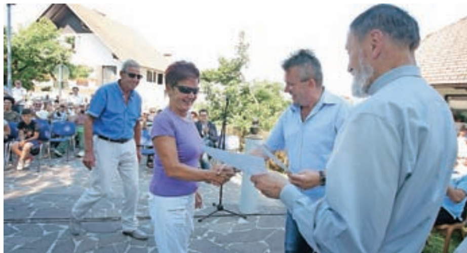
Tretji dan Vélike bésede je bila svečana akademija Gorniškega kluba Jakob Aljaž.