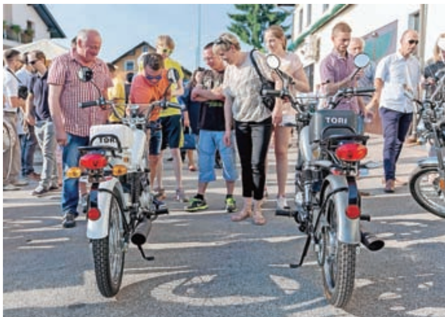
Mopede Tori so si z zanimanjem ogledali tudi obiskovalci.

Master X in Master P, ki ju sestavljajo na Senici, in povedal nekaj več tudi o načrtih: "Veseli nas, da smo v Sloveniji ponovno zagnali proizvodnjo mopeda, na katerem so tako pri nas kot v tujini pred dobrimi tridesetimi leti uživale