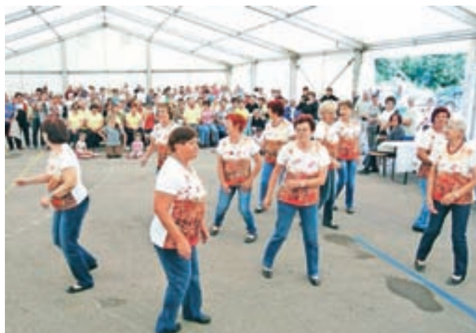
V programu so navdušile tudi Diamantke iz DU Medvode.