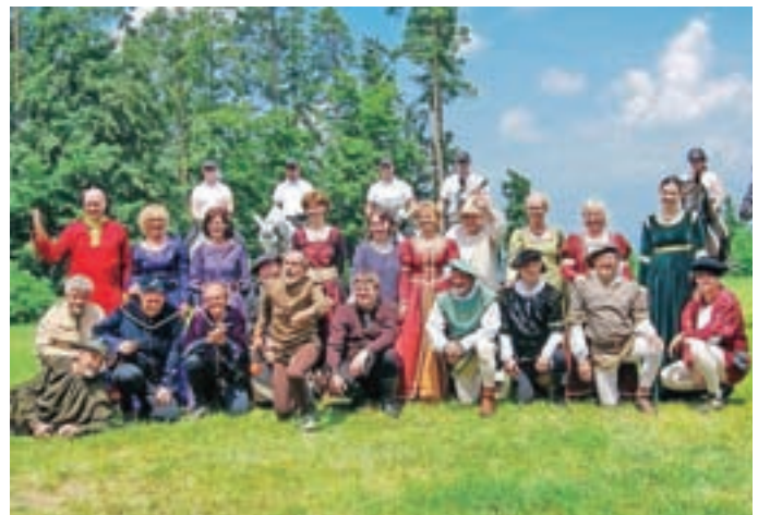
Na Pohodu po poteh z roparskimi vitezi