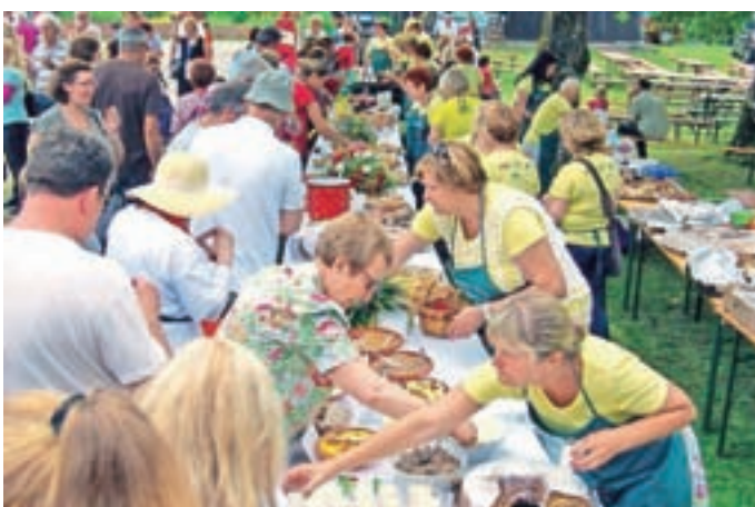
Slovenski dan v Dragočajni