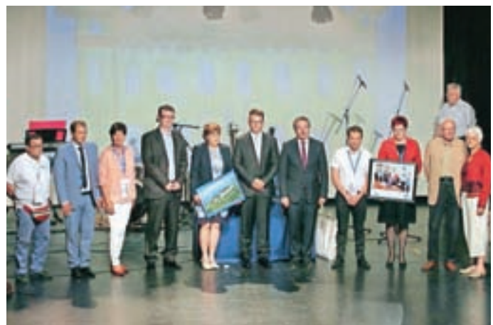
Predstavniki delegacij petih držav / Foto: Tina Dokl