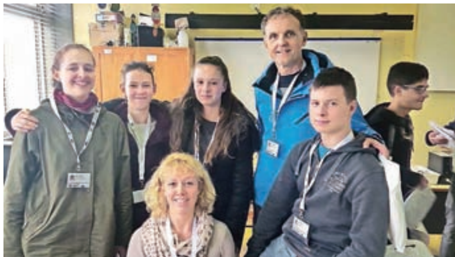
S srečanjem na Portugalskem se je zaključil projekt MO.R.E.