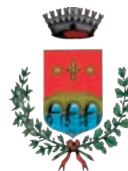
Ponte San Nicolo, Italija