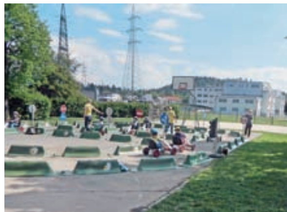
Otroci so se preizkusili tudi kot vozniki.

Pred Osnovno šolo Medvode je 3. maja potekal program Varnost in pravila v prometu za otroke iz medvoških vrtcev, ki otroke poučuje, kako se vesti v prometnem okolju, tako da so postavljeni v vlogo voznika in doživljajo dogodke, kot jih opaža in zaznava voznik v pravem prometu. Program na pobudo Sveta za preventivo in vzgojo v cestnem prometu Občine Medvode občina vsako leto izvaja v medvoških šolah in vrtcih.