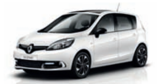
Renault SCENIC EXPRESSION TCE 115 ENERGY

Samodejna klima naprava z ločenim uravnavanjem voznik / sovoznik Brisalnika s senzorjem za dež Volanski obroč in ročica menjalnika v usnju Električni pomik prednjih in zadnjih stekel