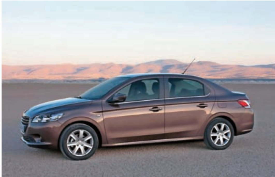
Enostavnost in gospodarnost

Ne visoka tehnologija niti ekologija niti ne zmogljivosti, gospodarnost je na prvem mestu! To je bistvo, najpomembnejša lastnost Peugeotove tristoenke. Namenjena je za daljša potovanja, je hkrati vzdržljiva in zanesljiva, se ponaša s tehnološkimi dosežki blagovne znamke, njena vsestranska uporabnost pa se vsak dan posebej izkaže za pravega aduta. Tako v mestnem središču kot na bolj težavnih cestnih odsekih se peugeot 301 po zaslugi izjemnih voznih kakovosti optimalno prilagodi razmeram na cesti. Peugeot 301 hkrati združuje izrazite stilske linije, sodobno opremo in prostorno notranjost. Če se boste odločili za novega peugeota 301, se vam ne bo več treba odločati med razumom in emocijami. Francozi pač vedno vedo, kaj sodoben voznik najbolj potrebuje. Če se vrnemo na zunanji videz. Je videti