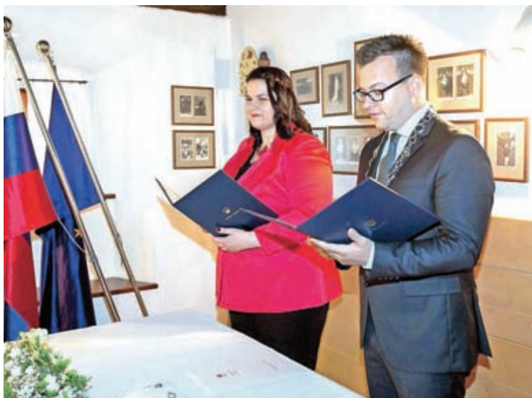
Župan Nejc Smole je opravil prvo civilno poroko.

Iz pogovora z županom: vrtec v Smledniku nov, a zahteval že kar nekaj popravil; rebalans proračuna; problematika neprofitnih občinskih stanovanj; prva električna polnilnica za avtomobile