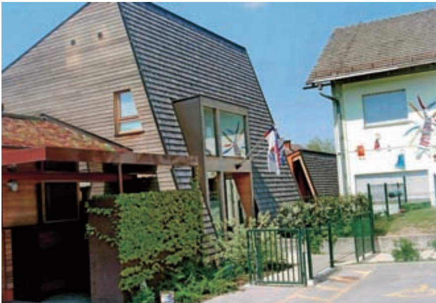
Nadzorni odbor je nadzor izvedel tudi za investicijo novega vrtca v Smledniku (levo), desno stari vrtec, ki ga še ne bodo porušili.

osem rednih sej in dve korespondenčni. Na svoji drugi seji so sprejeli program dela. Izdali so sklepe o izvedbi treh nadzorov, dva so zaključili z objavo končnega poročila, ki je dostopen na spletnem portalu občine, tretjega bodo končali še letos. V obeh nadzorih je bila nadzorovana oseba Občina Medvode. Končali so nadzor investicije vrtec Smlednik in zaključni račun občine Medvode za leto 2014. Obe poročili poleg ugotovitvenega dela vsebujeta tudi priporočila. V poročilu o nadzoru investicije vrtec Smlednik so opredelili naslednja priporočila: da se občina pri naslednjih investicijskih odločitvah odloča za tehnološko manj tvegane rešitve, da projekt pripravi z vso skrbnostjo in ga v času gradnje ne spremeni, da razpis za investicijo pripravi na način, da bo lahko izbrala zanesljivega in kvalitetnega izvajalca z referencami pri izbrani tehnologiji gradnje in da spremlja investicijo ter nemudoma upošteva priporočila in opozorila nadzornikov.