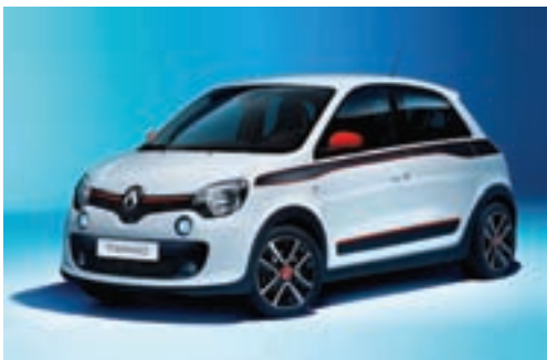
Renault TWINGO EXPRESSION SCe 70

Pokličite nas in si rezervirajte svoj termin za obisk ali testno vožnjo: 04 2015 223