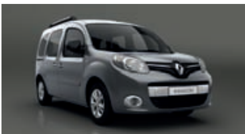
Renault KANGOO CONFORT DCI 75

Klimatska naprava Vzdolžni strešni nosilci Meglenki spredaj Radio MP3 z AUX, USB in Bluetooth vmesnikom Sredinska konzola z naslonom za roke