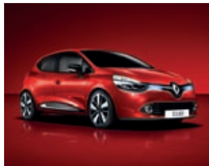
Renault CLIO AUTHENTIQUE 1.2 16V + PAKET COOL

Klimatska naprava Radio MP3 z Bluetooth + USB + AUX z upravljalnikom ob volanu Regulator in omejevalnik hitrosti Pomoč pri speljevanju v klanec LED dneвне luči