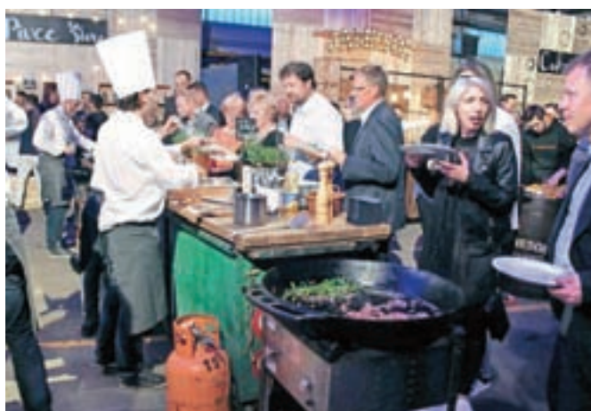
Kulinarični del garažne zabave je bil raznolik, med bolj obiskanimi pa je bil tudi kuharski kotiček z mesom in beluši.