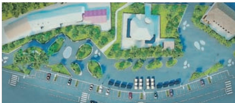
Takšen je po idejnem načrtu pogled na novo ureditev centra Medvod, območja od tržnice do stanovanjskega dela.

»Ureditev predvideva tri sklope: park, tržnico in večnamensko ploščad. Celotna ureditev je urbana, dosti je tlakovanih površin, v parku je več zelenih površin, ohranja se obstoječe drevje, osrednji motiv je talna fontana. Na tržnici je predvidena postavitev osmih lesenih hišk, dvanajstih premičnih stojnic in štirih prostorov za potujoče trgovine. Večnamenska ploščad je velika tlakovana površina, namenjena lahko tudi za javne prireditve. Smo v fazi idejnega projekta, treba je pripraviti dokumentacijo za naprej, projekt prilagoditi finančnim možnostim, da bo lahko uresničen.« Na proračunski postavki je za urejanje mestnega jedra letos zagotovljenih 105 tisoč evrov. »Projekt se bo izvajal predvidoma v treh fazah. Prva bo potekala letos, preostali dve odvisno od sredstev, ki bodo na voljo, ali v celoti prihodnje leto ali še v letu 2018. Letos so v načrtu zemeljska dela (nasutje), izgradnja komunalne infrastrukture, postavitev lesenih hišk na tržnici in urbane opreme (klopi, pitniki, stojala za kolesa),« je dejal Smole. Prebivalci so županu postavili kar nekaj vprašanj in imeli tudi pomisleke, predvsem glede poplavitve ogroženosti tega dela Medvod in oddaljenosti območja urejanja od njihovih hiš, izpostavili pa so tudi druge probleme, s katerimi se srečujejo, med drugim dovozne poti. Dogovorili so se, da se prihodnjik glede projekta dobijo kar na terenu in začrtajo odmike od stavb.