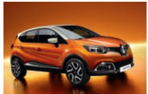
Renault CAPTUR EXPRESSION ENERGY TCe 90 STOP&START

Klimatska naprava Radio MP3 z Bluetooth + USB + AUX z upravljalnikom ob volanu Kartica Renault Platišča iz lahke litine 16" Meglenki spredaj