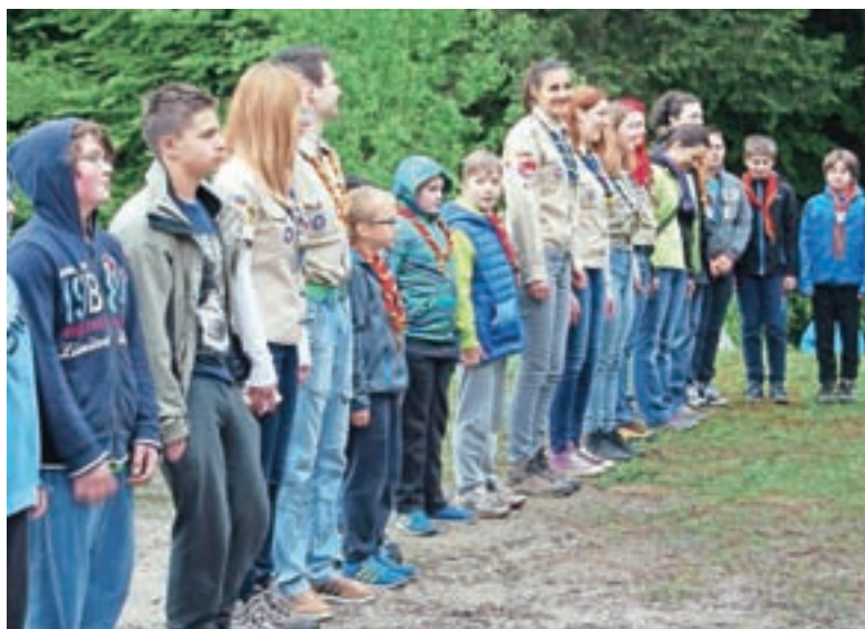
V Društvu tabornikov Rod dveh rek Medvode je več kot sto članov.