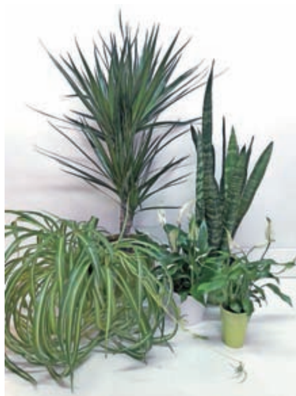
Zelenčica (spodaj levo) v družbi zmajevke, taščinega jezika ter spatifila

rastišču zalivamo močneje kot na hladnem. Od marca pa vse do septembra pa z rednim tedenskim dognojevanjem rastline spodbujamo k bujnejši razrasti ter razvoju lepših zdravih listov. Zelenčice presajamo šele takrat, ko koreninski sistem toliko zraste, da rastlino "dvigne" iz premajhnega lončka. Zelenčice najlažje in najhitreje množimo z mladikami, ki nastanejo na pritlikah starejših rastlin. Ko vidimo, da je mladika že dovolj razvita, jo ločimo od matične rastline in njen spodnji del položimo v kozarec z vodo, kjer se zelo hitro razvijejo dovolj močne korenine, da jih lahko posadimo v zemljo. Četudi je njena vzgoja zelo nezahtevna, se včasih zaradi zares slabe nege na rastlinah razvijejo listne uši, ki se jih kaj hitro ubranimo z najrazličnejšimi pripravki proti insektom. Zaradi zimskega gnojenja med prezimovanjem na pretoplih mestih in pomanjkanja svežega zraka postane rastlina premehka, tako da se ji listi lomijo in cefrajo. Tako rastlino prestavimo na bolj zračno in svetlo mesto.