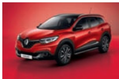
Renault KADJAR LIFE ENERGY TCE 130

Klimatska naprava, LED dneвне luči Sistem za pomoč pri zaviranju v sili Regulator in omejevalnik hitrosti Električni pomik stekel spredaj 4 varnostne blazine + 2 varnostni zavesi