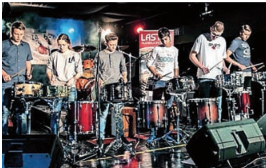
Mladi bobnarji so ponovno navdušili.