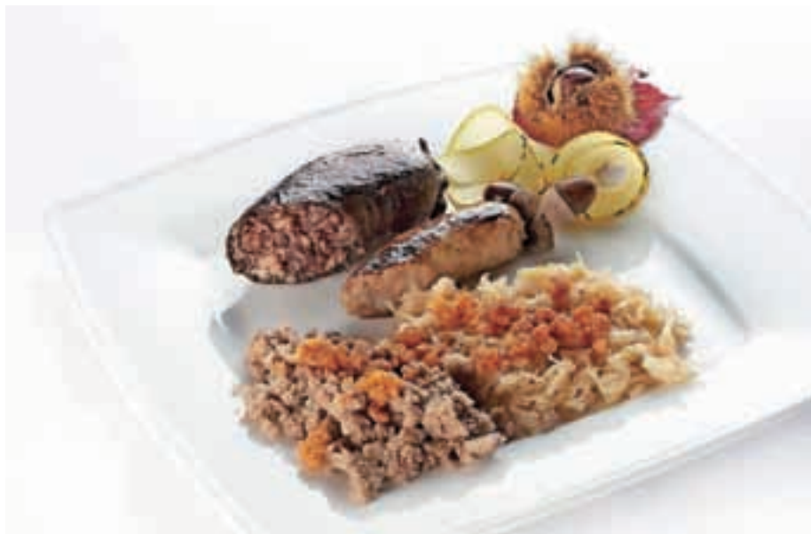
Šest hodov v treh gostilnah. Ponudba je odvisna od sezone.

»Pred kratkim smo Kulinarično popotovanje po medvoških Gostilnah Slovenije predstavili na prvem kulinaričnem festivalu v Celju. Z odzivom smo lahko zelo zadovoljni. Obiskovalcem se je projekt zdel zanimiv, pravzaprav nekaj novega. Ni novo, da ponujamo meni s šestimi hodi, novo je to, da ga pojedete v treh različnih gostilnah.«