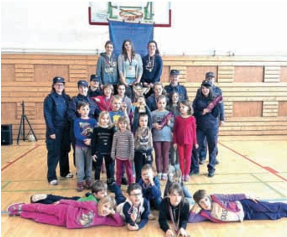
Prehodni pokal so osvojili mladi gasilci iz PGD Sora.