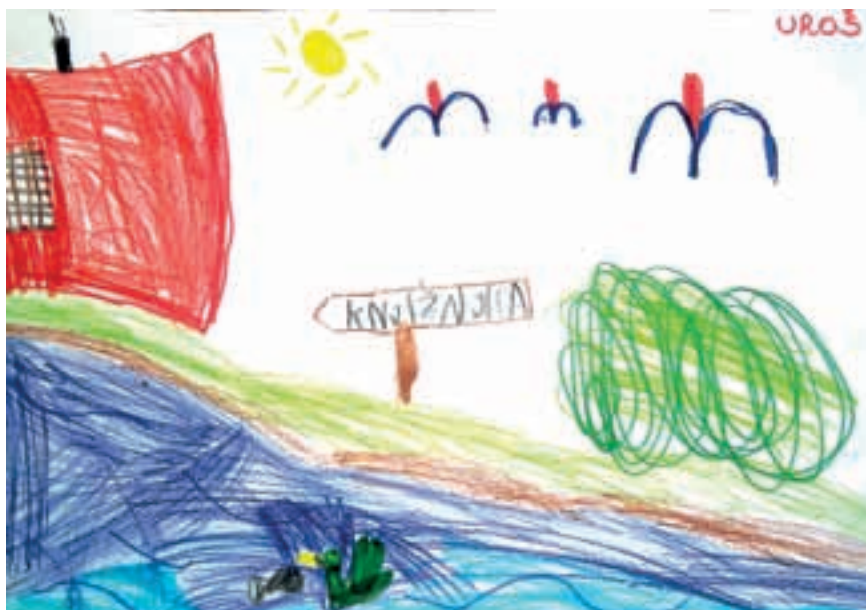
Uroš Milunič, star 9 let in 7 mesecev