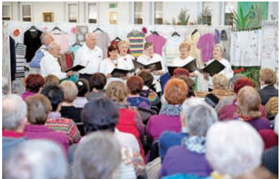
Skupina Sončna jesen s petjem in glasbo popestri dogodke, ki jih pripravljajo v društvu.