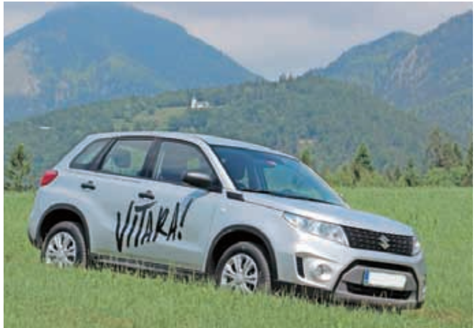
Osnovni model res obstaja!

Vsepovsod nas obveščajo o novih avtomobilih, marketinški prijem se vedno začne z najnižjimi cenami in ne konča z najvišjimi za posamezen predstavitveni model. Namenoma smo iskali avtomobil z osnovno ponudbo in osnovno ceno. Največkrat se zgodi, da stopimo v prodajalno in takega avta sploh ni. Rečemo si, da sploh ne obstaja, in trgovci jih sploh ne naročajo. Tokrat smo se ušтели. Našli smo točno to, kar smo iskali. V ceniku piše, da vitara stane 14.500 evrov, in hoteli smo jo videti. Dobili smo jo celo za