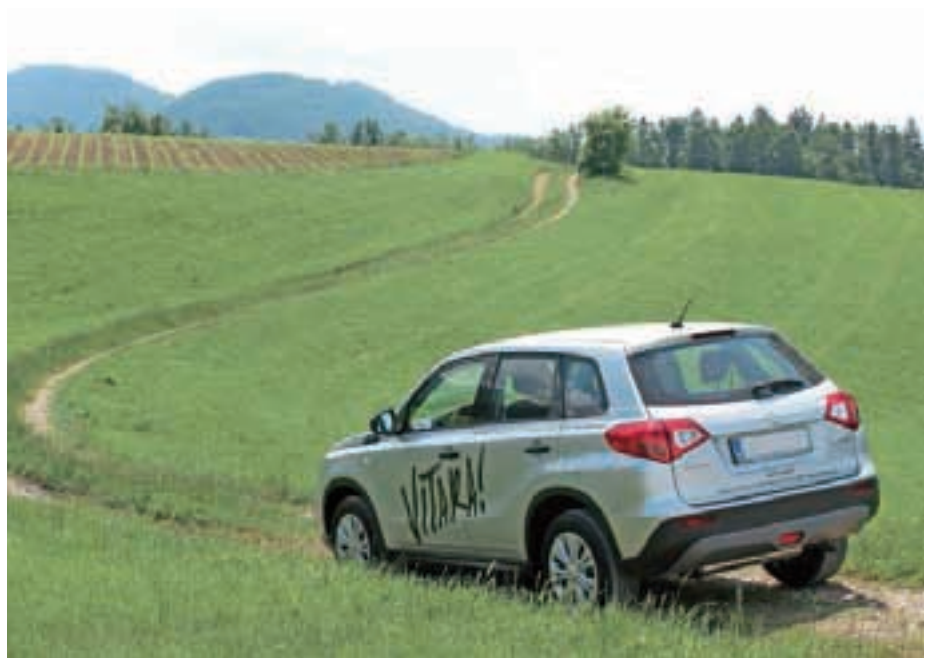
Vladar slabih cest