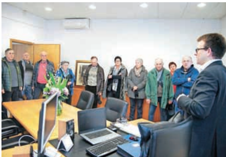
Župan je občane popeljal po celotni občinski upravi. Ustavili so se tudi v njegovi pisarni.