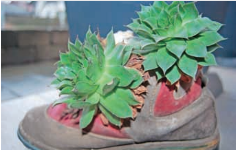
Netresk – sok te rastline za pomoč pri bolečem ušesu pa tudi kod dekoracija