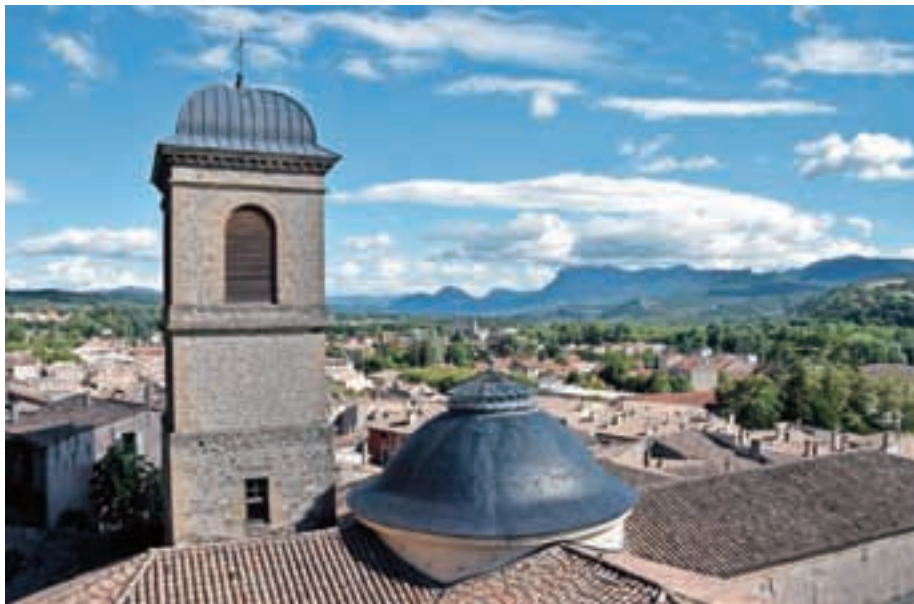
Pogled na mesto Crest

V tokratnem kotičku vam na kratko predstavljamo mesto Crest, s katerim je občina Medvode že pobratena in od koder v mesecu juniju pričakujemo večje število gostov. Naselje in občina Crest (izg. Kre) se nahaja v osrednjem delu doline reke Drome, 25 km jugovzhodno od mesta Valence v jugovzhodnem