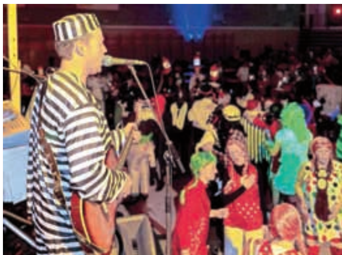
Domen Kuralt, pevec skupine Calypso, kot zapornik