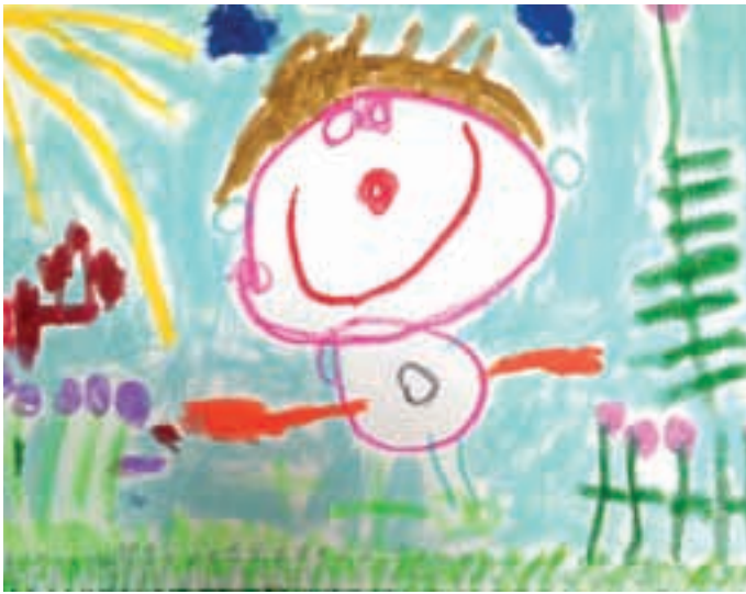
Ula, 4 leta