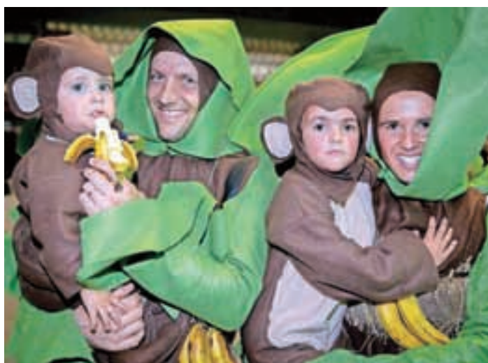
Palmi z opicama