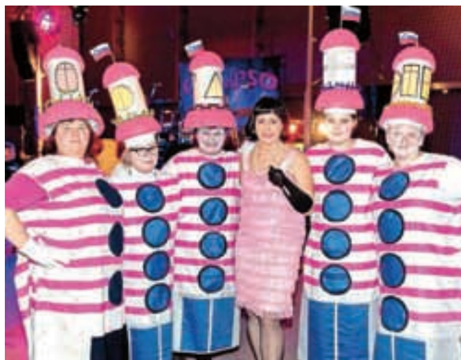
Svetilniki iz Škofje Loke