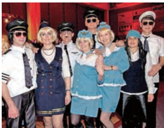
Piloti in stewardese iz Žlebov