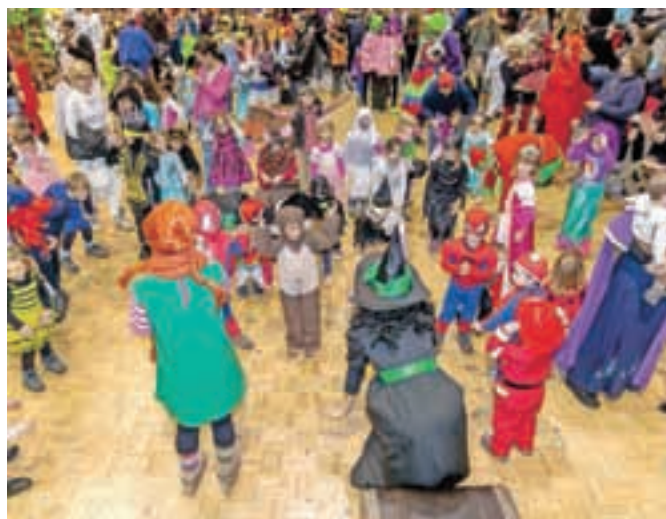
Zabava v družbi Pike Nogavičke, zlobne čarovnice in nerodnega škrate