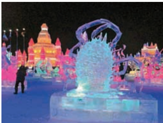
Ledena skulptura morskega pajka, ki je nastala na Kitajskem.

Bil je sploh prvi Slovenec na festivalu na Kitajskem. "To je izjemno velik festival, primerljiv morda s svetovnim prvenstvom v carvanju na Aljaski. Ledeni snežni park naredijo v Harbinu na reki na dveh otokih. Vse skupaj je v velikosti Medvod. Na primer ledeni stolp je višji kot nebotičnik v Ljubljani, snežena katedrala je večja od ljubljanske stolnice. Sodelovalo je 27 ekip, razglasili so tudi najboljše. Naš cilj za prvič je bil predvsem uspešno narediti dve ledeni skulpturi in eno snežno. Uspeli smo in za nas je to kot zmaga. Skulpture so bile tehnično izredno zahtevne. Izdelali smo morskega pajka z desetimi nogami, vsaka je bila sestavljena iz štirih členov, vsak od teh je bil posebej odrezan v led in potem zlepljen skupaj. Če si predstavljate, te noge so bile dejansko v zraku. Pri nas v teh pogojih to fizično sploh ni izvedljivo. Tam je bilo, saj so bile temperature tudi 25 stopinj pod lediščem," je povedal. Navdušen je bil že ob prihodu, ko je videl plapolati slovensko zastavo, pa tudi po koncu festivala. "Najbolj pomembno je samo druženje z najboljšimi izdelovalci ledenih in snežnih skulptur iz celega sveta. Vidiš veliko različnih tehnik, kako vsak po svoje obdeluje led, veliko orodja, poleg tega je pomemben tudi osebni stik, da se povezujemo, pogovarjamo. Ne gre samo za uvrstitev, gre za učenje. Šele naslednje leto, če