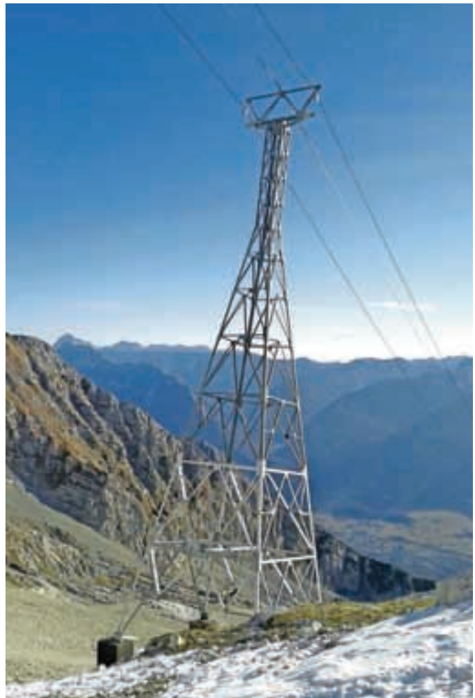
Obnova Kanina

"Na Fakulteti za strojništvo sem redni profesor in vodja laboratorija za konstruiranje LECAD. V sklopu laboratorija je dvajset zaposlenih. Polovico sodelavcev je pedagoških pol raziskovalnih, torej na trgu. Delamo izjemne projekte: od fuzijskega reaktorja, programiranje na super računalnikih do srčne črpalke in inovacij, ki so praviloma patentirane."