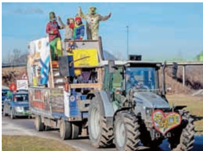
Pustna vožnja po Medvodah: C(m)erar in njegovi klovni

V Športni dvorani Medvode je tudi letos v organizaciji Javnega zavoda Sotočje potekalo dvodnevno pustovanje. Za zabavo je v soboto skrbela skupina Calypso, v nedeljo pa Godba Medvode, Tak Tik in Marcela In. Pustne šeme so prišle od blizu in od daleč ... V soboto zjutraj pa so se iz Zbilj na pustno vožnjo po občini podali iz Društva za ohranjanje vaških običajev.