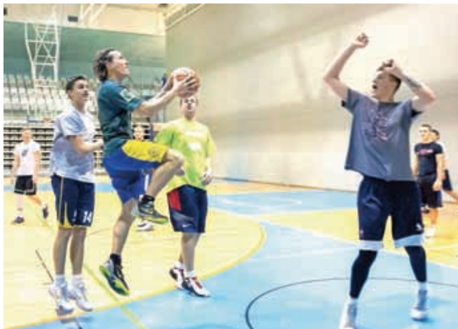
Članska ekipa KK Medvode se pripravlja na zadnje tekme prvega dela tekmovanja.

Medvoški košarkarji so na lestvici po desetih krogih v 3. ligi center na drugem mestu. Sedemkrat so zmagali, vknjižili en poraz, dva kroga so bili prosti. Vodilna ekipa Union Olimpija mladi ima devet zmag in je brez poraza. V ligi je sedem ekip. Ker je zadnje uvrščena Metlika izstopila iz lige, imajo zagotovljeno še zmago več. K njim bi morali iti na gostovanje v naslednjem krogu. Pred njimi so tako le še tri tekme prvega dela tekmovanja. 24. januarja bodo doma igrali z Enos Jesenicami, 30. januarja imajo pomembno tekmo pri Olimpiji mladi, v zadnjem krogu pa bodo 3. februarja igrali doma proti Calcit Basketballu. "Ne glede na to, da smo najmanj drugi, pa tekma z Olimpijo mladi ni nepomembna. V nadaljnje tekmovanje za napredovanje v drugo ligo gresta dve ekipi tako iz tretje lige center, vzhod kot zahod. Pomerili se bomo z vsemi, le z Olimpijo ne več. Oni v nadaljevanje že ne-sejo eno zmago, ki so jo dosegli proti nam,