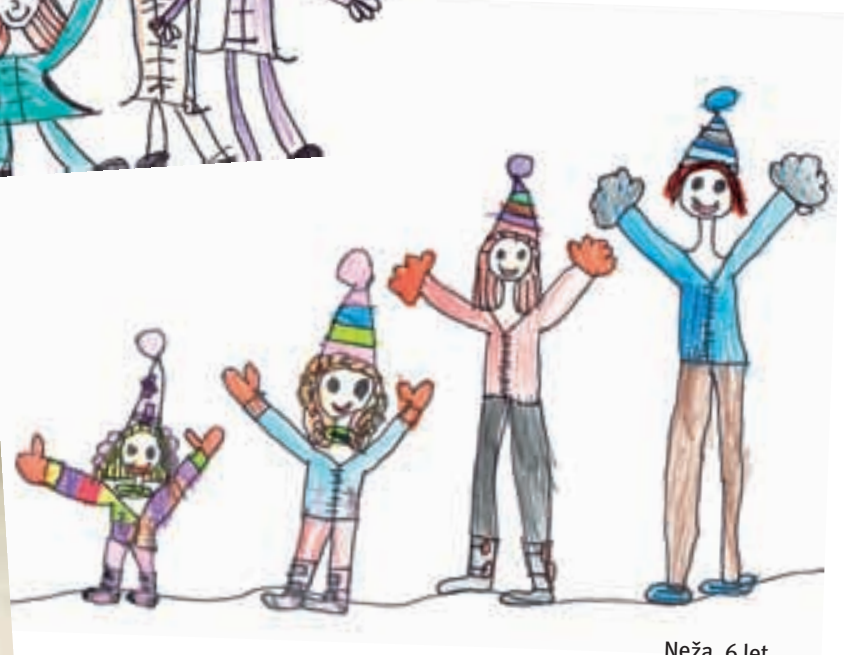
Neža, 6 let