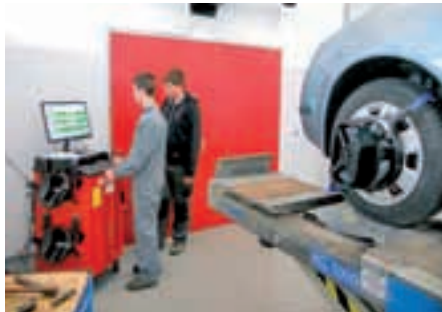
AVTOREMONTNE DEJAVNOSTI avtoserviser, avtokaroserist, avtoservisni tehnik (pti)