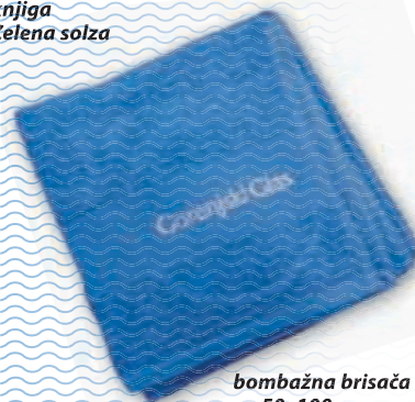
bombažna brisača 50x100 cm

Popust in darilo veljata le za fizične osebe. Daril ne pošiljamo po pošti. Količina daril je omejena.