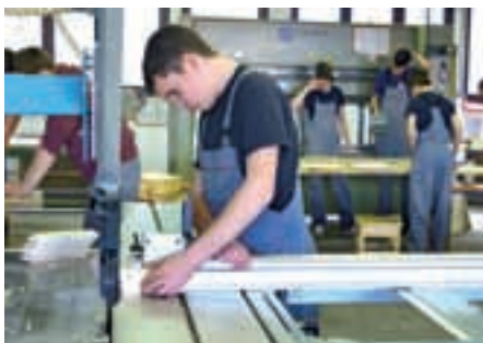
LESARSTVA mizar, tapetnik, lesarski tehnik, lesarski tehnik (pti), obdelovalec lesa