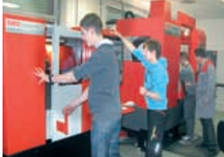
STROJNIŠTVA oblikovalec kovin-orođjar, inštalater strojnih inštalacij, pomočnik v tehnoloških procesih, strojni tehnik in strojni tehnik (pti)

Starši so danes zelo obremenjeni, na eni strani z ohranitvijo lastne zaposlitve, na drugi strani pa s prihodnostjo svojih otrok. Vsi si želimo, da bi bili naši otroci uspešni, zadovoljni, da bi dosegli čim višjo stopnjo izobrazbe in bili s tem dobro materialno preskrbljeni. Tisti, ki bolj sledimo tokovom izobraževanja in zaposlovanja, vidimo, da danes to ne drži več, saj je brez zaposlitve vse več akademsko izobraženih mladih ljudi, ki so v študij vložili ogromno časa in truda, po drugi strani pa primanjkuje ljudi s poklicnimi znanji in sposobnostmi, od katerih je odvisno naše vsakodnevno življenje. To so poklici, ki bodo že jutri našim otrokom zagotavljali zaposlitev, dober življenjski standard in spoštovanje. Starši imamo svoje ambicije, ki smo jih uresničili, ali pa ne. Otroci imajo svoje ambicije in starši bi jim morali dovoliti, da jih uresničijo, jih spodbujati pri njihovih poklicnih odločitvah in jim trdno stati ob strani, četudi bodo morda včasih drugačne od njihovih. Dejstvo je, da je vsak posameznik sposoben velikih dosežkov, le odkriti mora, na katerem področju je najmočnejši. Izbira prave srednje šole je torej odločilnega pomena za prihodnost vsakega učenca. V Šolskem centru Škofja Loka edini na Gorenjskem izobražujemo za deficitarne poklice s področij: