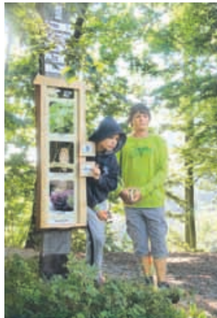
Pot vodi mimo dvaindvajsetih tabel, na vsaki je fotografija drevesa, živali in rastline.