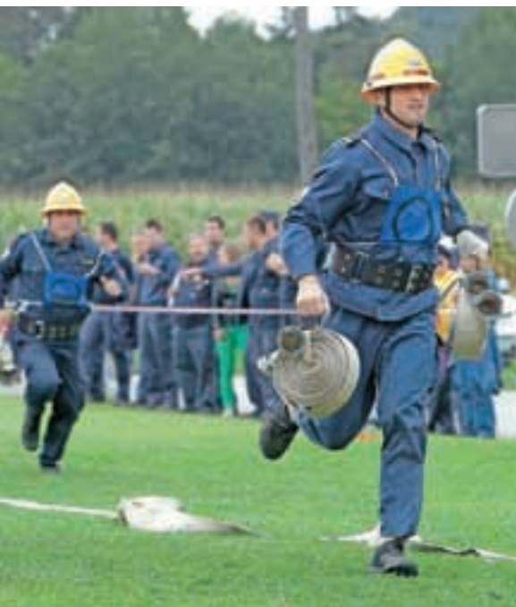
Kot zadnji so se na tekmovanju GZ Medvode pomerili člani.

našala niti živinska kuga, ki je pomorila precej živali, s katerimi so kmetje obdelovali zemljo. Obupne razmere so kar klicale po uporju; voditelji so sklenili, da je treba jezne kmete združiti čim prej, predno se poleže razburjenje. Uprli so se in uspeli. Na odprtju so poudarili, da so bili kmečki upori velik kazalnik složnosti med ljudmi; takrat so bili pozabljeni vsi spori in vse osebne zamere, ljudje so stopili skupaj. Lahko bi celo rekli, da so bili kmečki upori zametek bratstva, svobode in enakosti. Dogodek ob odkritju kipov je potekal v organizaciji Krajevne skupnosti Smlednik.