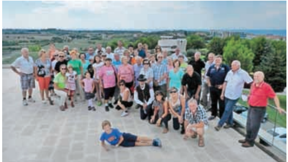
Člani TD Pirniče v Savudriji