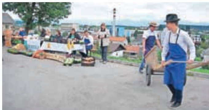
Ko vaško jedro oživi: tradicija, prepletana s sedanostjo