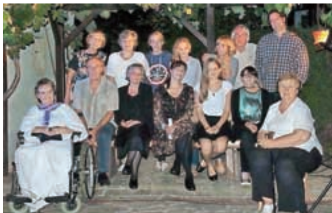
Literati ter ostali člani KUD JaReM pod Aljažovo trto