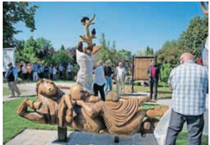
Umetniki so kipe odkrili sami.

Kmečki upori so se sicer na Smledniškem dogajali v letu 1515, a se niso končali vse do leta 1848, ko je končno prišlo do zemljiške odveze, kmetje pa so postali svobodni. Kar osemdeset tisoč se jih je bojevalo proti lakoti, nepoštenemu plačevanju davkov in nepravilnosti. Kmetom pa v tistem času ni priza-