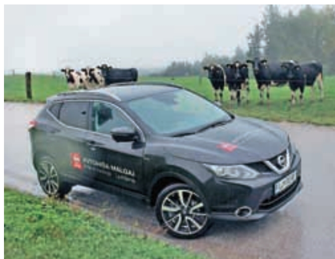
"Publika" je obnemela.

Druga vožnja z najbolje prodajanim nissanom v Evropi je bila težko pričakovana. Končno sem lahko občutil, kako je uspelo nadaljevati uspešno zgodbo prve generacije avtomobila, ki so ga naši vozniki zelo lepo sprejeli. Qashqai. Kar nekaj let je že minilo od vožnje z novincem na naših cestah. Če se spomnim slabih deset let nazaj, ko sem se prvič srečal z avtom, ki nosi ime turškega naroda, živečega v hribovju jugovzhodnega Irana, se mi je zdel odličen za mestno vožnjo. Seveda gre za vozilo, ki ga ljubkovalno kličemo "SUV", vendar se nam je vsem, ki smo ga preizkusili, zdelo, da ga je kar nekako škoda za brezpotja. Že takrat je bil "prelep", eleganten, bolj za mestni promet kot pa grobo makadamkanje. Spomnim se še "afere", ki je krožila med vozniki qashqai. Če si nepozorno izgovoril ime, si slišal "cash cow", kar pomeni "molzna krava", ki je bankirski žargon za poslovno dejavnost, ki ustvarja stalen dobiček! Torej nekaj zelo dobrega, kajne? Vmes smo vozili še model qashqai, ki je imel zgolj lepotne popravke, pač skladno s časom, v katerem živimo. Druga uradna različica je zdaj tu. Avtohiša Malgaj iz Ljubljane nam ga je posodila za daljši test, zato z veseljem sporočam, da ga bomo v celoti objavili v naslednjih dveh številkah Sotočja.