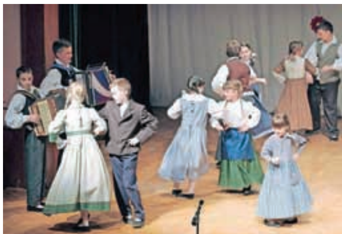
V Sori so se predstavile tri domače otroške folklorne skupine.