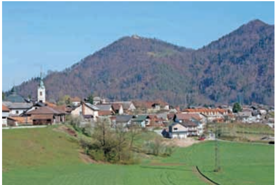
Projekt, ki se je začel leta 2010, vključuje tudi gradnjo kanalizacijskega omrežja v Verjah, Sp. in Zg. Pirničah in delu Vikrč.