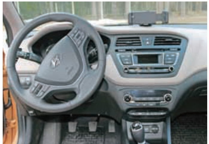
Vse je pri roki in nič ne moti.