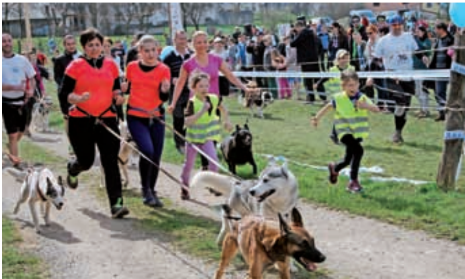
Del prireditve je bil tudi netekmovalni tek s kužki.