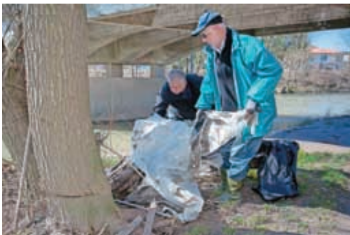
Tudi v centru Medvod se je nabralo kar nekaj odpadkov, ki kazijo podoba kraja.