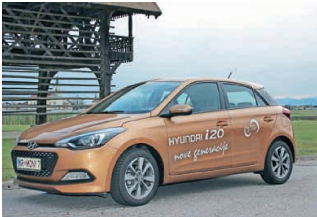
Hyundai i20, druga generacija

Druga generacija avtomobila Hyundai i20 je povsem spremenjen model vozila, ki spada med največje v svojem razredu. Priznati je treba, da ima vsakdo, ki prvič sede vanj, občutek, da ta avto spada v razred recimo golfa, megana, focusa, vendar ni tako. Novi model Hyundai i20 pripada razredu, v katerem so polo, clio, fiesta. In ravno to je prvo presenečenje. Hyundaijeva dvajsetica je večja in širša od predhodnice in nasploh povsem spremenjena. Notranjost in zunanost so izdelali Nemci oziroma novi »Pininfarina« med oblikovalci Peter Schreyer. Vozili smo model 1,4 CVVT Premium, v katerem pravzaprav nisem prav ničesar pogrešal. Kvalitetno izdelano armaturo opazimo najprej. Ne duha in sluha o plastiki, vse je konkretno oblazinjeno in daje udobno mehko. Volan spada med najudobnejše, kar jih lahko dobimo v