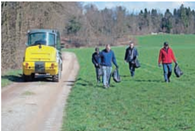
Odpadki se čez zimo naberejo tudi na travnikih. Pobirali so jih v Hrašah.

Medvode – Zadnjo soboto v marcu je v večjem delu občine potekala akcija Spomladansko urejanje okolja. Odziv je bil dober, ker pa akcija še ni končana, med drugim bodo jutri, 11. aprila, obrežje rek Sore in Save čistili člani Ribiške družine Medvode, bomo o končnih številkah udeležencev in zbranih odpadkih poročali v majski številki Sotočja. Tokrat pa nekaj fotografskih utrinkov z glavne akcije 28. marca.