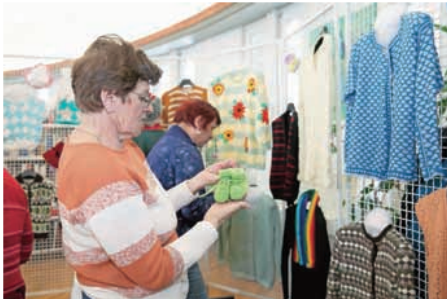
V Knjižnici Medvode je do 22. aprila na ogled razstava ročnih del Društva upokojencev Medvode.