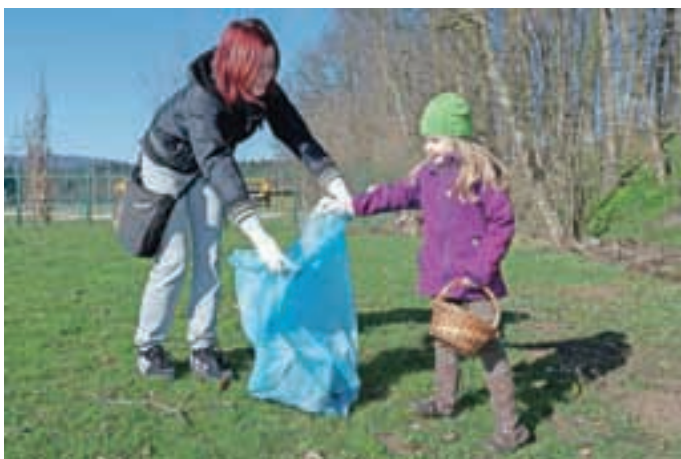
V Zbiljah je odziv na akcijo vedno dober. Krajanji znajo stopiti skupaj.