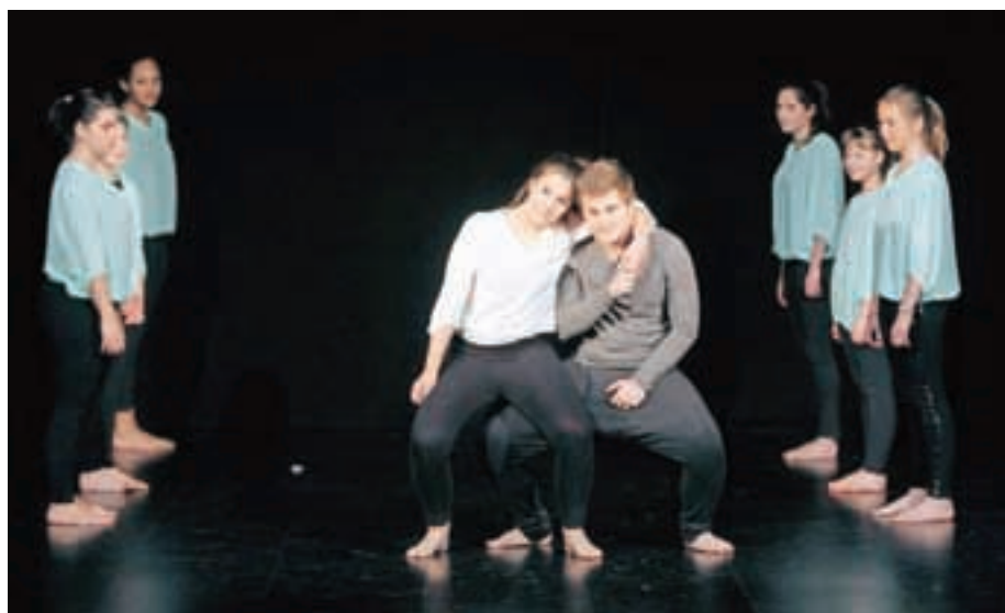
V Kulturnem domu Medvode so pripravili območno plesno revijo Plesni mozaik.

Na plesni reviji območnih izpostav Javnega sklada za kulturne dejavnosti (JSKD) Ljubljana okolica in Vrhnika v Kulturnem domu Medvode je zaplesalo 12 plesnih skupin.