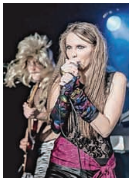
Fatal Passions na odru Kluba Jedro