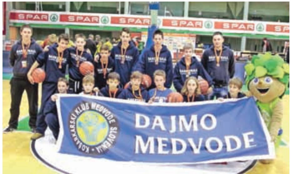
Zgodovinski uspeh mladih košarkarjev

V senci tega uspeha pa nas je poklical direktor Košarkarskega kluba Medvode in nas opozoril na odločitev občine Medvode, ki bo drastično zmanjšala finančna sredstva na področju športa in kulture. "Bojim se, da ne bo denarja niti za dvorano. Medvoški košarki se obetajo težki časi," je dejal kapetan članske ekipe in direktor Košarkarskega kluba Medvode