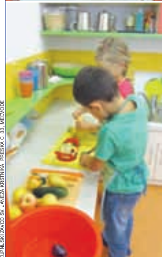
ZUPNISKI ZAVOD SV. JANEŽA KRSTNIKA, PREŠMA G. 33, MEDVODE