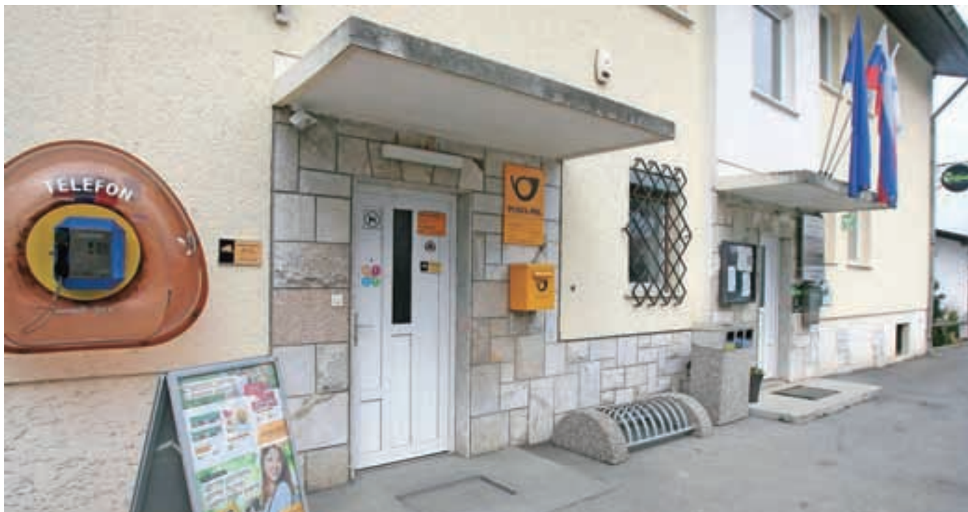
Pošto v Smledniku nameravajo preoblikovati v pogodbeno pošto.

Pošta Slovenije namerava še letos smledniško pošto preoblikovati v pogodbeno, po nekaterih informacijah pa naj bi jo v roku enega do dveh let celo zaprli, kar bi bil hud udarec predvsem za starejše prebivalce.