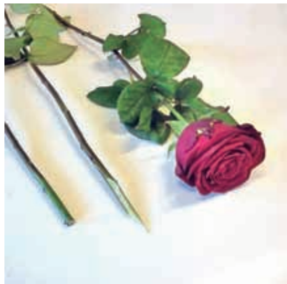
Na levi je prikaz napačno spodrezane vrtnice, v sredini pa je prikazan pravilni rez z nožkom.

je vrtnica takoj po nakupu povabila cve-tove. V tem primeru cele namočimo v toplo vodo za približno eno uro, da se cele napijejo. Nagelj kot rezano cvetje ni zahteven, tako da ga lahko odreže-mo s škarjami ali nožkom, obstojnost pa mu lahko povečamo tako, da hladni vodi dodamo nekaj kapljic Varikine. Tako tudi vode ni treba menjati vsak dan. Tulipan velja za cvetlico s kratko življenjsko dobo, ki mu jo podaljšamo s pravilno oskrbo. Stebla tulipanov odrežemo z nožkom ter v malo hladne vode (približno 4 centimetre) dodamo bakrene cente, ki preprečujejo razvoj bakterij. Sončnica in hortenzija imata najraje toplo vodo, saj ima v stebelu nekakšno belo "peno", ki v stiku s hladno vodo zakrknje in pri tem voda ne pride do cveta. Vodo jim menjamo vsak dan in jim vsakič osvežimo rez z nožkom.