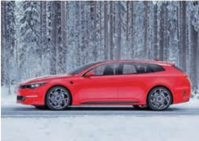
Karavan malce drugače

Kia je na ženevskem avtomobilskem salonu pokazala dva povsem nova modela.