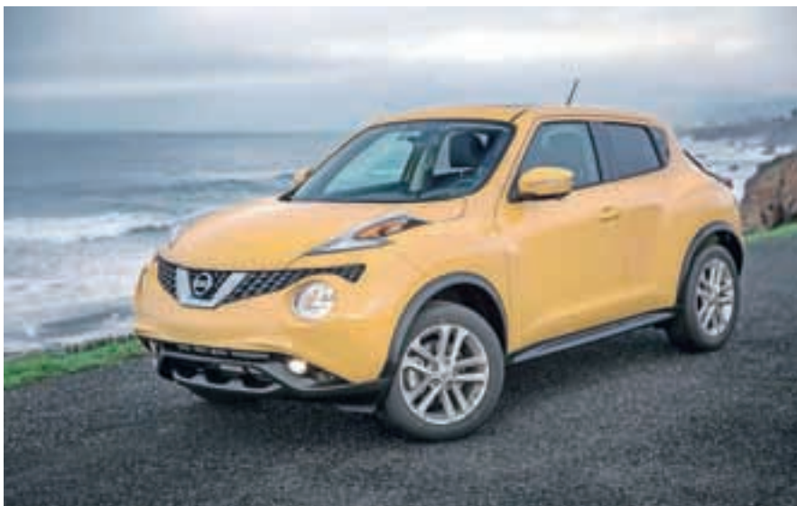
Novi juke je komaj kaj drugačen od starega.

Nekateri avtomobili so tako originalni, da sprememb nikoli ne potrebujejo. V avtomobilski industriji je napak glede tega kar nekaj. Spomnimo se Volkswag-novega beetla, ki je dobil tretjo, nepotrebno različico, minijev, ki so dobili kup nepotrebnih različic, in Fiatove petstotke, ki je prav tako dobila posodobitve, ki jih nismo pričakovali. In vendar je kapital sveta vladar in če se svet