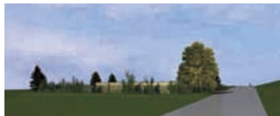
Zbirni center nenevarnih odpadkov na Jeprci bodo intenzivno ozelenili, da se bo čim bolj vklopil v okolico.