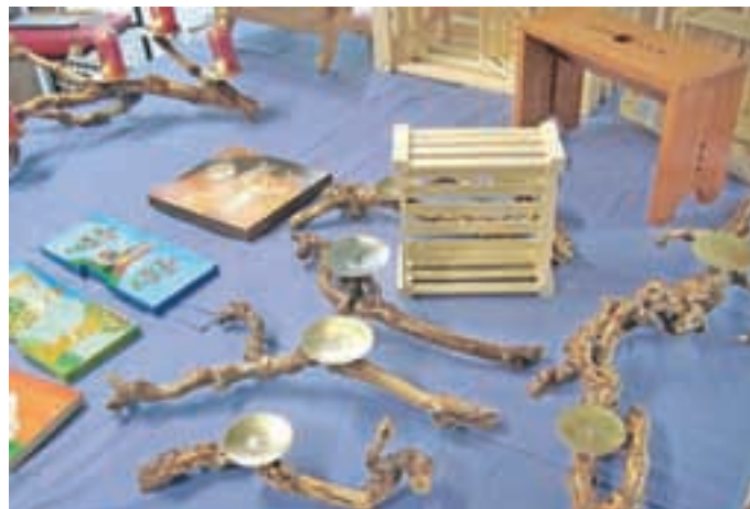
Zlasti zanimivi so bili svečniki iz vinske trte.

Zbilje – V delavnicah Barke so se tamkajšnji zaposleni ves november še zlasti trudili s svojimi izdelki. Konec novembra so jih namreč ponudili na Miklavževem sejmu, ki so ga pripravili kar v prostorih delavnic. Ogljedati in kupiti je bilo mogoče izdelke, ki so nastali pod rokami 18 delavcev v okupacijski, lesni in gozdarski delavnici. V kuharski delavnici pa so pripravili slane piškote za pogostitev na sejmu.