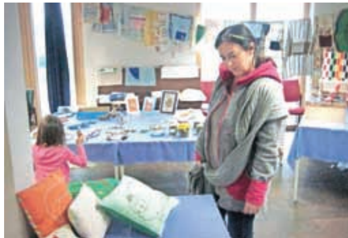
Okrasne blazine gredo dobro v promet.