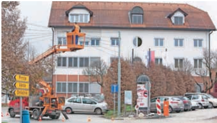
V središču Medvod so v minulih dneh napeljali praznično osvetljava, ki jo bodo prižgali danes.

Središče Medvod so v minulih dneh že odeli v praznično okrasje, ki bo zažarelo na današnjem prižigu luči. S tem bodo na simboličen način zaznamovali uvod v pestro decembrsko dogajanje.