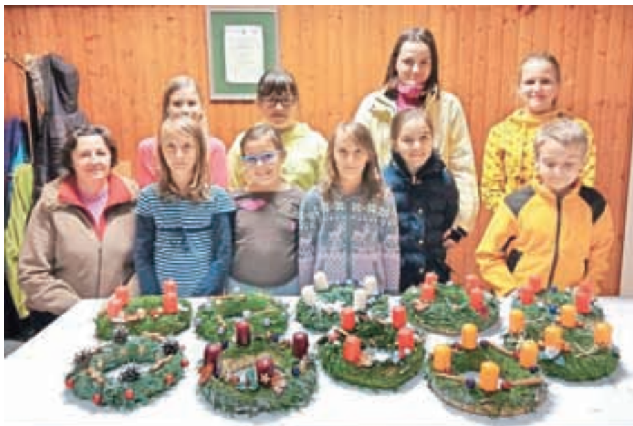
Adventne venčke so s ponosom pokazali tudi otroci, ki so se njihovega izdelovanja lotili v delavnicah na Senici.