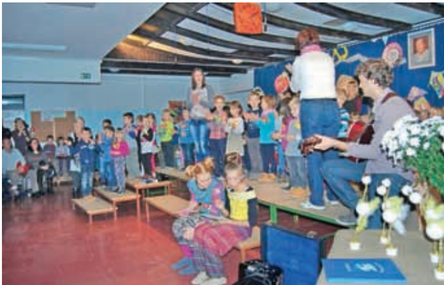
Bitenčeve pesmi so letos prepevali najmlajši.