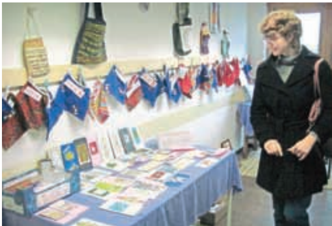
V delavnicah Barke so konec novembra pripravili Miklavžev sejem.

V delavnicah društva Barka v Zbiljah so drugo leto zapored pripravili Miklavžev sejem.