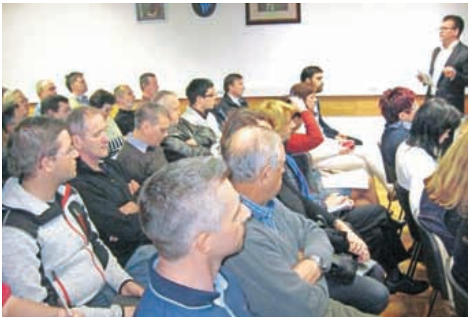
Torkovega srečanja z občinsko upravo se je udeležilo več kot sedemdeset članov svetov in tajnikov vaških in krajevnih skupnosti.