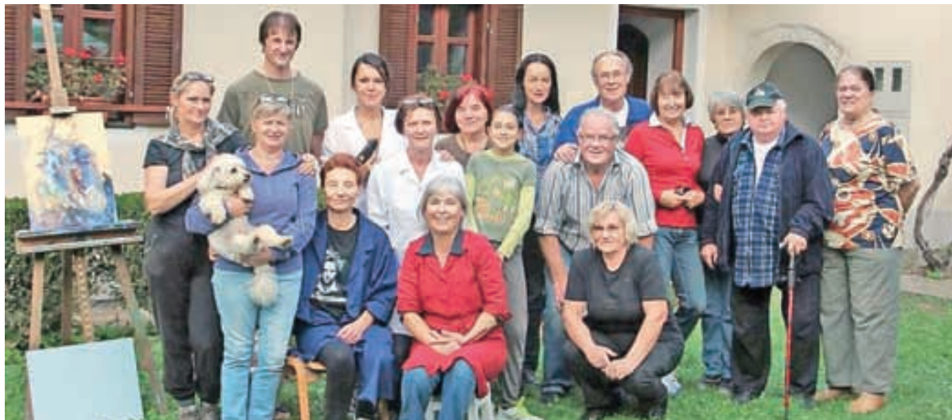
Udeleženci likovne kolonije na Aljaževini

Četrtega oktobra je v rojstni hiši Jakoba Aljaža v Zavrhu potekalo slavnostno odprtje likovne razstave Bakhusovo žuborenje.