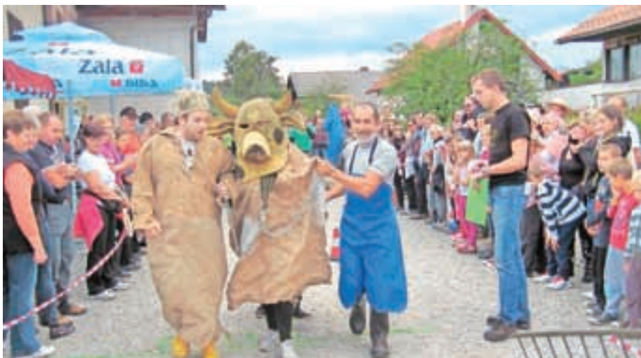
Z dirko telet ohranjajo spomin na vaško legendo o beraču in teletu.

Seveda pa tudi letos niso manjkale dirke s teleti, s katerimi ohranjajo vaško legendo o