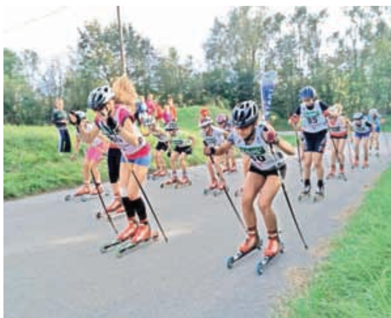
Kdor je dober poleti, je tudi pozimi.