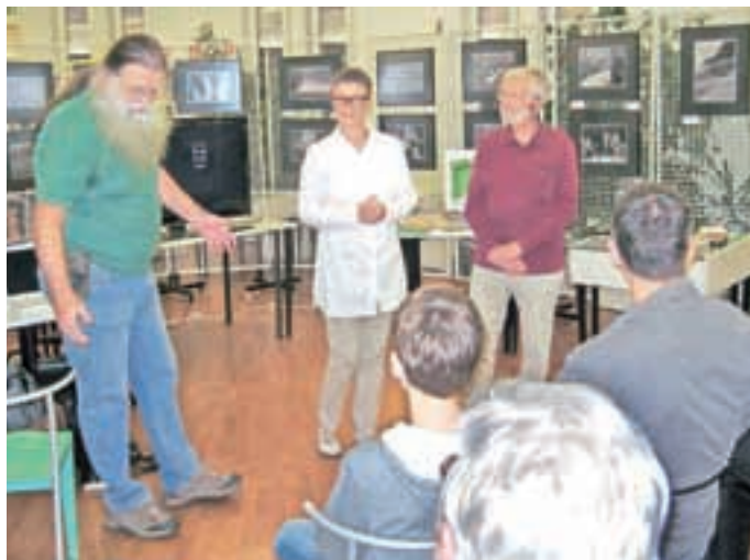
V knjižnici Medvode so v septembru pripravili prvega v nizu domoznanskih večerov.