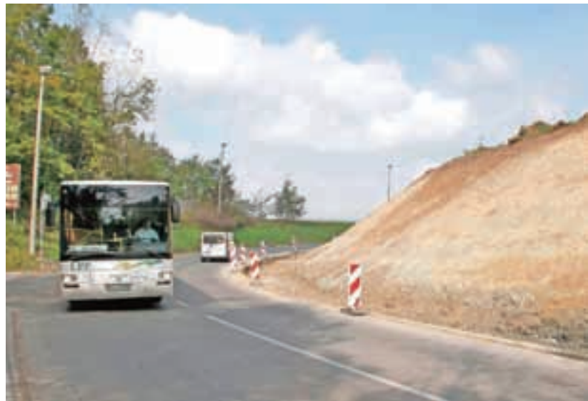
Ob cesti Zbilje–Smlednik gradijo hodnik za pešce.