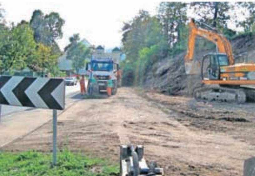
V Medvodah obnavljajo cesto proti Verju.