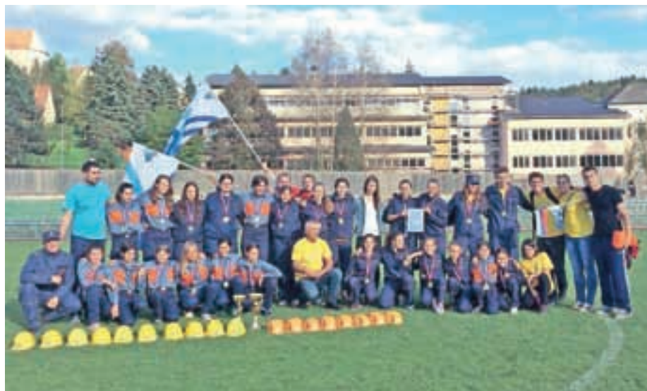
Na izbirnem tekmovanju za mladinsko olimpijado so gasilke iz Zbilj in Sore osvojile prvo in drugo mesto.

»To je zagotovo eden največjih uspehov, ki