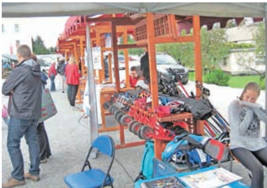
Na športni tržnici so svojo dejavnost predstavila različna športna društva.

tudi na prostoru pred stojnicami. »Nameravali smo postaviti tudi igrišči za nogomet in tenis, a nam je dež to onemogočil,« je pojasnil Svoltjšak. Kljub temu so se lahko otroci preizkusili v nekaterih športih, kot recimo teku na smučeh s kolesci. Potapljaško društvo pa je predstavitev svoje dejavnosti popestrilo s pripravo škampov in školjk, ki so jih razdelili obiskovalcem. Čeprav je slabo vreme pripomoglo k temu, da obiskovalcev ni bilo veliko, pa so bili v društvih zadovoljni, zato podobne prireditve načrtujejo tudi v prihodnjih letih. Mateja Rant