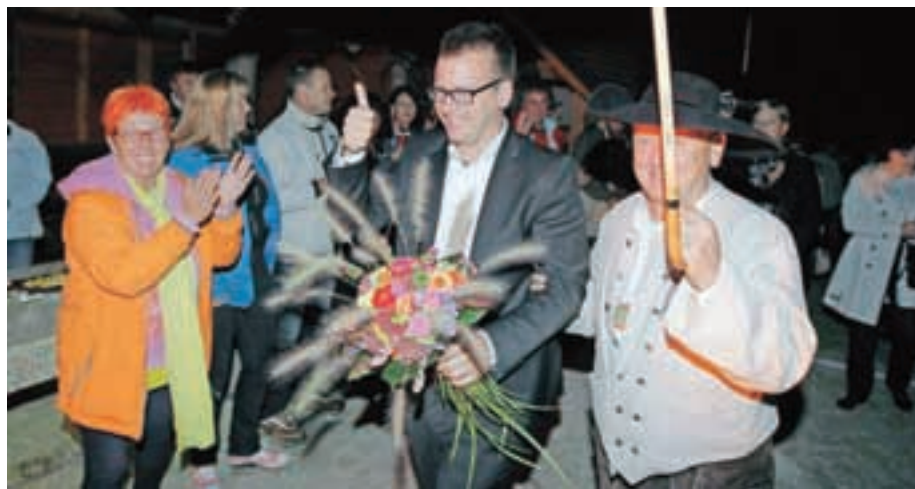
Njegovi podporniki so mu v nedeljo po volitvah na Starem gradu v Smledniku pripravili prisrčen sprejem.