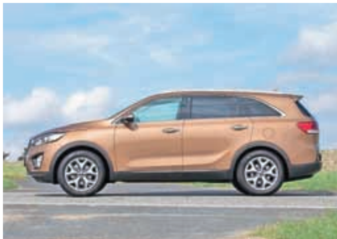
Tretja generacija Kiinega velikana

listov. Pri novem sorentu so snovalci uporabili številne stilistične podrobnosti z lanskoletnega koncepta kia cross GT, kot so pokončna maska, ki spominja na tigrov nos, ter nazaj zategnjeni žarometi in profil. Pod sorentovim vitkim profilom in bolj zaobljenimi površinami se skriva tretja generacija vozila, ki potnikom ponuja bolj luksuzno kabino z občutno kakovostnejšimi materiali. Odvi-