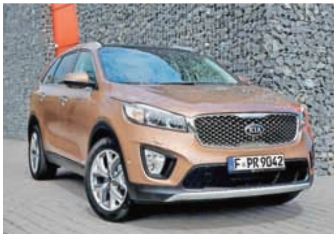
Več luksuza je bilo prvo vodilo pri nastajanju novega sorenta.