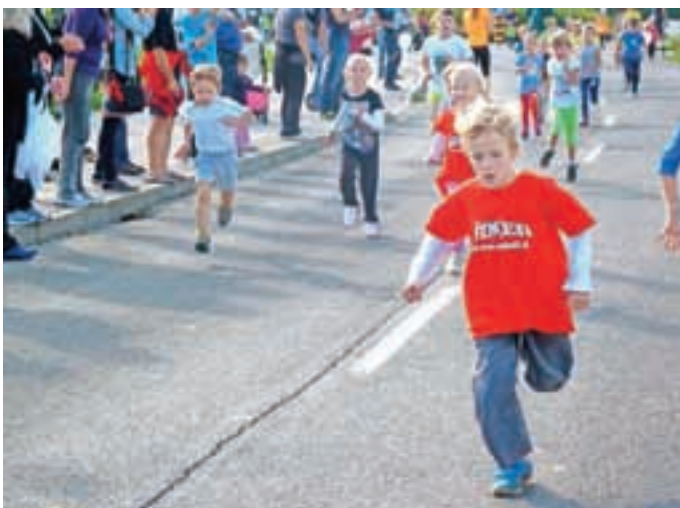
Najprej so se na Vzajemkov tek podali najmlajši tekači.