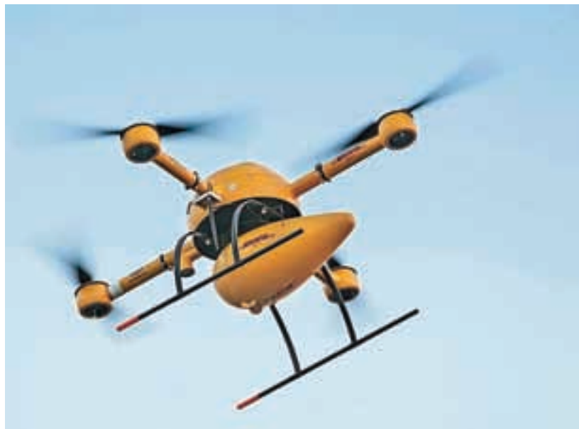
Nekoč bo takle »helikopter« tudi nam prinašal pakete.