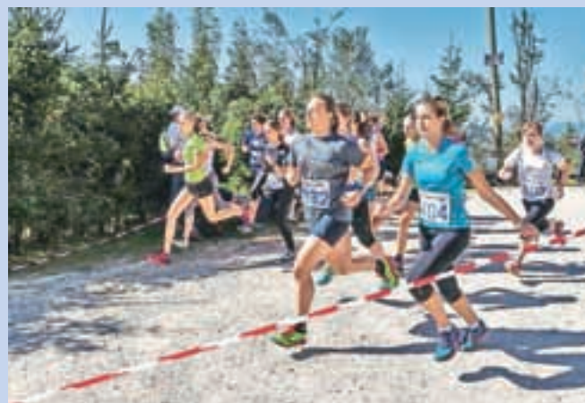
Dijakinje v boju za zmago

Za osvojitev naslova najboljšega gorskega tekača osnovnih in srednjih šol iz cele Slovenije je bilo potrebno priteči do Starega gradu nad Smednikom. Letošnje tekmovanje, ki je potekalo v soboto 27. septembra, je za razliko od lanskega potekalo v zelo prijetnem jesenskem vremenu. V tekmovalnem delu se je na progo podalo več kot 140 učencev in učenek ter petdeset dijakov in dijakinj. Osnovnošolci so tekli na 1,6 km dolgi progi, srednješolci pa na 2,2 km dolgi progi. Pred njimi so se na nekoliko krajši razdalji v promocijskem teku s progo spopadli še učenci in učenke od 1. do 5. razreda. V ekipni razvrstitvi je v kategoriji učenek zmago slavila OŠ Sava Kladnika Sevnica, pri učencih pa so si največ toč pritekli fantje iz OŠ Stranje. V kategoriji dijakinj so zmagale tekačice z gimnazije Bežigrad, v moški kategoriji pa so bili najboljši dijaki z Gimnazije Idrija. Državni prvaki so postali: Anže Gros (OŠ France Prešeren Kranj), Maja Per (OŠ Brdo Lukovica), Jakob Mali (OŠ Jakoba Šuštarja), Karin Gošek (OŠ Sava Kladnika Sevnica). Državni prvaki med srednješolci so postali: Matevž Planko (Gimnazija in SŠ R. Maistra Kamnik), Anja Mandeljc (Gimnazija Jesenice), Ana Čufer (Škofijska gimnazija Vipava). M. B. C.