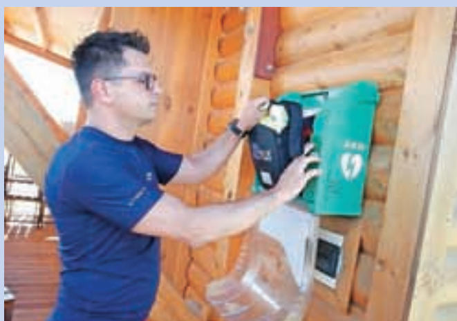
Avtomatski defibrilator so pred časom namestili še na igrišču za golf v Smledniku.

V Medvodah so že lani po vseh večjih zaselkih v občini začeli nameščati avtomatske defibrilatorje. V Sloveniji nenaden zastoj srca doživi deset ljudi dnevno. Ob takem dogodku so pomembne minute in pogostokrat je čas, ki ga potrebuje ekipa reševalnega vozila, da pride do pacienta, predolg in lahko le laiki pripomorejo k zmanjšanju umrljivosti s pomočjo enostavne srčne masaže in uporabe avtomatskega defibrilatorja. Ta je zdaj na voljo tudi na igrišču za golf v Smledniku.