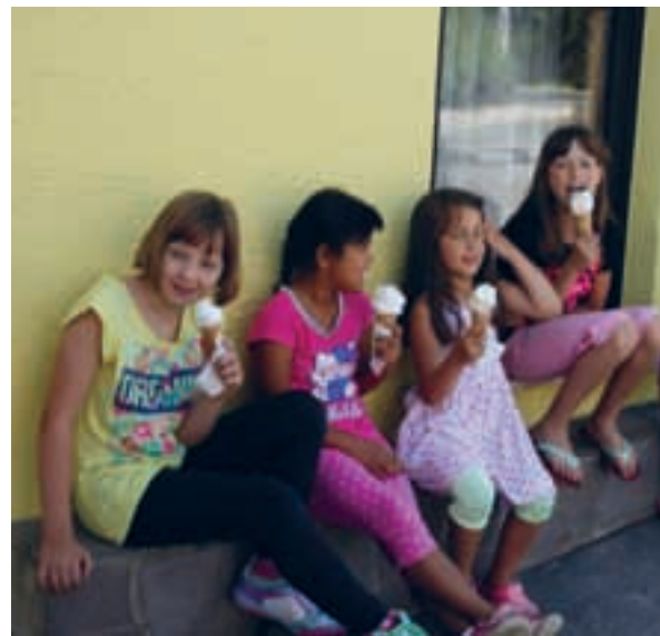
julijski utrinki - počitniško varstvo 2014

Zavod za šport in turizem Medvode, Ostrovrharjeva 4, 1215 Medvode Vodja programa: Špela Kolarič T: +386 51 381 738 (vsak delavnik med 10.00 in 14.00 uro) E: spela@zstmedvode.si W: www.zstmedvode.si in www.kmmedvode.si