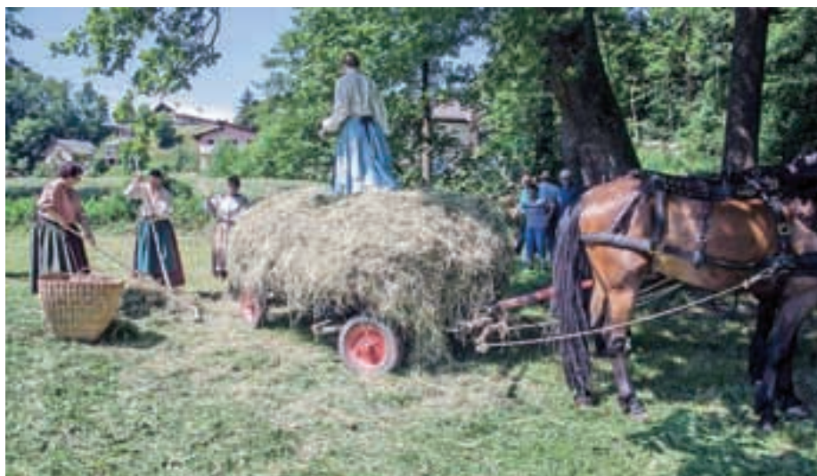
Na Senici so letos prikazali spravilo sena s konjsko vprego.