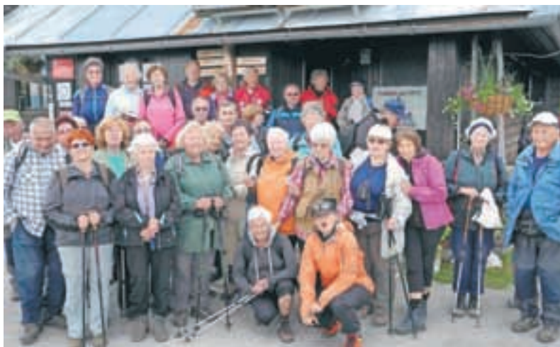
Medvoški upokojenci so se sredi junija odpravili na Kofce.