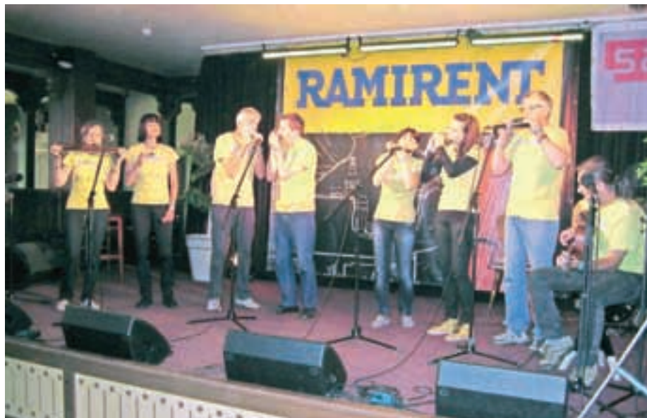
Izvrstni nastopi ansambla ustnih harmonik Sorarmonica so na festivalu v Estoniji obrodili tri medalje.

V Pärnuju je Sorarmonica poleg tekmovalnih nastopov imela še dva krajša nastopa, polovični koncert, organizator pa jih je zadnji dan festi-