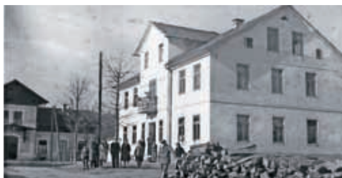
Središče pred nekdanjim starim Colorjem, kjer je bila nekoč restavracija Bohinc, danes pa gostilna Bencak. V ozadju je železniška postaja, ki danes izgleda precej slabše.