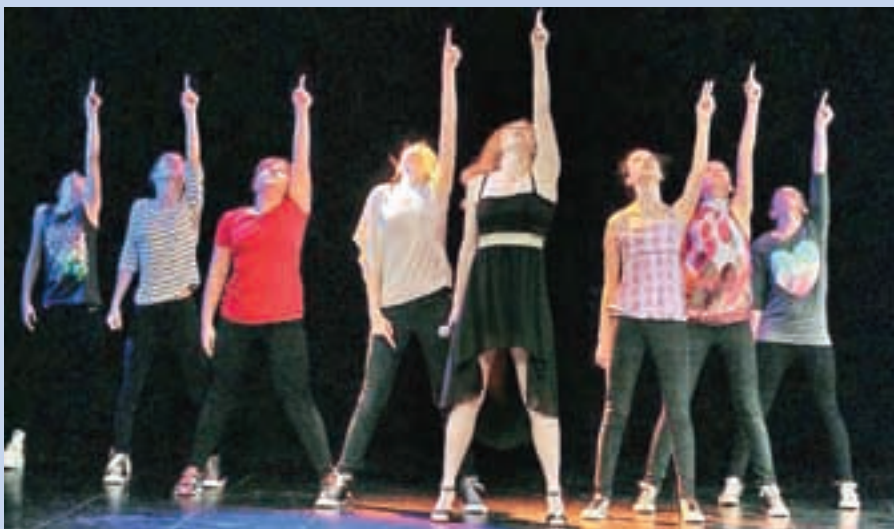
Letošnjo zaključno produkcijo so pripravili na temo Evrosonga.