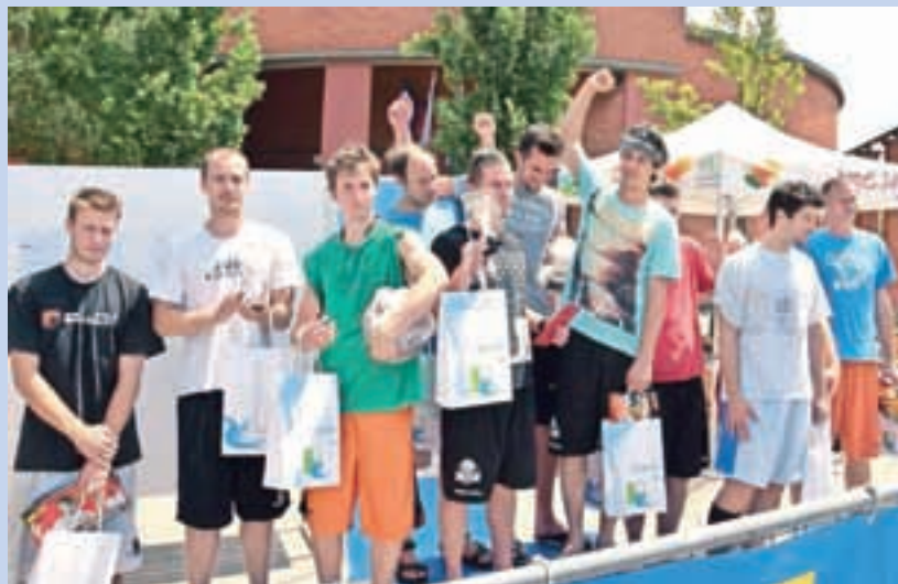
Zmagovalci ulične košarke