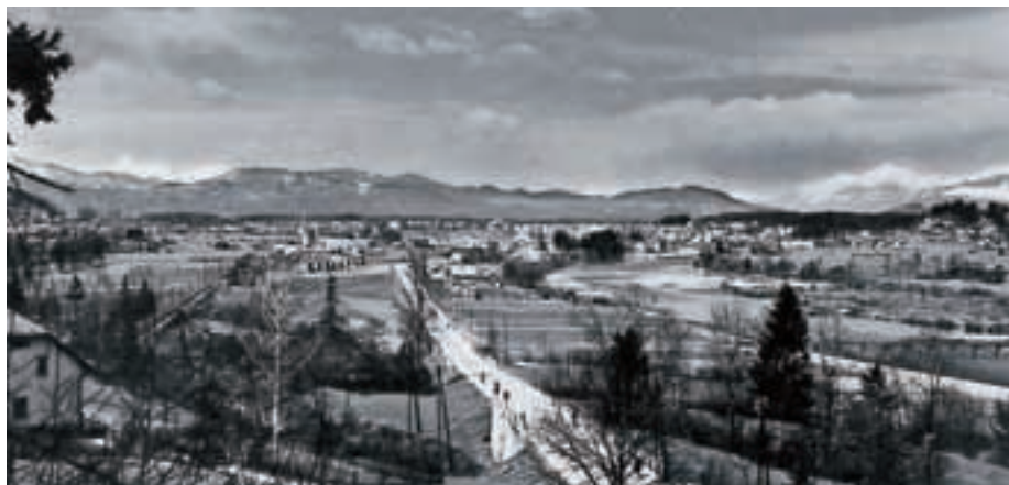
Panorama Medvod, fotografirana okrog leta 1960 s hribočka iz smeri Medna, na katerem danes stoji Hotel Medno. Viden je tudi most, ki vodi čez Savo v Sp. Pirniče in ga že dolgo ni več. Prav tako je viden most na državni cesti, na katerem danes semafor povzroča zastoje.

Znova objavljamo serijo fotografij, s katerimi vam poskušamo približati koščke iz življenja prebivalcev Medvod iz polpretekle zgodovine.