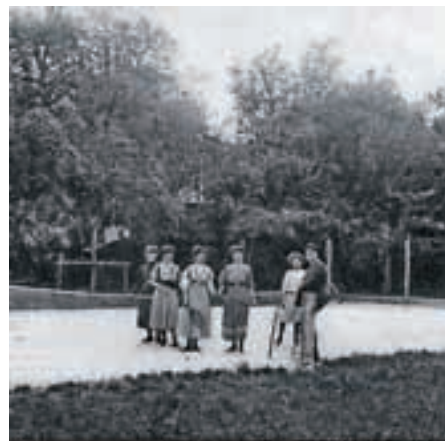
Fotografija z območja med vodama – gospoda igra tenis pri vili Jarc.