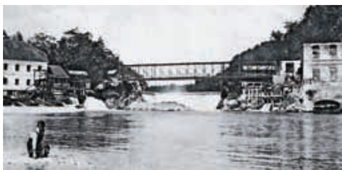
Kovinski kovičen most čez Savo pri današnjem Donitu. Postavili so ga daljnega leta 1877. Na desni strani fotografije je na levem bregu Save – na Verju vidno pogorišče nekdanje medvoške papirnice, ki je pogorela leta 1910.