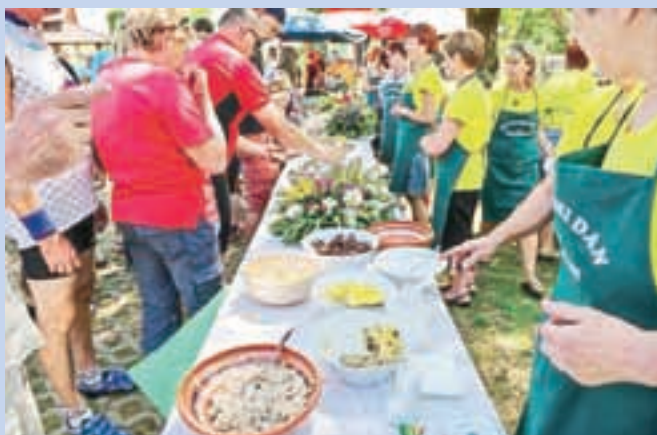
Mize so se šibile pod težo domačih dobrot.