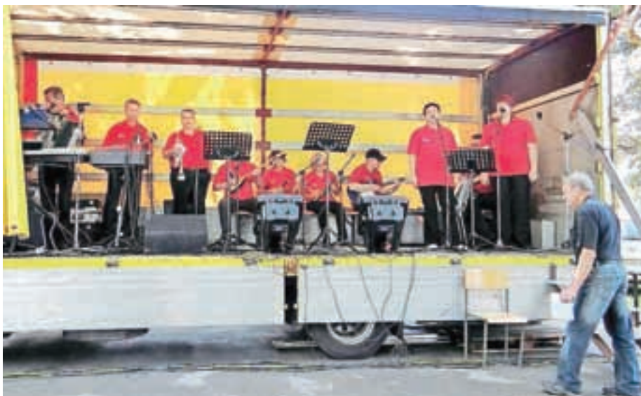
Skupina Strune je s svojim nastopom popestrila tudi srečanje medvoških upokojencev v Valburgi.