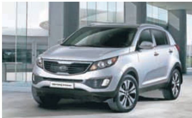
Kia sportage je evropski hit.

Ta teden je Kia venga postala tudi najboljši manjši enoprostor-