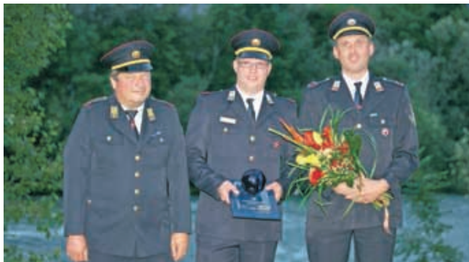
Plaketo so prejeli tudi v PGD Smlednik.

Posredovanja v primerih požarov, so poudarili predlagatelji, še zdaleč niso edino področje, ko gasilci prostovoljci tvegajo tudi svoja življenja, da zaščitijo premoženje in življenje bližnjega. »Naravne katastrofe, kakršni smo bili priča tudi v letošnji zimi, pokažejo, kako pomembna je njihova dejavnost. Več dni so v snegu in žledu opravljali nevarno delo, ko so zagotavljali prevoznost glavnih prometnic in odvrčali nevarnost padajočega drevja na hiše krajanov.« Tudi na drugih področjih, so zapisali v obrazložitvi, lahko kot krajevna skupnost vedno računajo nanje in njihov hiter odziv, ki mnogokdaj prepreči veliko večjo škodo, ki bi jo utrpeli sicer. Veliko pozornosti posvečajo tudi