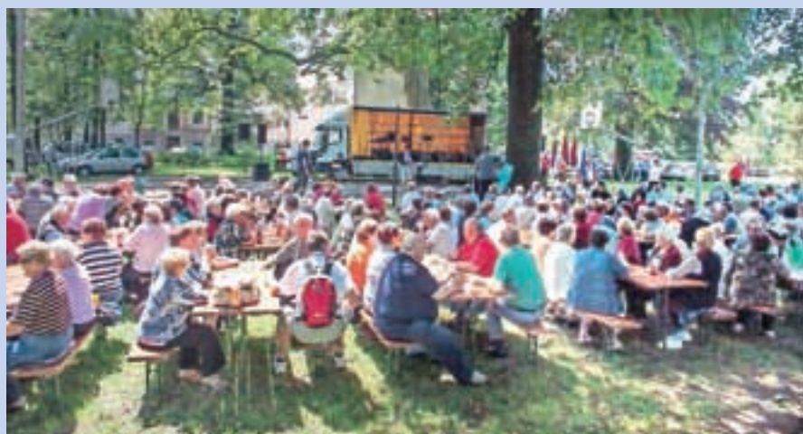
Srečanje medvoških upokojencev v parku graščine Lazarini