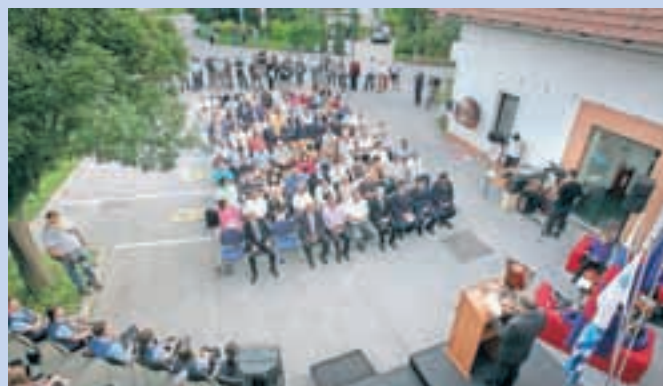
Slavnostna seja občinskega sveta pred stavbo občine

Za občinski praznik so si v Medvodah izbrali rojstni dan zavednega Slovenca Jakoba Aljaža, ki je bil leta 1845 rojen v Zavrhu pod Šmar-nogoro. »On in njegovi sodobniki se kljub takratnim politično težkim