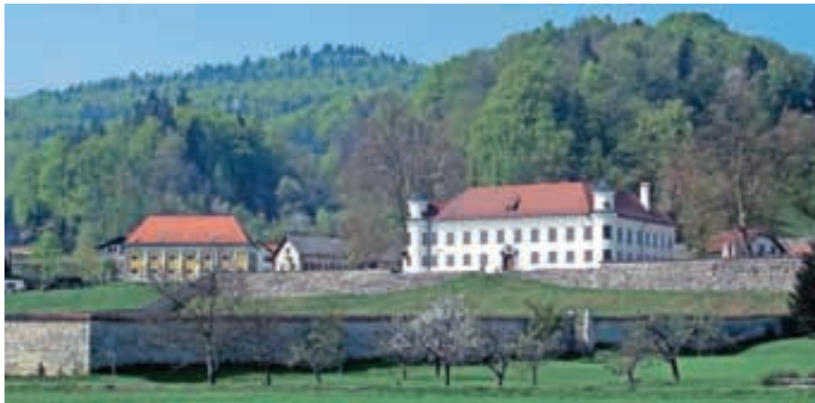
V dvorcu v Goričanah je bilo med drugo svetovno vojno zbirno mesto internirancev.