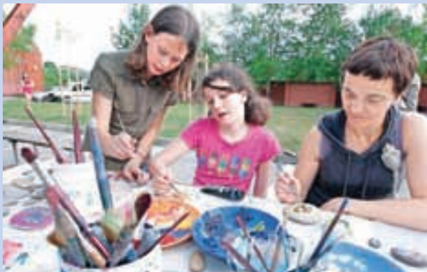
Na Tržnico znanj je vsak lahko prišel po svoj »kilogram« znanja.

Na Tržnici znanj v Medvodah, ki so jo pripravili v okviru Tedna vseživljenjskega učenja, se je predstavilo 46 društev, organizacij in ustanov.